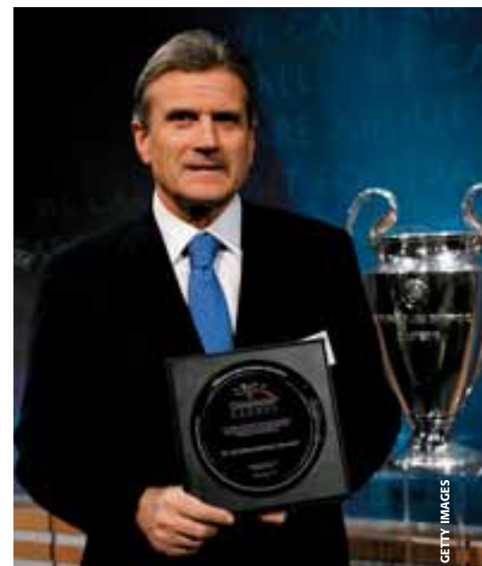
Giacinto Facchetti wurde die UEFA-Plakette für Spieler, die dem Pokal der Meistervereine bzw. der UEFA Champions League ihren Stempel aufgedrückt haben, überreicht.

Der frühere Generaldirektor der UEFA, Gerhard Aigner, sagte in einer Würdigung seines Freundes: «Der Fussball hat eines seiner Kronjuwelen verloren.» Ein Juwel von Klasse zu erkennen ist eine Sache – es nachzumachen, eine ganz andere.