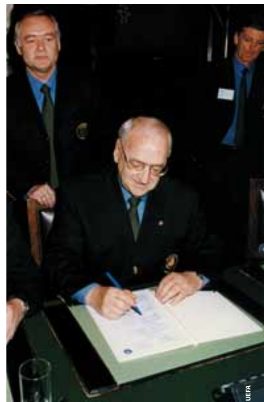
Der DFB war einer der ersten Signatarverbände der Konvention. Der damalige DFB-Präsident Egidius Braun unterzeichnet das Dokument in Gent.

Auf jeden Fall. Das Exekutivkomitee wollte die Standards erhöhen und es den Trainern ermöglichen, sich frei zwischen den Ländern zu bewegen, wie es das EU-Recht vorsah. Alles, was wir getan haben, war stets konform zu EU-Recht. Das Exekutivkomitee war der Auffassung, dass die Trainer die Schlüsselpersonen waren, um für höhere Standards und ein besseres fussballerisches Niveau zu sorgen. Und dies nicht nur auf Profistufe, sondern auch auf Amateur- und Breitenfussballebene. Auch hier bestand die Theorie darin, dass herausragende Trainer herausragende Spieler und herausragende Mannschaften formen können. Natürlich hätte man die Entwicklung im Trainerwesen auch dem Zufall überlassen können, doch wir zogen es vor, bestimmte Strukturen vorzuziehen. Die UEFA setzte auf eine hohe Qualität in der Trainerausbildung. Dem kann man entgegenhalten, dass es grossartige Trainer gegeben hat, die über keine Lizenz verfügten. Das stimmt auch, denn es gibt immer Ausnahmen, die die Regel bestätigen. Früher gab es Leute, die gute