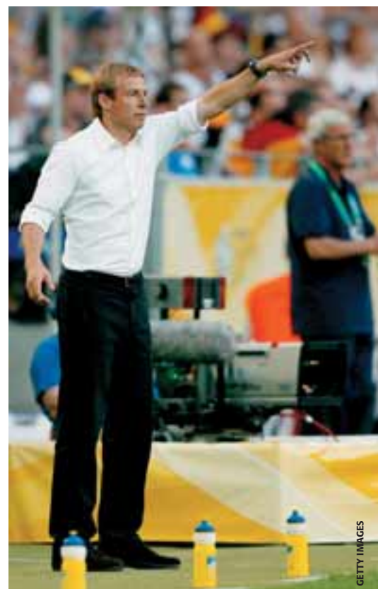
Jürgen Klinsmann wurde per Video-Interview aus Los Angeles zugeschaltet.

Grossen Anklang fand auch die Aussage, dass es nicht nur ein «Juniorenprogramm», sondern auch eine «Juniorenphilosophie» braucht. So wurde gefordert, dass in der Juniorenausbildung vermehrt auf Verbesserungen im