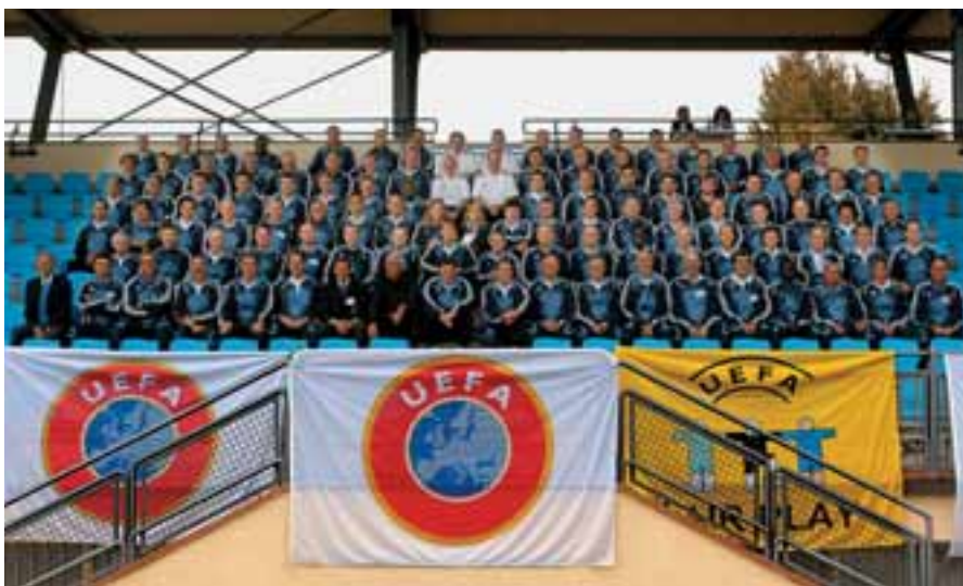
Die Kursteilnehmer in Coverciano.

Deshalb waren einige der Diskussionsrunden in Coverciano von besonderem Wert für die Verbände, die im Bereich der Jugendtrainerausbildung noch Nachholbedarf haben.