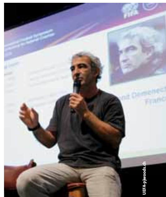
Raymond Domenech lobt die Veteranen.

Eine weitere interessante Anmerkung war jene des brasilianischen Trainers Carlos Alberto Parreira, dessen Seleção während des WM-Trainingslagers in der Schweiz jede Trainingseinheit vor ausverkauften Rängen (4 000 Zuschauer) absolvierte. «Das Niveau