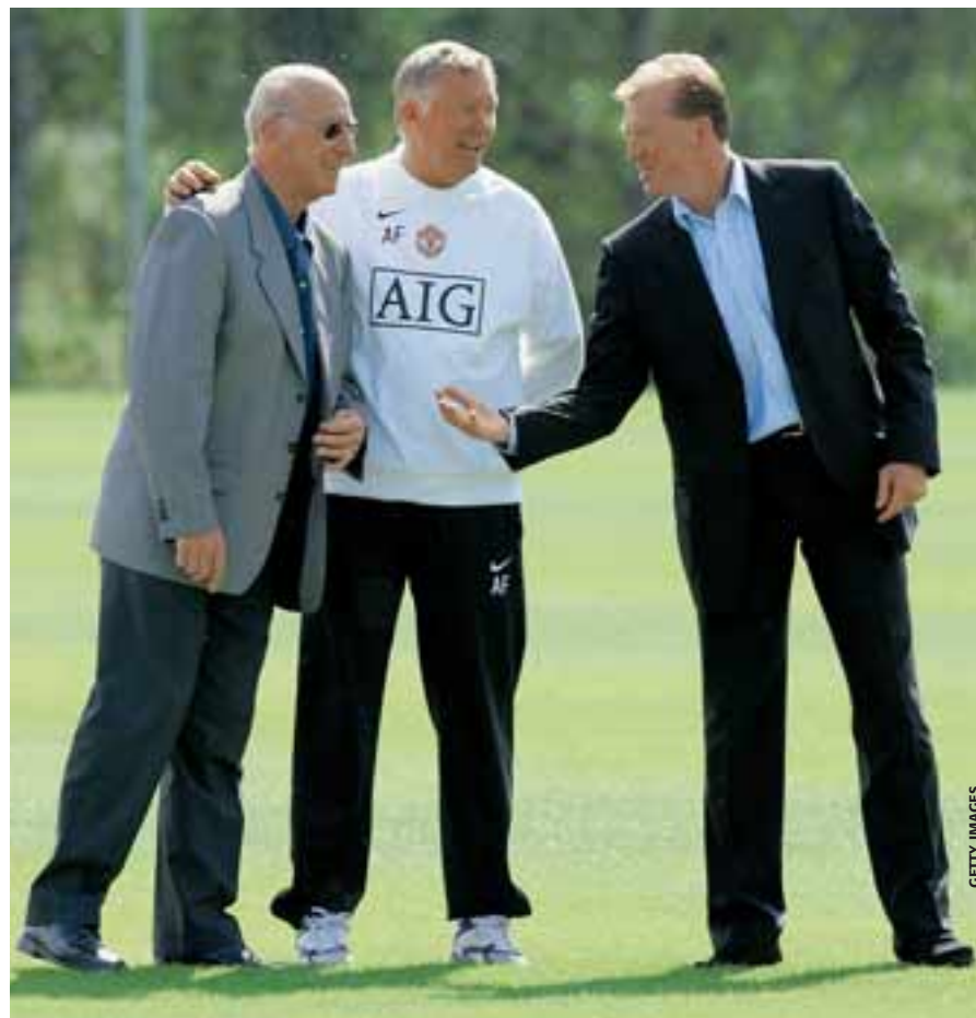
Sir Alex mit Bobby Charlton und dem neuen englischen Nationaltrainer Steve McClaren.

Wunder. Fussball ist ein sehr emotionales Spiel, bisweilen sind die Erwartungen überzogen. Das war immer so und wird sich nicht ändern. Viele Fans leben für ihren Verein, haben eine sehr starke emotionale Bindung zu ihm. Es ist deshalb in gewisser Weise nachvollziehbar, dass vier Niederlagen in Folge nicht akzeptabel sind. Trainerwechsel sind an der Tagesordnung – es gibt allerdings keine Beweise dafür, dass häufige Trainerwechsel Erfolg bedeuten. Trainer wie Fabio Capello, Marcello Lippi, Arsène Wenger und ich beweisen das Gegenteil – nämlich dass Kontinuität Erfolg bringen kann. Ausserdem ist die Beziehung zwischen Coach und Spieler in der Regel enger, wenn man lange zusammenarbeitet.