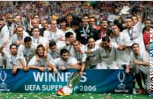
DER FC SEVILLA, GEWINNER DES UEFA-SUPERPOKALS 2006.