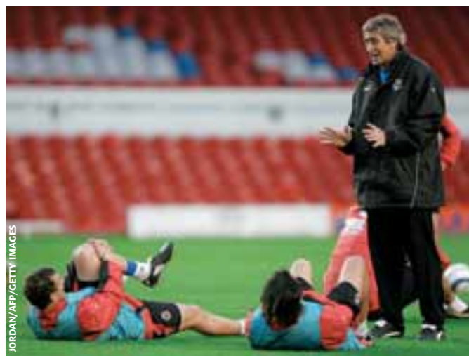
Manuel Pellegrini setzt mit Villarreal auf eine kompakte Verteidigung.

Der moderne Fussball ist stets im Fluss. Verbessert sich die Defensivarbeit, werden auch neue Angriffsvarianten entwickelt – und umgekehrt. Wir Trainer schätzen die Verbesserungen des Defensivspiels, im Wissen darum, dass wir auch neue Angriffsvarianten finden müssen. Konterspiel, Standardsituationen und Einzelvorstösse werden immer wichtiger, um perfekt stehende Verteidigungen