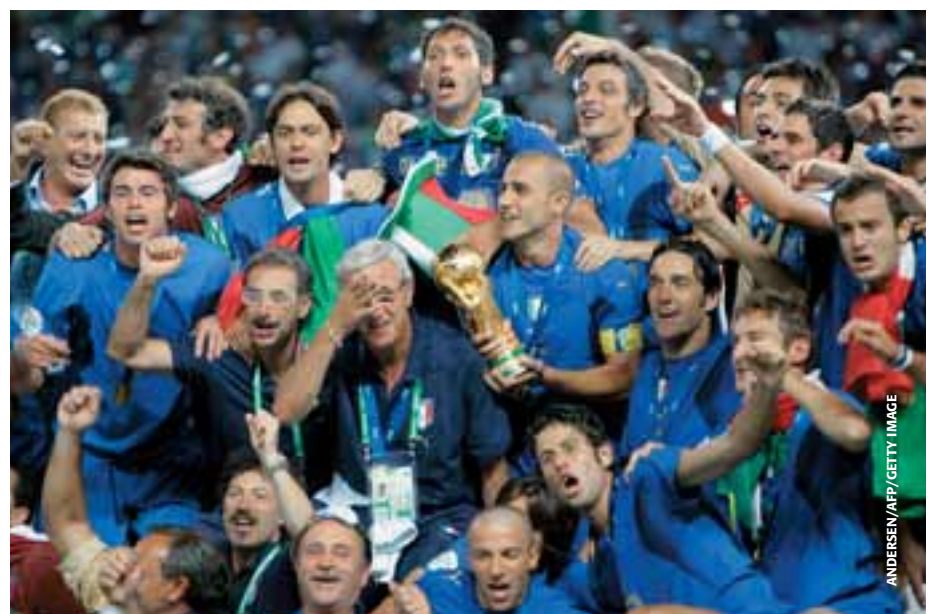
Ein vierter WM-Triumph für Italien.