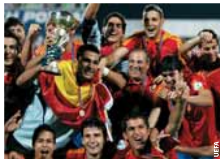
Die spanischen Junioren haben mit dem Gewinn des U19-EM-Titels einmal mehr ihre Klasse unter Beweis gestellt.

AUF EINEN LANGEN UND HEISSEN FUSSBALLSOMMER FOLGT EIN MILDER HERBST – IN FORM VON TECHNISCHEN BERICHTEN. DOCH ALLES DER REIHE NACH. ALS ERSTES GILT ES ABSCHIED ZU NEHMEN VON DER SAISON 2005/06 UND DIE TRAINER ZU BEGLÜCKWÜNSCHEN, DIE SEIT DER LETZTEN AUSGABE DES TECHNICIAN DAS SIEGERPODEST BESTIEGEN HABEN. DIE FIFA FUSSBALL-WELTMEISTERSCHAFT IN DEUTSCHLAND ZEMENTIERTE DIE FUSSBALLERISCHE STÄRKE EUROPAS, STELLTEN DOCH AUSSCHLIESSLICH EUROPÄISCHE TEAMS DIE HALBFINALISTEN UND NAHM DER BRASILIANER LUÍZ FELIPE SCOLARI ALS EINZIGER NICHEUROPÄER AUF DER TRAINERBANK PLATZ.