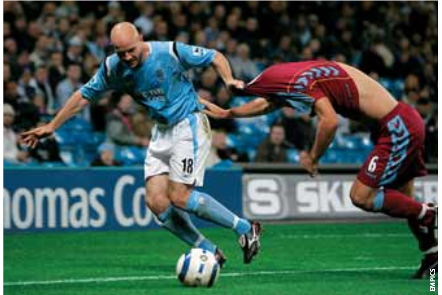
Das Ziehen am Trikot ist nicht immer so offensichtlich wie hier!

Das Thema sorgte in Barcelona nicht nur für Gesprächsstoff zwischen Trainern und Schiedsrichtern, sondern war auch Thema eines ganzen Moduls, bei der die Referees den unerlaubten Einsatz von Händen und Ellbogen als eine der grössten Herausforderungen des modernen Spiel bezeichneten. Immer mehr scheint bei den Spielern