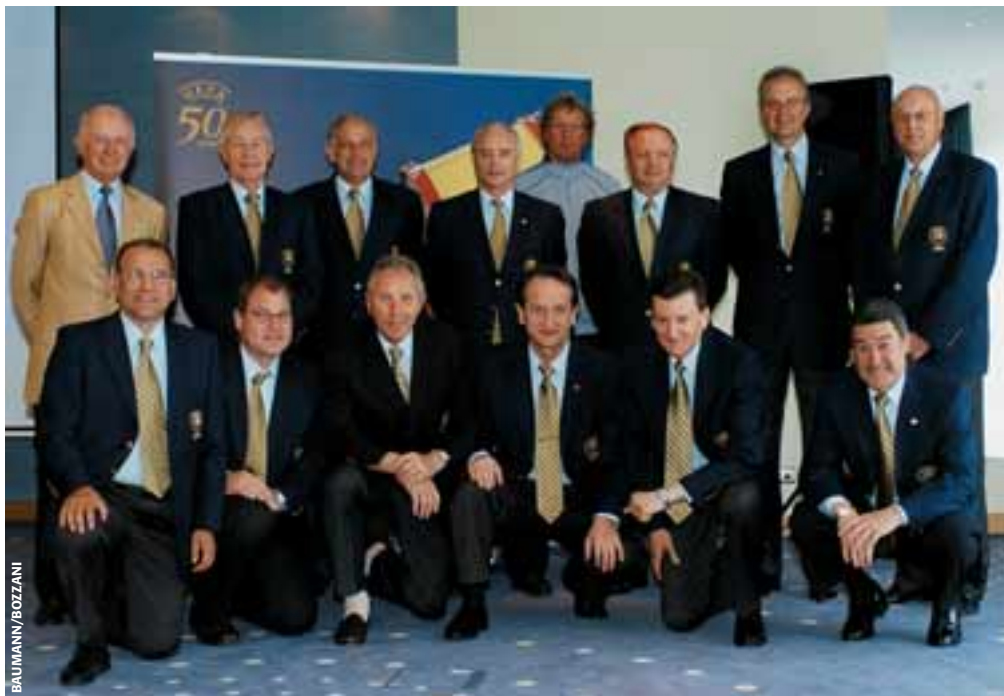
Im Zentrum der Tätigkeiten des Jira-Ausschusses steht die UEFA-Trainerkonvention.

Der nächste Schritt wird sein, den Kreis zu schliessen – d.h. alle 52 Mitgliedsverbände der UEFA sollen in die Konvention – zumindest auf B-Stufe – aufgenommen werden. Der Jira-Ausschuss arbeitet derzeit an einem Projekt, mit dem eine spezielle Jugendlizenz geschaffen werden soll. Andere Bereiche wie Futsal-, Konditions- und Torhütertraining werden untersucht. Die UEFA setzt auf eine regelmässige Neubewertung der Konventionsmitglieder, was bedeutet, dass die Trainerausbildungsprogramme der Verbände alle drei Jahre erneut überprüft werden. Diese Strategie wird in den kommenden Jahren nachhaltig verfolgt werden, da hiervon die Glaubwürdigkeit der Konvention abhängt. Ausserdem werden auch weiterhin die Bestimmungen und die Anforderungen der Konvention laufend unter die Lupe genommen und, wenn nötig, angepasst. Die Ausbildung von Trainern ist ein dynamischer Prozess – die Vorgehensweise der