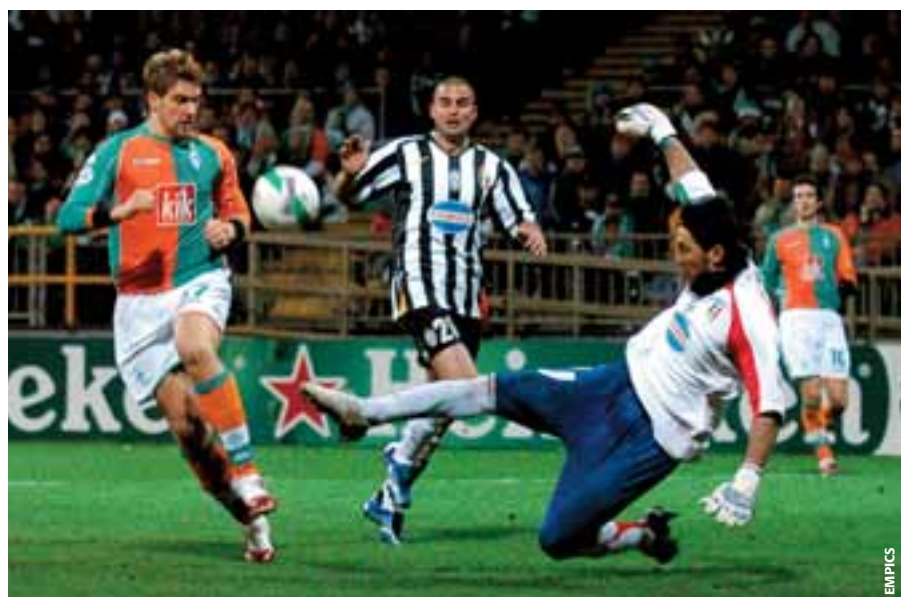
Der Schiedsrichter muss gut positioniert sein, um bei Zweikämpfen die richtige Entscheidung treffen zu können.

Der Schiedsrichter muss so schnell wie möglich in Strafraumnähe gelangen, um 1:1-Situationen zwischen einem Spieler und dem Torwart überblicken zu können.