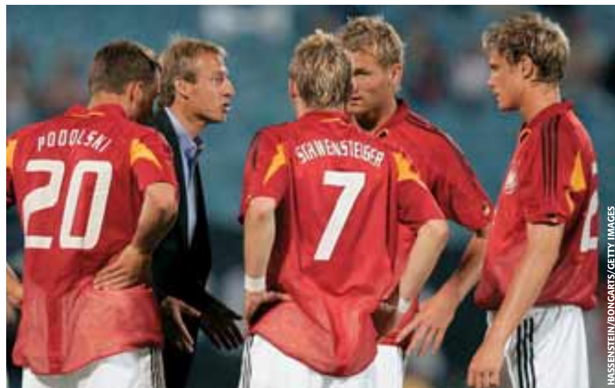
Jürgen Klinsmann gibt seinen Nationalspielern Anweisungen.

Aus unserer Erfahrung am Konföderationen-Pokal können wir schliessen, dass Brasilien und Argentinien in Sachen Spielqualität und im Umgang mit bestimmten Situationen vorne liegen. Andere grosse Nationen wie England, Frankreich oder Italien sind stark und können den Unterschied machen. Wir glauben, dass die Ukraine eine Überraschung sein könnte, da Oleg Blokhin sein Team in den letzten Jahren hervorragend geformt hat. Vor dem Turnier sieht es so aus, als ob Brasilien oder Argentinien es schaffen könnten, aber wir werden sehen.