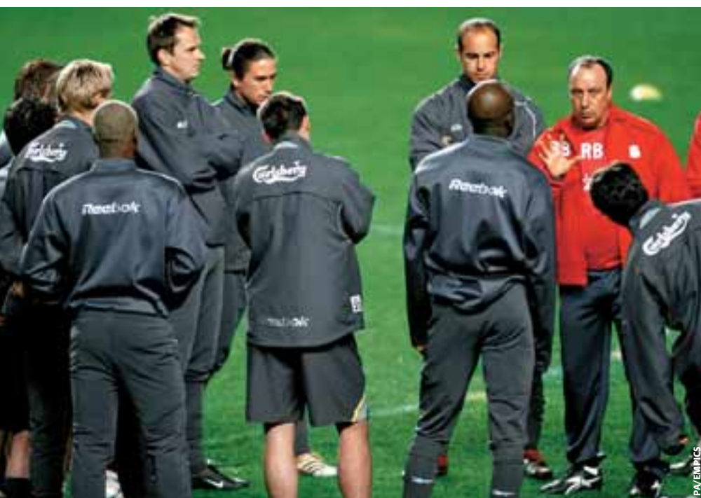
Rafael Benitez gibt den Spielern von Liverpool Anweisungen.

Die Vorteile des Extranet liegen auf der Hand: Der Trainer, der unter Zeitdruck steht, kann sich auf einfachste Weise rasch und papierlos Informationen beschaffen. Das Extranet verfügt über eine viel grössere Kapazität als ein her-