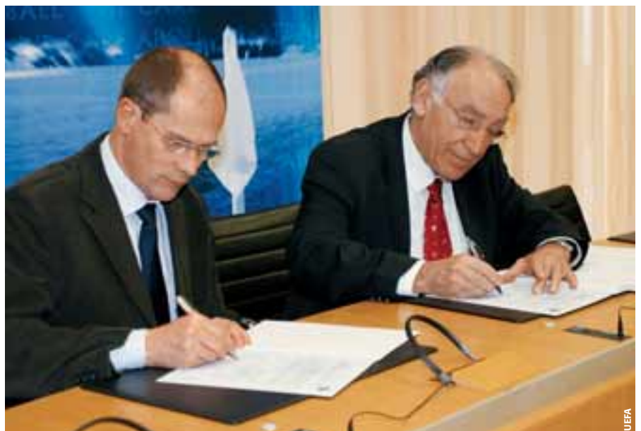
Der Präsident des Französischen Fußballverbandes Jean-Pierre Escalettes und UEFA-Generaldirektor Lars-Christer Olsson unterzeichnen die Konvention.

A-, B-, und Pro-Lizenz – entworfen. Der Ball war somit ins Rollen gebracht, und im Januar 1998 unterzeichneten die ersten sechs Verbände (Dänemark, Deutschland, Frankreich, Italien, die Niederlande und Spanien) die UEFA-Trainerkonvention. Ende 2005 verfügten 48 Verbände über von der UEFA genehmigte Programme – 28 davon können Pro-Lizenzen erteilen. Etwa 150 000 Fußballlehrer in ganz Europa haben heute eine Trainerlizenz, die den Kriterien der UEFA entspricht.