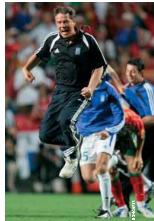
Der Freudensprung von Otto Rehhagel nach dem Sieg Griechenlands über Portugal im Endspiel der EURO 2004.

wortlich für Promotion, Schutz und Weiterentwicklung des Spiels: Spieler, Trainer, Schiedsrichter, Vereine, Administration und Fans. Die Qualität eines Wettbewerbs steht und fällt mit der Zahl von Topteams. Ein paar wenige Spitzenteams reichen nicht. Es braucht Abwechslung und einen Konkurrenzkampf. Denken wir nur an die Auftritte von Valencia in den Jahren 2000 und 2001 – zwei Mal Finalist in der UEFA Champions League, aber nie Gewinner! Oder wie Arsène Wenger mit Arsenal die UEFA Champions League bereichert hat, obwohl er sie (noch) nie gewinnen konnte. Ja, der Reiz des Fussballs liegt in seinen Wettbewerben. In den letzten 50 Jahren wurde an den europäischen Vereins- und Nationalmannschaftswettbewerben Topfussball gezeigt, und es ist entscheidend für die Zukunft des Spiels in Europa, dass wir die beiden Aushängeschilder – die UEFA Champions League und die Europameisterschaft – weiterentwickeln, hegen und pflegen. Schliesslich sind sie das Kerngeschäft des Fussballs und unser unbezahlbares Erbe.