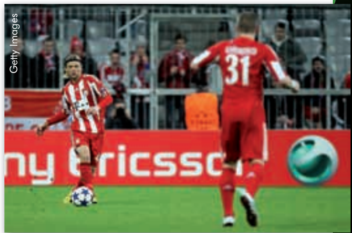
Die Mannschaft des FC Bayern München (Anatolij Tymoschtschuk) brachte es in der Gruppenphase der diesjährigen UEFA Champions League auf fast 600 Pässe pro Spiel.

Die EURO 2004 war auch in gesellschaftlicher Hinsicht ein Wendepunkt: Fanzonen und Fanfeste wurden auf die Beine gestellt; heute sind Sponsoren-Workshops und die Vorbereitungen der Spielorte für die EURO 2012 längst im Gang. Die Liebesgeschichte zwischen den Fans und der Europameisterschaft lässt sich an einem Mann festmachen: Michel Platini, der die Trophäe 1984 als Spielführer im Parc des Princes in Paris entgegennehmen durfte, als alleiniger Rekordhalter mit neun Toren und zwei Hattricks bei einer Endrunde. 1992 reiste er als Cheftrainer der