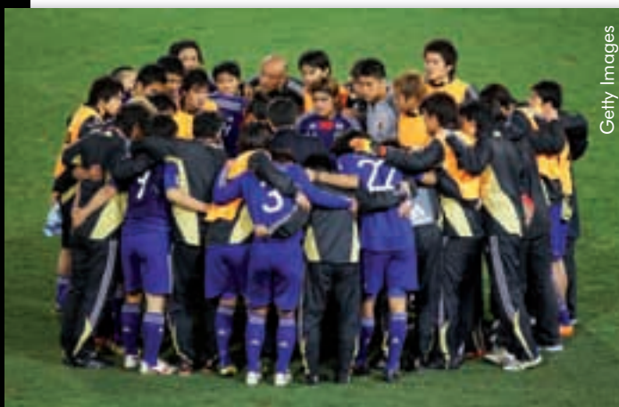
Die japanische Mannschaft vor Beginn der Verlängerung des WM-Achtelfinales 2010 gegen Paraguay.

Was ich über die Trainer sagte, gilt auch für die japanischen Spieler. Klar, es ist eine gute Sache, dass sie das