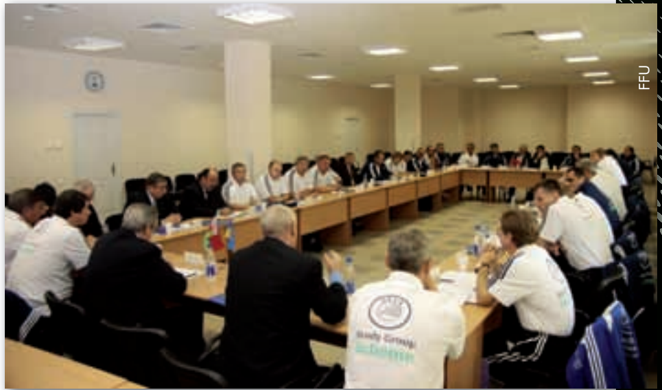
Theoretische Einheit während eines Studienbesuchs in der Ukraine.

Vereinen oder – wie beim Pilotprojekt bei der U21-EM in Dänemark – anhand von umfassenden Spielanalysen behandelt. Die Ausbildungstätigkeit selber, die ebenfalls