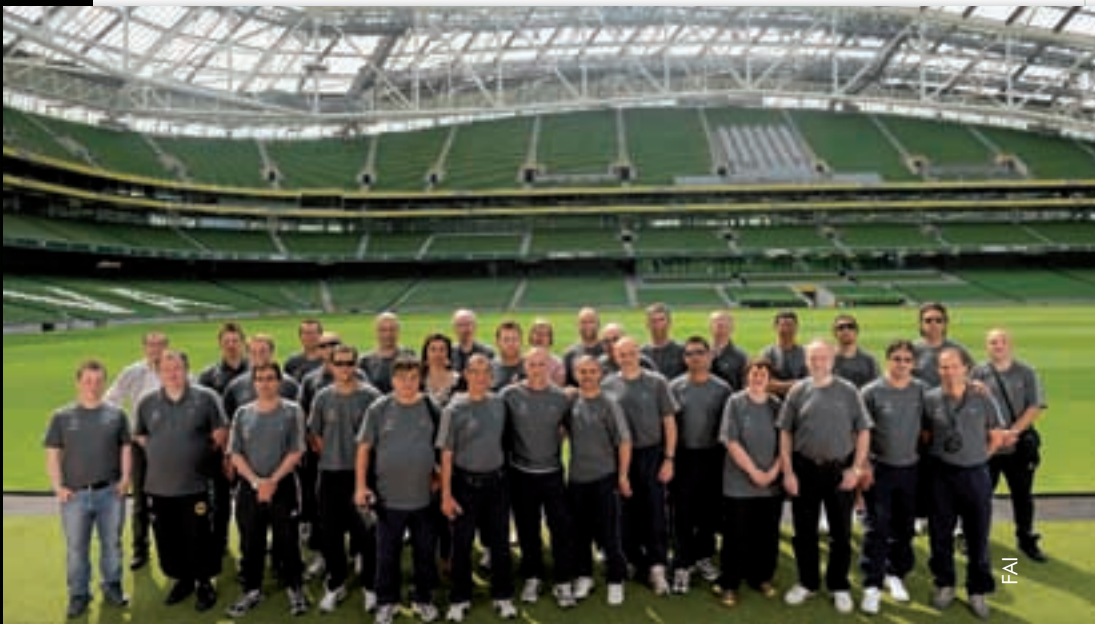
Teilnehmer des Studiengruppen-Programms in der neuen Dublin Arena, Schauplatz des Endspiels der UEFA Europa League 2011.

2011 wird als zweite grosse Neuerung in der Trainerausbildung ein Austauschprogramm eingeführt. Pro-Lizenz-Aspiranten sollen im Rahmen ihrer Ausbildung die Möglichkeit zum Wissensaustausch auf internationaler