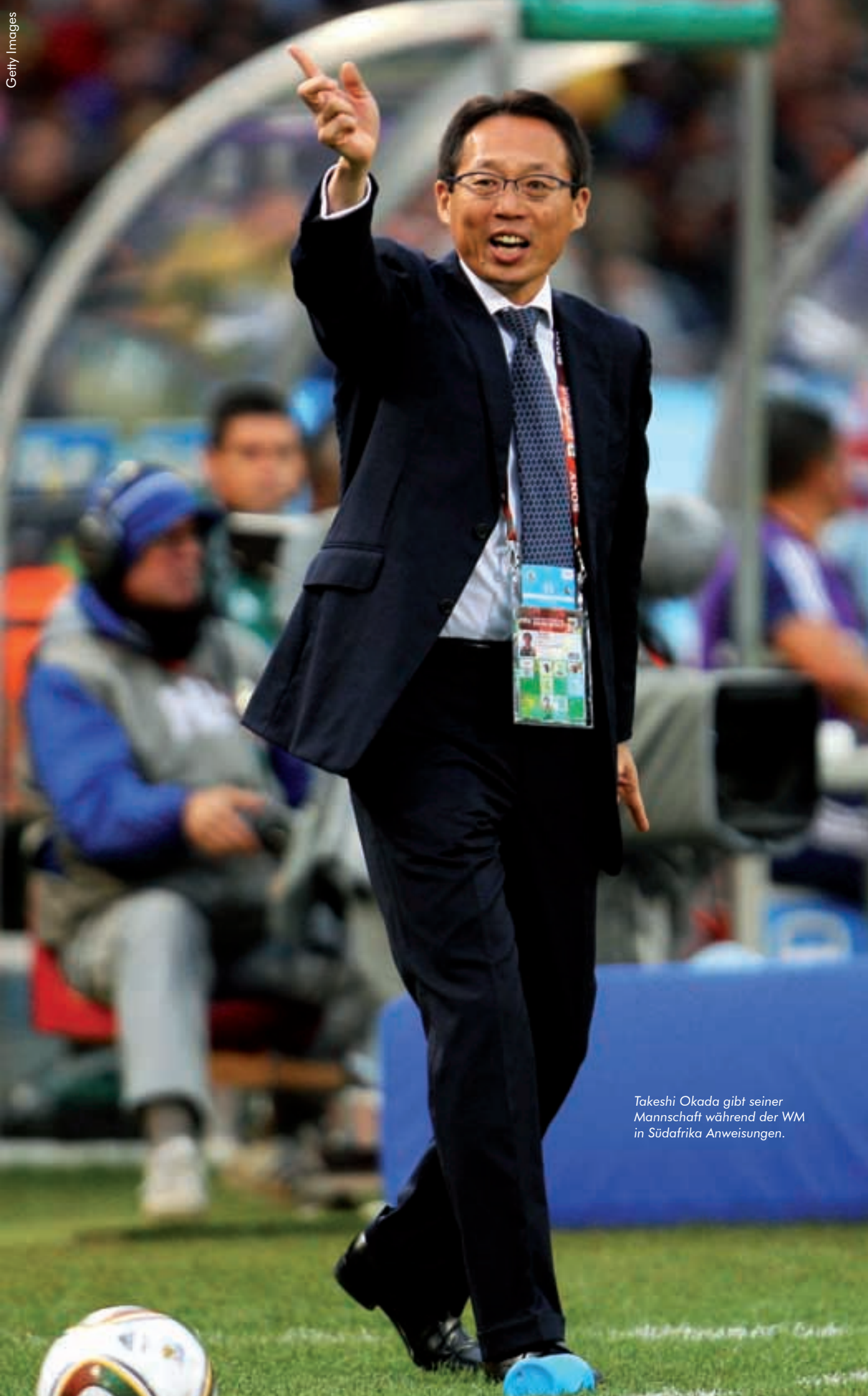
Takeshi Okada gibt seiner Mannschaft während der WM in Südafrika Anweisungen.