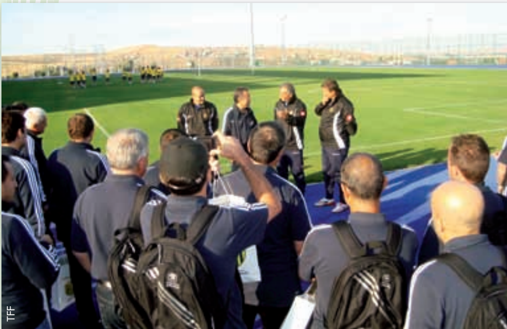
Praktische Einheit auf dem Spielfeld während eines Studienbesuchs in der Türkei.

„Es ist ein spannendes Projekt und – davon ist die UEFA überzeugt – ein echter Mehrwert für die Trainerausbildungsarbeit der Nationalverbände.“ ●