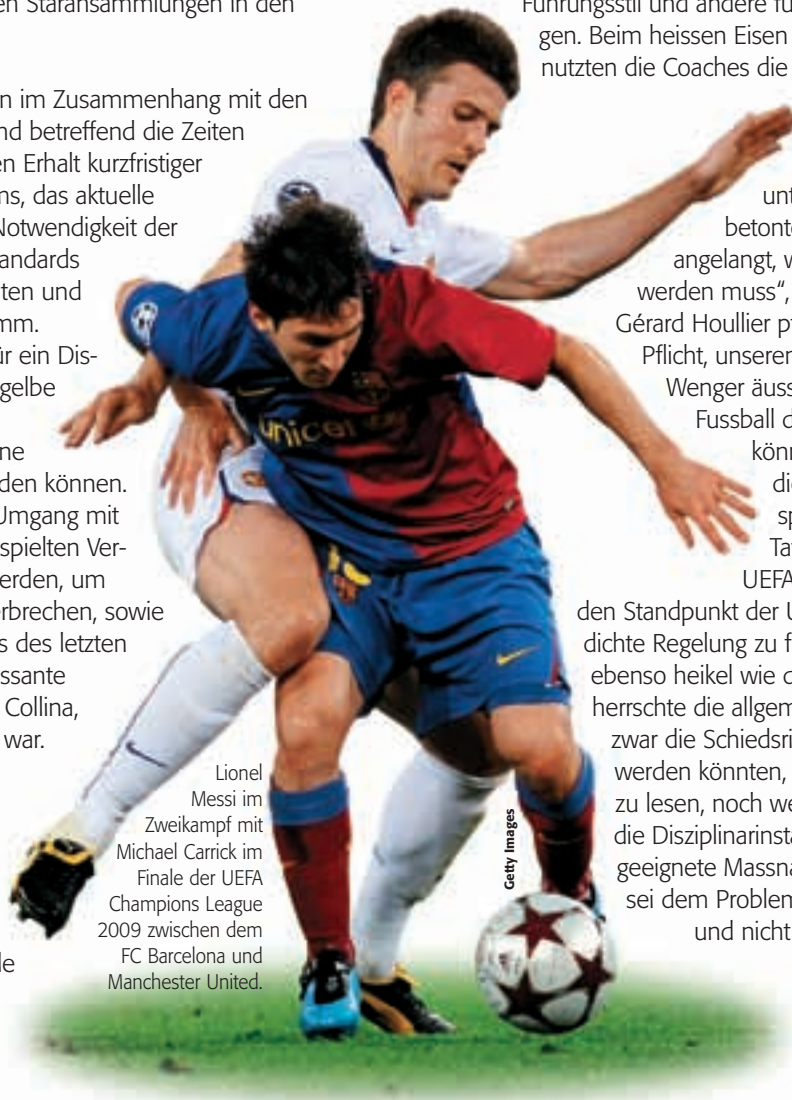
Lionel Messi im Zweikampf mit Michael Carrick im Finale der UEFA Champions League 2009 zwischen dem FC Barcelona und Manchester United.

Ursprünglich standen Fragen im Zusammenhang mit den UEFA-Klubwettbewerben und betreffend die Zeiten für das Aufwärmtraining, den Erhalt kurzfristiger Visa für multinationale Teams, das aktuelle Disziplinarsystem und die Notwendigkeit der Verankerung von Mindeststandards für den Rasen in Reglementen und Richtlinien auf dem Programm. Die Trainer sprachen sich für ein Disziplinarsystem aus, in dem gelbe Karten als „Belohnung“ für mehrere Spiele in Folge ohne Verwarnung gestrichen werden können. Daneben ging es um den Umgang mit taktischen Fouls oder vorgespülten Verletzungen, die eingesetzt werden, um einen Gegenangriff zu unterbrechen, sowie um die Bestrafung bei Fouls des letzten Manns im Strafraum. Interessante Einblicke gab auch Pierluigi Collina, der als Gastredner geladen war. Ausserdem wurde über die Lockerung des Sitzzwangs in der technischen Zone und über das Experiment mit zwei zusätzlichen Schiedsrichterassistenten gesprochen. Letzteres wurde von den Anwesenden für gut befunden, da es ein Zeichen des Fortschritts darstelle.