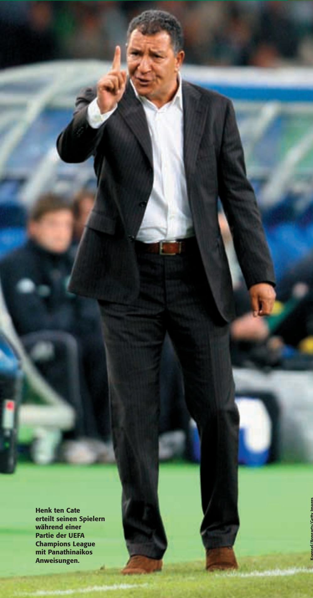
Henk ten Cate erteilt seinen Spielern während einer Partie der UEFA Champions League mit Panathinaikos Anweisungen.