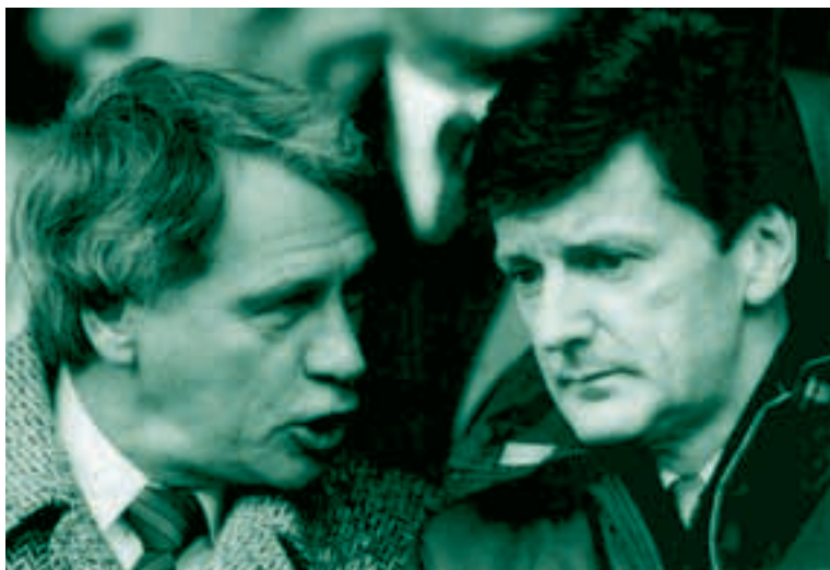
Der ehemalige englische Nationaltrainer Sir Bobby Robson im Gespräch mit seinem schottischen Gegenpart und heutigen Technischen Direktor der UEFA, Andy Roxburgh.

Als Bobby Newcastle United verliess, rief er Gérard Houllier an, der sich gerade vom FC Liverpool getrennt hatte. Ohne eine Spur von Arroganz fragte er, die Bescheidenheit in Person: „Wie wollen die uns bloss ersetzen?“ Diese Frage bedurfte keiner Antwort. Bobby Robson war einmalig. Ein Fußballer durch und durch, eine Inspiration für viele – jemand, an den man sich mit Bewunderung und einem Lächeln erinnern wird.