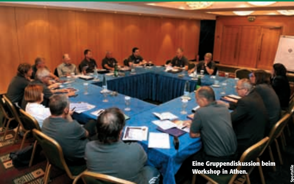
Eine Gruppendiskussion beim Workshop in Athen.