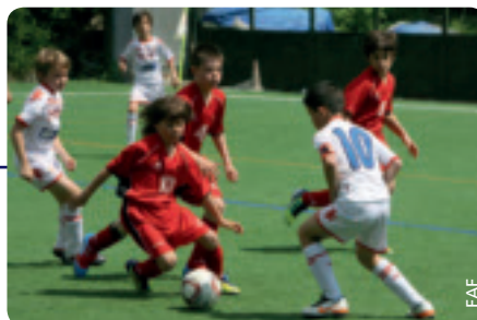
Ein Turnier mit Traditionscharakter.

In vergangenen Ausgaben waren vor allem spanische Klubs wie Espanyol Barcelona, der FC Valencia oder CA Osasuna erfolgreich. Am wichtigsten sind bei diesen Turnieren jedoch stets der Spaßfaktor und Teamgeist. Der andorranische Verband ist der Überzeugung,