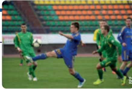
Alle Spiele der belarussischen Premier League können fortan live im Internet mitverfolgt werden.

Das Internet ist heute das Massenmedium schlechthin. Die BFF entschied sich also, ihre Bemühungen in diese Richtung zu lenken, und unterzeichnete mit einer der beliebtesten belarussischen Websites, www.tut.by, eine Vereinbarung über technischen Support.