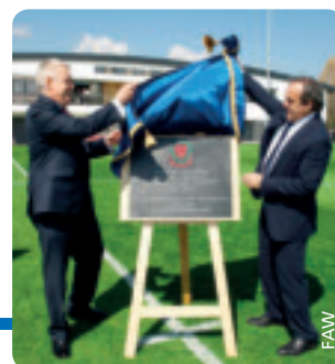
Michel Platini und der Erste Minister von Wales, Carwyn Jones, bei der Enthüllung der Gedenktafel.

Die Infrastruktur des Zentrums umfasst drei Spielfelder (zwei hochwertige Rasenfelder und ein Kunstrasenfeld der neuesten Generation) sowie ein hochmodernes Verwaltungsgebäude mit Umkleekabinen und einem Regenerationsbereich. Die Einrichtung erhält den Beinamen „Dragon Park“.