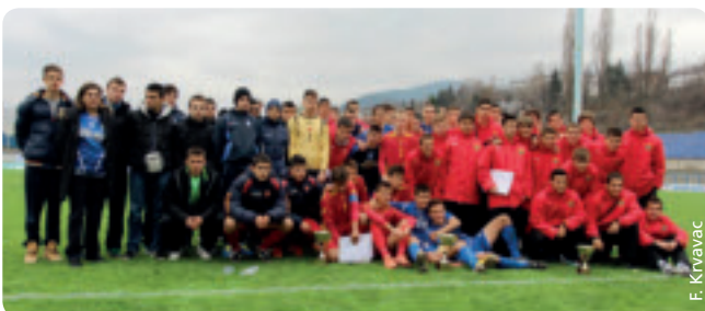
Gruppenfoto nach der Pokalübergabe.