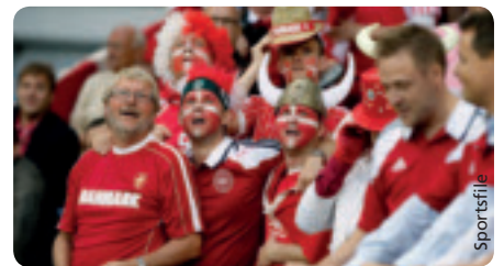
Der dänische Verband will Länderspielbesuche noch attraktiver gestalten.

Inspiziert vom Englischen Fußballverband führt der Dänische Fußballverband (DBU) eine Studie über die Erfahrungen der Fans bei Spielen der dänischen Nationalmannschaft durch. Der DBU möchte die Studienergebnisse dazu nutzen, Länderspiele für die Fans zu einem noch schöneren Erlebnis werden zu lassen, um dadurch den Ticketverkauf anzukurbeln.