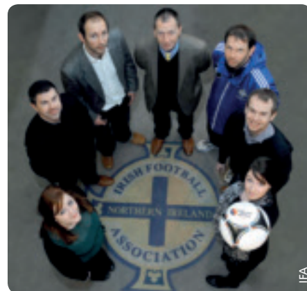
Startschuss für das Programm gegen soziale Ausgrenzung.

Ein Teil des Konzepts besteht darin, den Fußball zu nutzen, um wichtiges Wissen über gesunde Ernährung und mentale Gesundheit zu vermitteln. Das auf drei Jahre angelegte Projekt umfasst eine Reihe von Fußballtrainingsprogrammen in Grundschulen. Zielgruppe sind einerseits die Schüler, andererseits sollen aber auch die Betreuer bei ihren Schulungskursen Ernährungstipps erhalten. Darüber hinaus werden Seminare für die Klubs organisiert, in denen gesunde Ernährung und mentale Gesundheit im Mittelpunkt stehen werden. Des Weiteren wird der Verband Erste-Hilfe-Kurse und Informationsveranstaltungen zur Verwendung von Defibrillatoren anbieten.