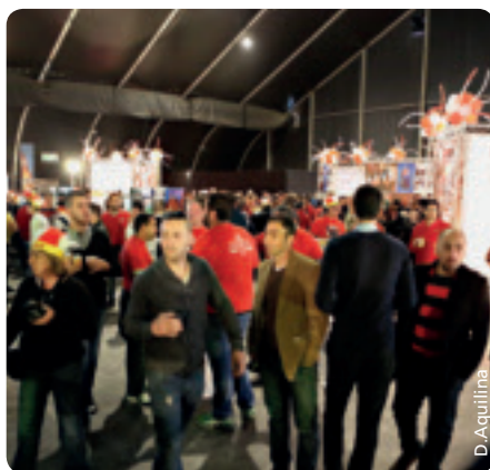
Zusätzliche Unterhaltung für die Fans.

Im und um das Stadion herum herrschte ein wahres Farbenmeer und namentlich ein Fanpark, der bereits Stunden vor der Partie Unterhaltung bot, sorgte für gute Stimmung. Diese von der Marketingabteilung des Maltesischen Fußballverbands organisierte Aktion war eine Premiere und gleich ein großer Erfolg, sowohl als Werbung für das Spiel als auch in Sachen Merchandising und