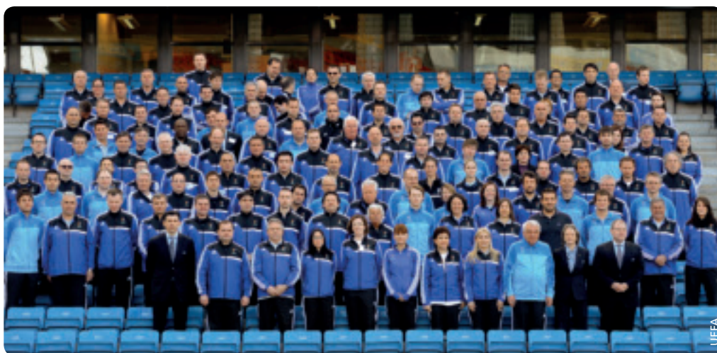
Die Workshopteilnehmer im Ullevaal-Stadion.

Der Workshop in Oslo war ein voller Erfolg. Weitere Informationen dazu sind im beiliegenden UEFA-Breitenfußball-Newsletter enthalten. ●