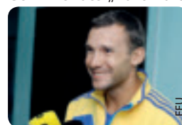
Andri Schewtschenko auf den Spuren seines Vorbilds Waleri Lobanowski.

Die Lizenzierungsabteilung des Ukrainischen Fußballverbands hat am 1. April 2013 einen A-Lizenz-Kurs für ehemalige Profis gestartet. Zu den Teilnehmern dieses Trainerkurses zählt der frühere ukrainische Nationalspieler Andri Schewtschenko, drittbester Champions-League-Torschütze der Geschichte und Gewinner des „Ballon d'Or“ im Jahr 2004.