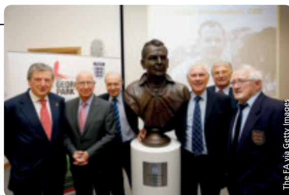
Büste zu Ehren von Trainerpionier Walter Winterbottom.

Die FA beschäftigt heute mehr als 150 Vollzeittrainer und -trainerausbilder und hat