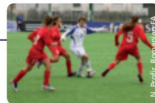
Ein rundum gelungenes Turnier.

In der Tat waren sich alle Anwesenden einig, dass die Veranstaltung ein Erfolg war. Die meisten der zwölf Spiele wurden auf einem sehr guten Niveau geführt und zeichneten sich durch große Fairness aus. Das Turnier der Juniorinnen gewann das Team aus Serbien