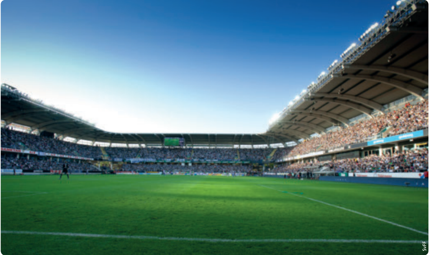
Das Gamla-Ullevi-Stadion in Göteborg, in dem Gruppe A entschieden wird.

Am 4. Oktober 2010 wurde Schweden zum Ausrichter der Women's EURO 2013 ernannt. Die Bewerbung der Skandinavier war im Rahmen eines Konzepts zur Förderung des Frauenfußballs mit dem Slogan „Winning Ground“ erfolgt.