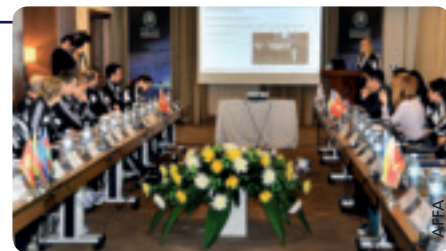
Workshop zum Thema Frauenfußball in Baku.

Die Veranstaltung stellte mit den Präsentationen der teilnehmenden Delegationen und den intensiven Diskussionen eine wertvolle Gelegenheit dar, um sich über die gemeinsamen Werte und künftigen Ziele in der Fußballentwicklung auszutauschen. Im Mittelpunkt der Diskussionen standen insbesondere verschiedene Projekte zur Verbesserung der technischen Standards im Frauenfußball, der Breitenfußball und Juniorinnenligen, die Ausbildung von Frauen und deren aktive Teilnahme am gesellschaftlichen Leben sowie PR-Fragen rund um den Frauenfußball.