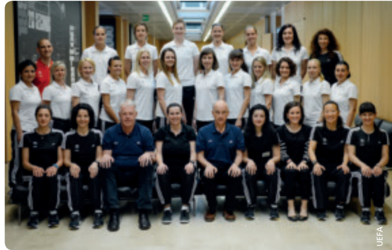
Die Teilnehmerinnen des ersten CORE-Workshops für Schiedsrichterinnen in Nyon.