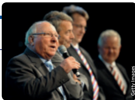
Uwe Seeler rührt die Werbetrommel.

„Was hier in Malente entstanden ist, ist wirklich aller Ehren wert. Großartig!“ Umfänglicher hätte das Kompliment des Präsidenten des Deutschen Fußball-Bundes (DFB), Wolfgang Niersbach, bei der Einweihung des Uwe-Seeler-Fußball-Parks nicht ausfallen können. Neben dem „Chef“ des deutschen Fußballs waren rund 200 geladene Gäste, darunter natürlich auch Namenspate Uwe Seeler, in die ehemalige Sportschule nach Malente gekommen, um die offizielle Wiedereröffnung des traditionellen Standorts zu feiern.