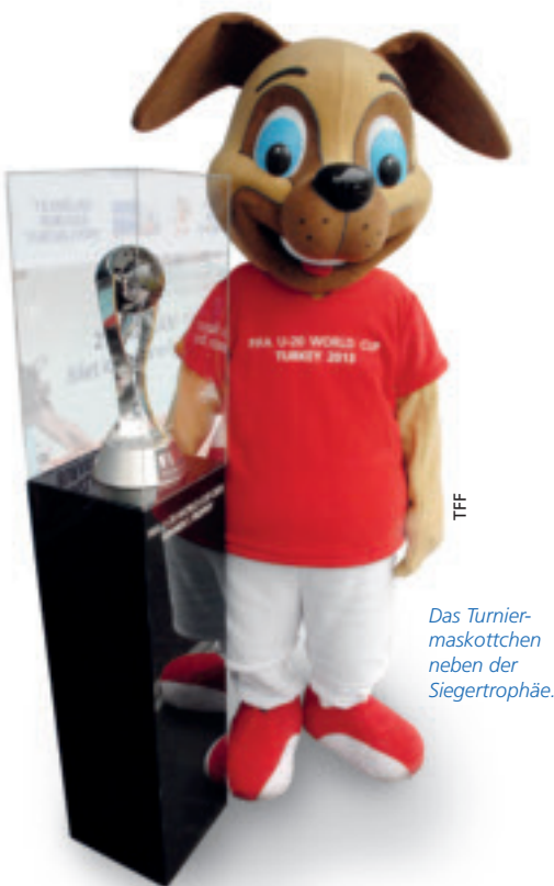
Das Turniermaskottchen neben der Siegetrophäe.

Der „Etappenplan“ der Trophy Tour der U20-WM 2013 in der Türkei: 20./21. April – Kayseri; 27./28. April – Antalya; 4./5. Mai 2013 – Gaziantep; 11./12. Mai – Trabzon; 18./19. Mai – Rize; 25./26. Mai – Bursa; 1./2. Juni – Istanbul. ● Aydın Güvenir