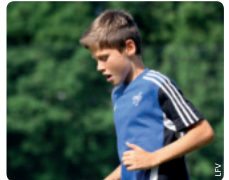
Die Sportschule Liechtenstein als Vorbereitung auf eine Laufbahn im Spitzensport.

Seit bald zehn Jahren gibt es in Liechtenstein eine Sportschule, die leistungsorientierten jungen Sportlerinnen und Sportlern die Möglichkeit bietet, sich gezielt auf eine Laufbahn im Spitzensport vorzubereiten und den Leistungsgedanken sowohl im Sport als auch in der Schule umzusetzen.