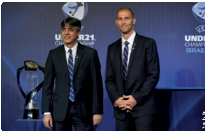
Die ehemaligen israelischen Nationalspieler Eli Ohana (links) und Avi Nimni fungieren als Endrundensbotschafter für die U21-EM.

Der Eintrittskartenverkauf läuft angesichts des hochkarätigen Teilnehmerfelds sehr gut. Die Gastgeber werden das Turnier im 13800 Zuschauer fassenden Stadion in Netanya gegen Norwegen eröffnen. Das zweite Spiel der Israelis gegen Italien