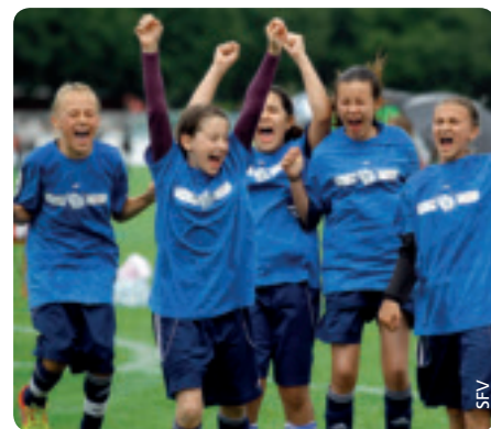
Ausgelassene Stimmung nach dem Gewinn der Schweizer Schulfußball-Meisterschaft.

Die Mädchen aus Laupen im Zürcher Oberland schrieben wahrlich Cup-Geschichte: Im vergangenen Jahr holten sie in der Kategorie 7. Klasse den Titel, den sie in den drei vorangehenden Jahren schon in den Kategorien 4., 5. bzw. 6. Klasse erspielt hatten, und schafften damit eine bis anhin unerreichte Siegesserie.