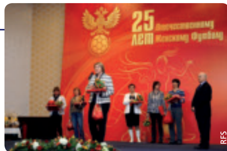
Feier zum 25-jährigen Bestehen des Frauenfußballs in Russland.

Der russische Frauenfußball nahm vor nunmehr einem Vierteljahrhundert seinen Anfang: Das erste Frauenfußball-Turnier der Sowjetunion hatte im August 1987 in Chisinau stattgefunden und die wöchentliche Zeitschrift Sobesednik vergab zu diesem Anlass besondere Preise an junge Spielerinnen. Der russische Fußball feierte damals bereits sein 90-jähriges Bestehen, wohingegen die Entwicklung des Frauenfußballs noch in den Kinderschuhen