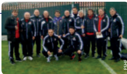
Die Anwärter auf die UEFA-Pro-Lizenz.

Die teilnehmenden Fußballtrainer sind mit dem Kurs sehr zufrieden und bezeichneten ihn