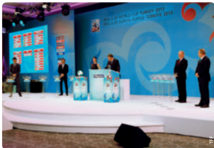
FIFA-Generalsekretär Jérôme Valcke leitet die Auslosung.