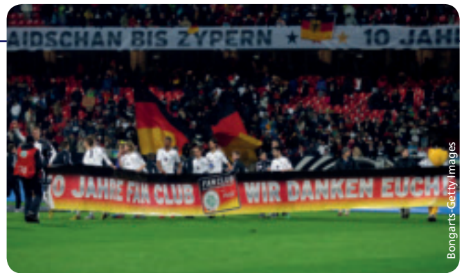
Feier zum zehnjährigen Bestehen des Fan Clubs Nationalmannschaft in Nürnberg.

Der Fan Club gibt den Anhängern der DFB-Auswahl nicht nur eine Struktur, aus ihm heraus werden auch viele Angebote generiert, wie etwa Reisen zu den Länderspielen im In- und Ausland. Außerdem bietet er die Möglichkeit, die Länderspiele aktiv mitzugestalten. „Wenn ich an den Fan Club denke, fallen mir unweigerlich die Gänsehaut-Momente ein, die uns die Fans beschenken. Und davon gab es in den vergangenen Jahren einige. Die Choreographien, die Gesänge, die Unterstützung zur rechten Zeit, der Aufwand, den die Fans betreiben, um uns