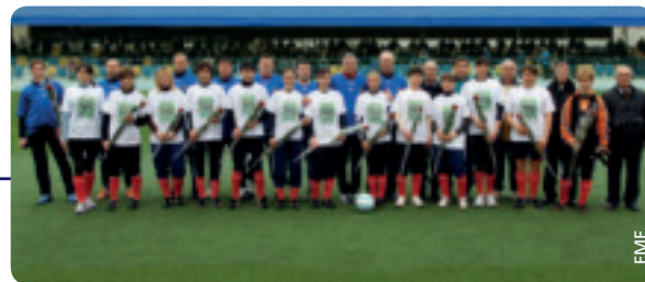
Ausgeglichenes Ergebnis in der Partie zwischen Frauen und Männern.

Vor dem Anpfiff überreichten die Spieler den Spielerinnen Blumensträuße. In einer schwungvollen Partie lag die Frauenmannschaft fast die ganze Zeit über in Führung. Erst in letzter Minute kamen die Männer zum Ausgleich, der Endstand lautete 11:11.