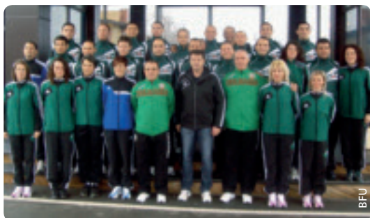
Die Teilnehmer des Schiedsrichter-Workshops.