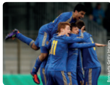
Die ukrainische U17-Auswahl feiert in der Eliterunde einen Treffer gegen Deutschland.