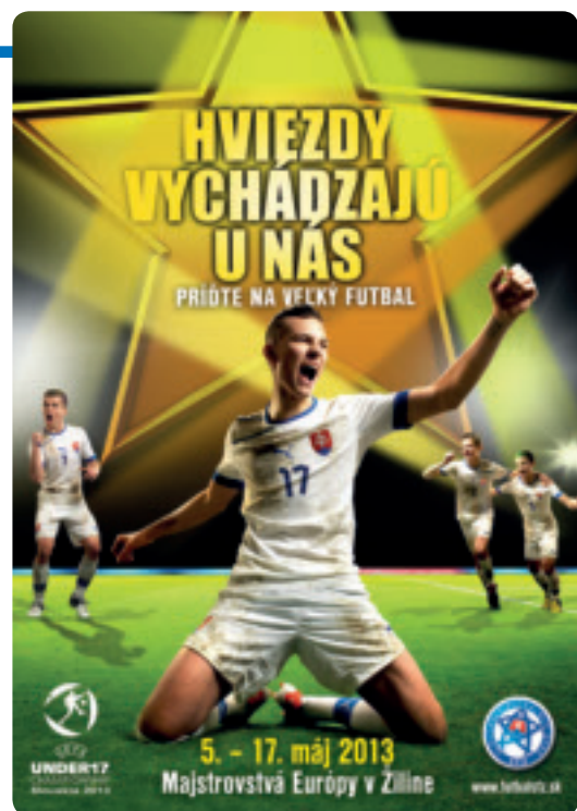
Das Werbeplakat für das Turnier.

Aufgrund der zwei Turnierzentren gibt es auch zwei Botschafter: Zum einen den aus Nitra stammenden Ľubomír Moravčík, eine Legende des slowakischen Fußballs,