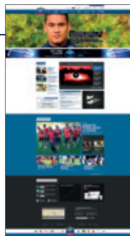
Eine brandneue Website für die FFF.

Eine weitere Rubrik umfasst die Pokalwettbewerbe und Meisterschaften. Hier werden die Ergebnisse und Tabellen aller Spielklassen aufgeführt – von der ersten Liga bis hin zur Distriktebene. Auf Pokalebene liegt der Schwerpunkt auf den europäischen Klubwettbewerben.