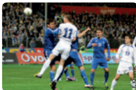
Bosnien-Herzegowina hat dank dem Sieg gegen Griechenland einen großen Schritt Richtung Brasilien gemacht.

Die für die Klublizenzierung zuständige Abteilung des Bosnisch-Herzegowinischen Fußballverbands (NSBiH) und Vertreter der UEFA führten ein Seminar mit Vertretern der bosnisch-herzegowinischen Erstligaklubs und den neu gewählten Mitgliedern der beiden Lizenzierungskommissionen (erste Instanz und Berufungsin-stanz) durch.