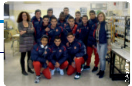
Die maltesischen Spieler nach dem Ablegen ihrer Prüfungen unter griechischer Aufsicht.

Diese Geschichte zeigt, dass auch unkonventionelle Lösungen für Probleme in Zusammenhang mit Prüfungsterminen und Sportveranstaltungen gefunden werden können, solange der Wille dazu vorhanden ist.