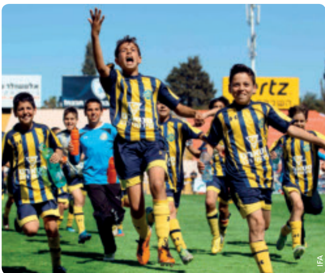
Ein Tag der offenen Tür im Zeichen der Freude.