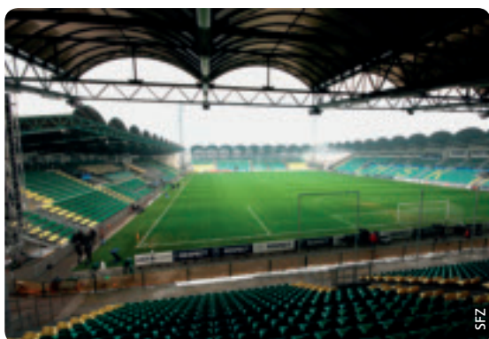
Das Stadion von Žilina.