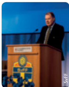
Neue Amtszeit für Präsident Karl-Erik Nilsson.

Bei der Jahresversammlung des Schwedischen Fußballverbands (SvFF) im März wurde Karl-Erik Nilsson in seinem Amt als Verbandspräsident bestätigt. Einstimmig wiedergewählt wurden auch die übrigen Vorstandsmitglieder. Der SvFF schrieb im Jahr 2012 einen Gewinn von 4,5 Millionen Euro, von dem mehr als die Hälfte aus der Teilnahme Schwedens an der EURO 2012 stammt. Natürlich wird auch künftig die