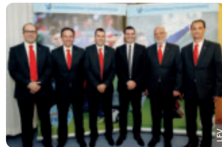
Das neue Exekutivkomitee des LFV.