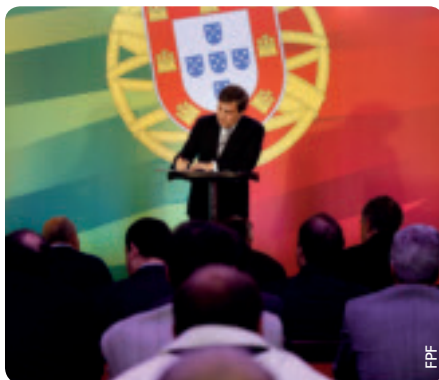
Eine wichtige Vereinbarung für den portugiesischen Fußball.