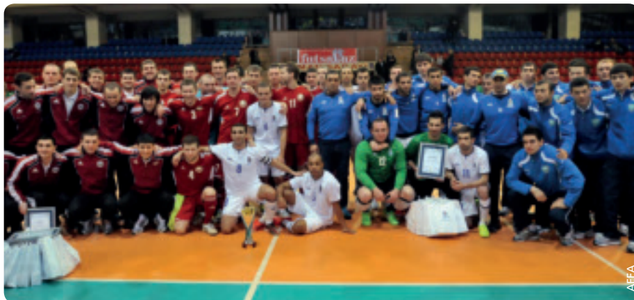
Gruppenfoto nach der Übergabe des Pokals und der Diplome.