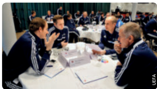
Die Theorie vor der Praxis.

Das Seminar wurde von der UEFA-Abteilung Fußballausbildung organisiert. Sie folgte damit dem von den Verbänden geäußerten Wunsch nach spezifischeren Schulungsangeboten auf diesem Gebiet.