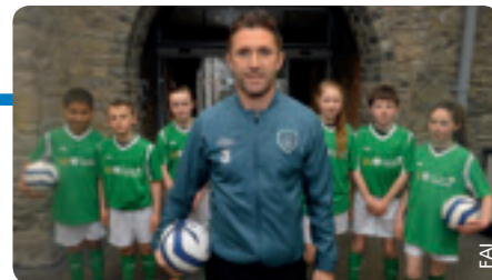
Robbie Keane, Botschafter des neuen Breitenfußball-Programms.

können sich für den Endspieltag am 15. Oktober qualifizieren. Die Spiele werden im Nationalstadion in Dublin stattfinden und am Abend können alle Teilnehmer eine Partie der irischen Nationalmannschaft mitverfolgen.