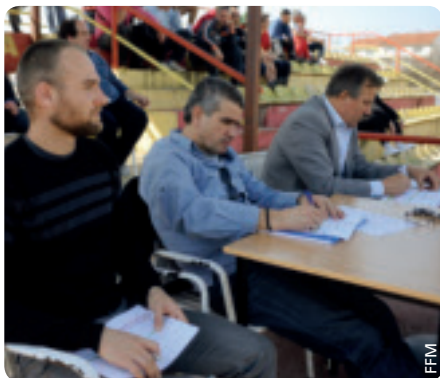
Die Kandidaten für die Akademie werden von einer Expertenjury beobachtet.

Im März begann in sechs mazedonischen Städten die Selektion junger Spieler, die in der ersten Sportakademie des Landes angemeldet werden sollen. Dort sollen neben Fußball auch Basketball, Handball und Tennis unterrichtet werden.