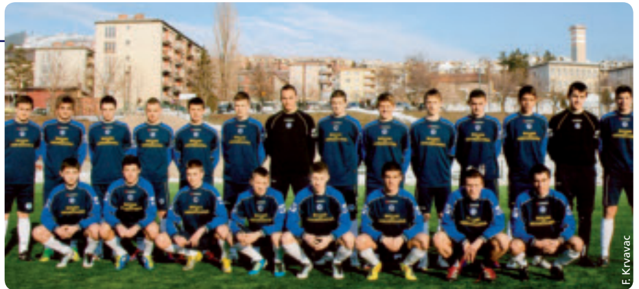
Das U19-Team von Bosnien-Herzegowina.