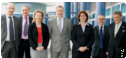
Die für das Projekt des nationalen Leistungszentrums für Sport zuständige Steuerungsgruppe.

Die neue Anlage wird ein interdisziplinäres Leistungszentrum mit einer nationalen Fussballakademie umfassen, die Letztere ist als wichtigste Empfehlung aus einer Untersuchung des schottischen Fussballs hervorgegangen, die vom ehemaligen Ersten Minister Henry McLeish in Auftrag gegeben wurde.