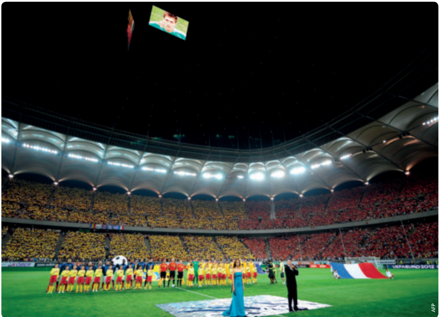
Einweihung des Nationalstadions in Bukarest am 6. September 2011 mit der Begegnung zwischen Rumänien und Frankreich.

Während in den letzten Runden der beiden grossen UEFA-Klubwettbewerbe die Finalisten ermittelt werden, nehmen die Vorbereitungen in den beiden Austragungsorten ihren Lauf.