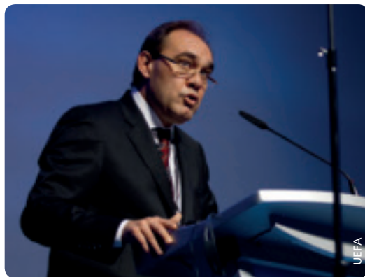
Yildirim Demirören, Präsident des Türkischen Fussballverbands.

Michel Platini verwies in erster Linie auf die in den letzten Jahren gemeinsam verrichtete Arbeit und fügte hinzu: „Und wenn es etwas gibt, das mir