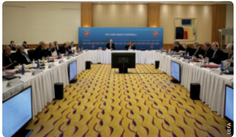
Reich befrachtete Tagesordnung für die Exekutivkomiteesitzung in Istanbul.

Zum Abschluss dieser intensiven und themenreichen Sitzung nahm das UEFA-Exekutivkomitee mit grosser Zufriedenheit zur Kenntnis, dass sich die Europäische Kommission mit den Prinzipien des finanziellen Fairplays einverstanden erklärt hat (vgl. Seite 10-11). Schliesslich genehmigte die Exekutive die Roadmap für das Aufnahmegesuch des Fussballverbands von Gibraltar, die einen Zeitplan und Unterstützungsmassnahmen für den Verband im Hinblick auf dessen Antrag auf UEFA-Mitgliedschaft beim Ordentlichen UEFA-Kongress 2013 umfasst. ●