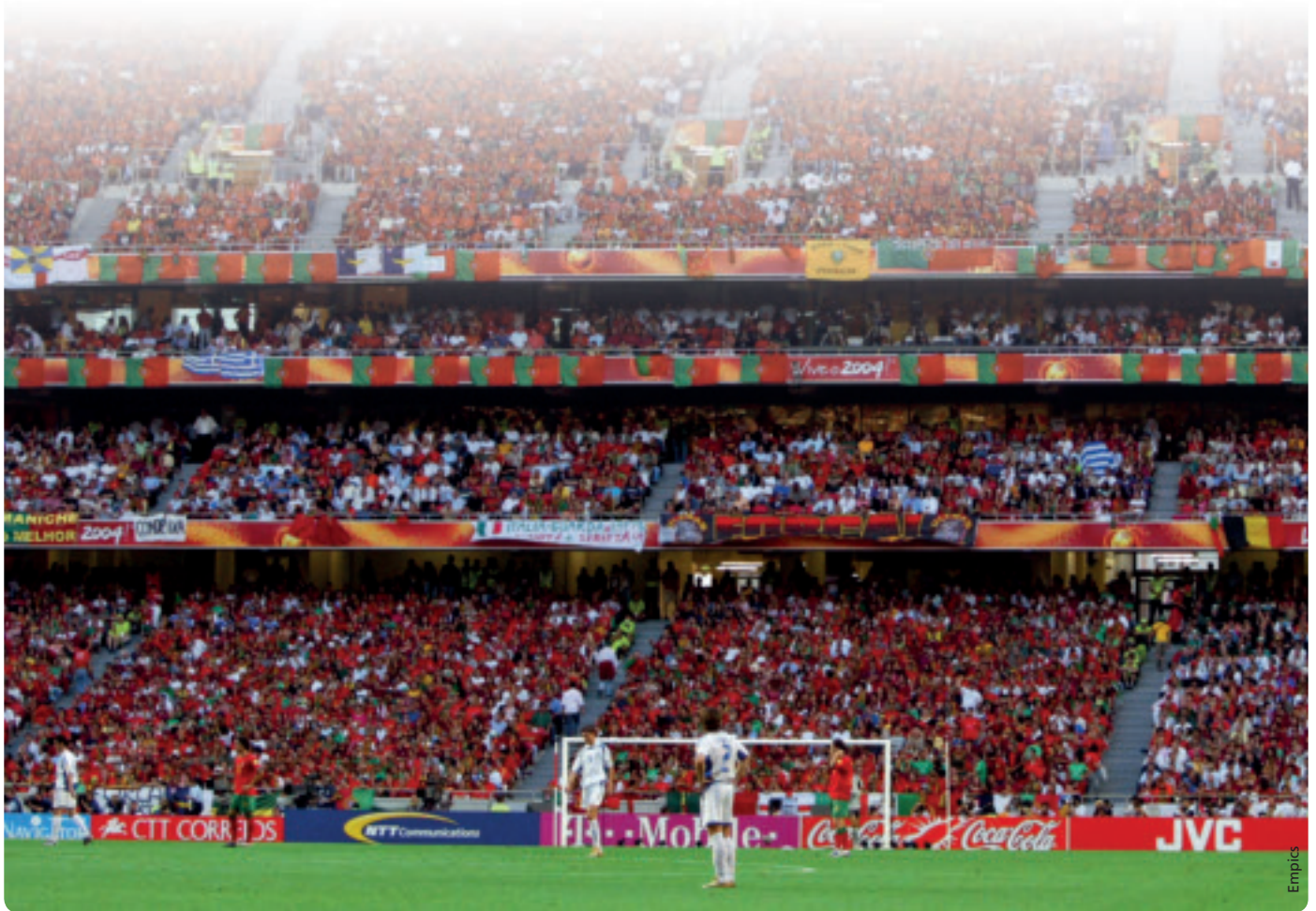
Nach dem Endspiel der EURO 2004 kann sich das Publikum im Estádio de la Luz auf eine weitere grosse Begegnung des europäischen Fussballs freuen.