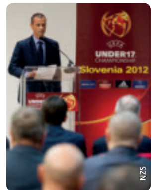
Der Präsident des Slowenischen Fußballverbands, Aleksander Čeferin, bei der Auslosung der U17-Endrunde.

Gruppe B: Slowenien, Niederlande, Polen, Belgien