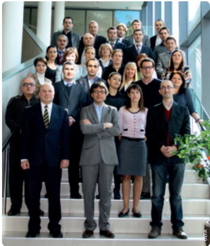
Die Workshop-Teilnehmer in Tbilisi.