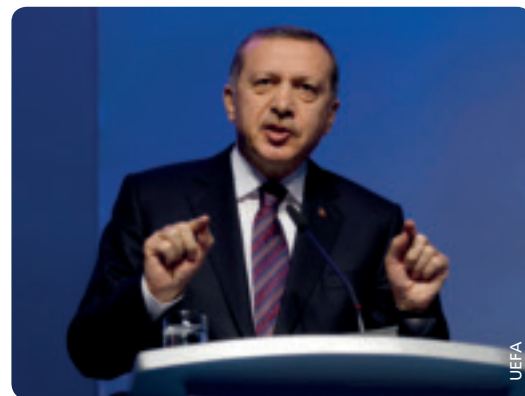
Recep Tayyip Erdogan, türkischer Premierminister.

Der Präsident ging allerdings auch auf die Probleme ein, mit denen sich der Fussball konfrontiert sieht, und erwähnte die zahlreichen Gerichtsverfahren, die Nichteinhaltung von Spielerverträgen, die Verschuldung der Klubs, Gewalt, Spielmanipulationen und illegale Wetten, Doping, den Handel mit jungen Spielern und Geldwäsche. „All diese Probleme existieren. Sie existieren in der Gesellschaft und sie existieren auch im Fussball. Noch