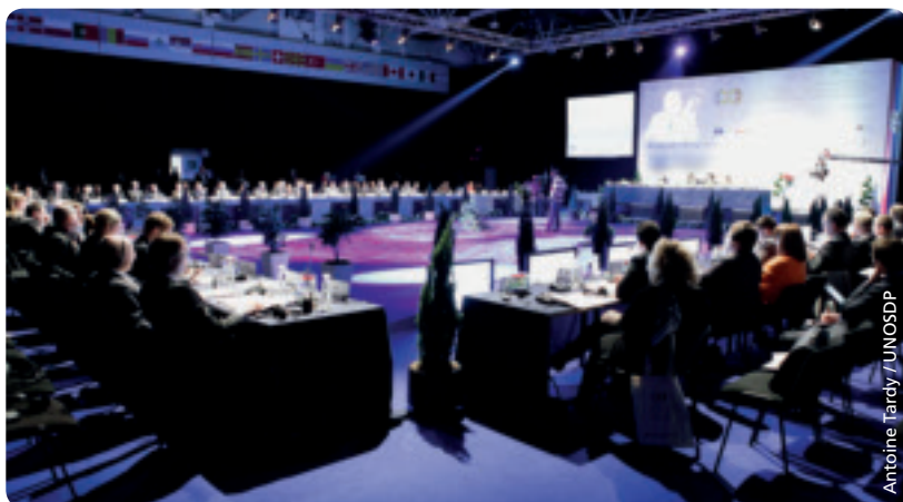
Konferenz der Sportminister in Belgrad.

UEFA-Präsident Michel Platini hielt am 15. März bei der Konferenz der Sportminister des Europarats in Belgrad eine Grundsatzrede.