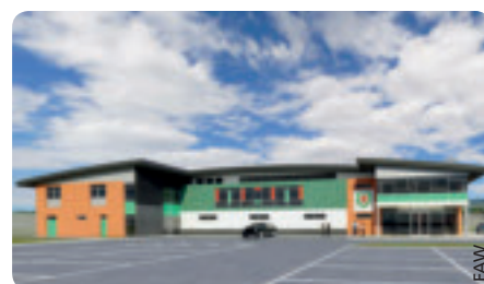
Das Modell des künftigen nationalen Entwicklungszentrums.