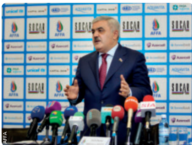
Verbandspräsident Rovnag Abdullayev bei der Medienkonferenz.