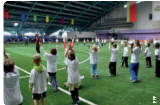
Grosser Erfolg für das Fussballfestival.

In einem ersten Teil besichtigten die Kinder in mehreren Gruppen das Haus des Fussballs und lernten die Arbeitsprozesse auf allen Ebenen des Verbands kennen. Dabei wurden die Gäste von BFF-Mitarbeitern und freiwilligen Helfern betreut.