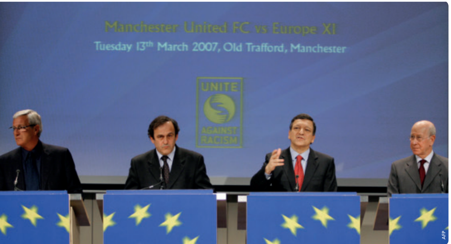
Präsident Michel Platini mit José Manuel Barroso, Marcello Lippi und Bobby Charlton im März 2007 in Brüssel.

Was haben der 21. März 2012 und der 28. Mai 2008 gemeinsam? Antwort: Beides sind historische Meilensteine für den europäischen Fussball und die Beziehungen zwischen der UEFA und der EU.