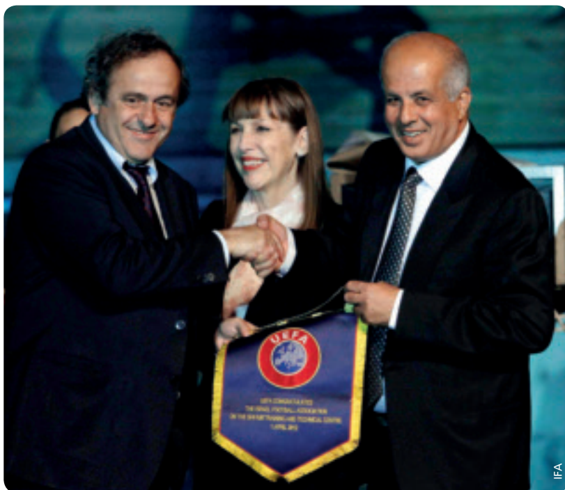
Die Präsidenten Michel Platini und Avraham Luzon mit der Ministerin für Kultur und Sport Limor Livnat.

Am 1. April eröffnete der Israelische Fussballverband (IFA) das neue Trainingszentrum Beit Hanivharot (BH) für die israelischen Nationalmannschaften. Bei der Eröffnungsfeier anwesend war UEFA-Präsident Michel Platini.