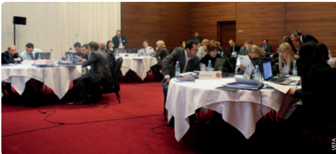
Gruppenarbeit für eine stärkere Einbindung der Teilnehmer.

nien, Andorra, Belgien, Dänemark, Färöer-Inseln, Finnland, Griechenland, Island, Israel, Kroatien, Liechtenstein, Luxemburg, Malta, Nordirland, Norwegen, Österreich, Republik Irland, San Marino, Schweden, Schweiz, Slowakei, Slowenien, Rumänien, Tschechische Republik, Ungarn, Wales und Zypern. Wie in Tbilisi machten die Teilnehmer auch hier Übungen mit dem neuen Modul für überfällige Verbindlichkeiten des IT-Tools zum finanziellen Fairplay. Am zweiten Tag wurden den Teilnehmern die jüngsten Aktivitäten und Ergebnisse in den Bereichen Klublizenzierung und finanzielles Fairplay präsentiert. Ausserdem wurde auf die bevorstehenden Diskussionen und Herausforderungen hingewiesen. Den Abschluss des Workshops bildete eine Zusammenfassung der jüngsten Benchmarking-Zahlen. ●