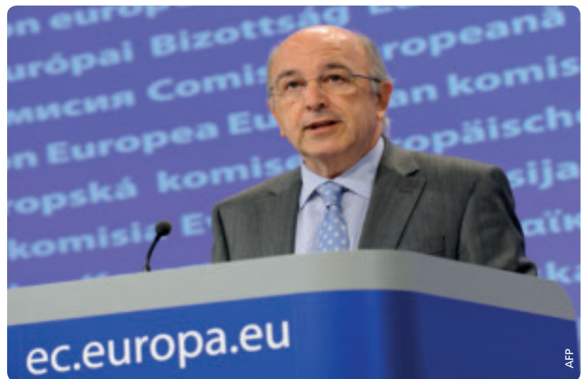
Joaquín Almunia, Vizepräsident der Europäischen Kommission.

Ein Jahr später, im Dezember 2011, traf sich Michel Platini erneut mit Vizepräsident Almunia, dieses Mal gemeinsam mit Vizepräsidentin und EU-Justizkommissarin Viviane Reding. Erneut standen die FFP-Bestimmungen auf der Tagesordnung und erneut wurde vereinbart, dass der zuständige Ausschuss und die UEFA gemeinsam prüfen würden, wie die Bestimmungen zum FFP in den Kontext der EU-Wettbewerbspolitik passen. Diese Arbeit wurde in einem Briefwechsel auf höchster Ebene zwischen UEFA-Präsident Platini und EU-Vizepräsident Almunia abgeschlossen.