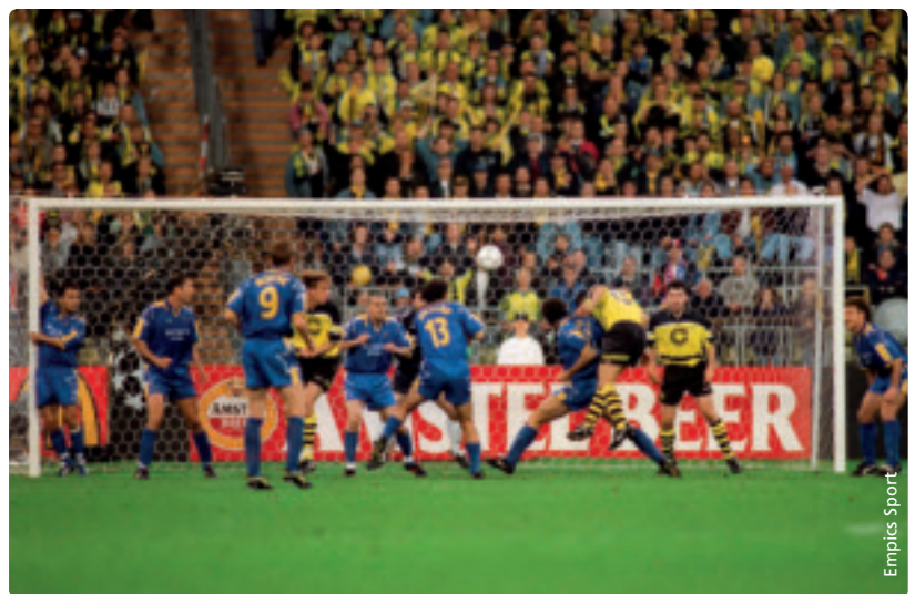
Borussia Dortmund gewann das letzte Champions-League-Endspiel im Münchner Olympiastadion.

In Bukarest und München wird die europäische Klubwettbewerbssaison einen beeindruckenden Höhepunkt erreichen, der sich vom Breitensport bis hin zur Spitze des Profifussballs erstreckt. ●