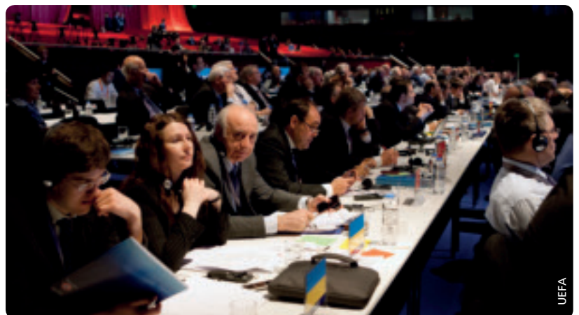
Sämtliche UEFA-Mitgliedsverbände waren beim Kongress vertreten.

Auch die Aufmachung von UEFA-direct wurde entsprechend angepasst. ●