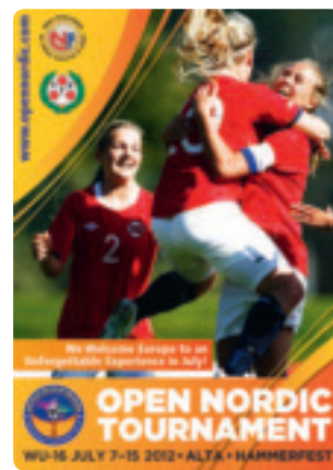
Ein Turnier für die Frauenfussballförderung im hohen Europäischen Norden.

Der Finnmärkische Regionalverband im hohen Nordosten Norwegens richtet vom 7. bis 15. Juli in Alta und Hammerfest das diesjährige offene nordische U16-Frauen-Turnier aus. Der Verband ist sehr stolz, diese Veranstaltung auszurichten und arbeitet bereits intensiv an ihrer erfolgreichen Durchführung, da die Teilnahme von mehr Mädchen und Frauen am Fussball sowohl national als auch international von grosser Bedeutung ist.