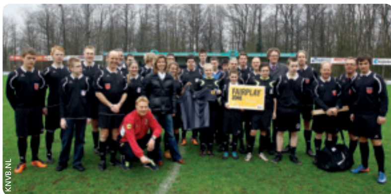
FIFA-Schiedsrichter Kevin Blom besucht einen Amateurverein.