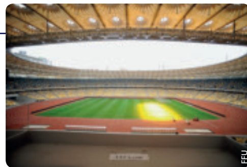
Das Olympiastadion in Kiew.

Nur Kinder, die nicht in Fussballakademien von Profiklubs oder anderen Fussballstrukturen trainieren, können an dem Turnier teilnehmen. Die Sieger der Regionalturniere qualifizieren sich für das Sechzehntelfinale. Auf die Gewinner des Wettbewerbs warten eine Kopie des Henri-Delaunay-Pokals sowie 25 Eintrittskarten für das Endspiel der EURO 2012. Der unterlegene Finalist sowie die Halb- und Viertelfinalteilnehmer erhalten ebenfalls Tickets für verschiedene Partien der EM-Endrunde.