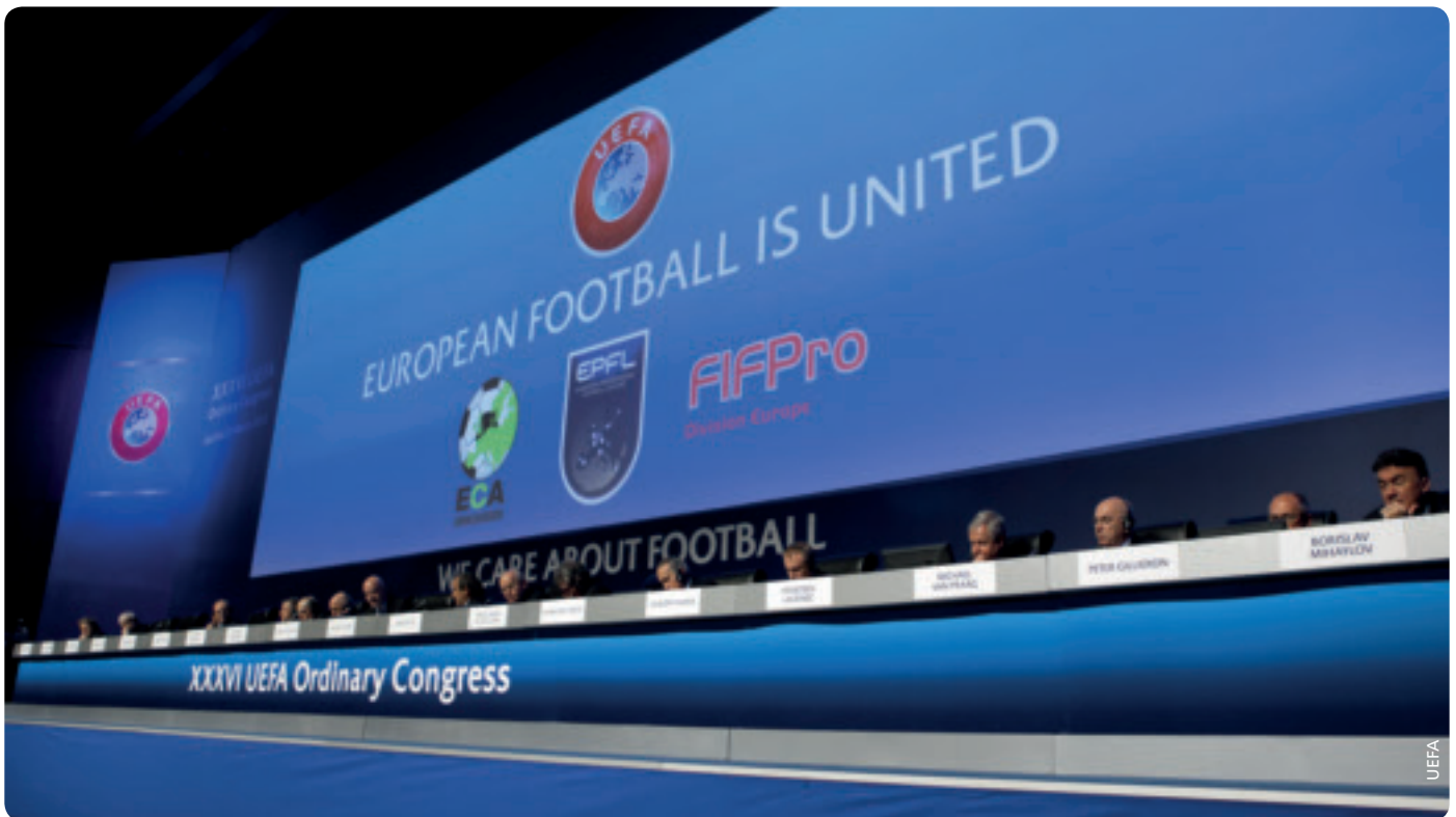
Das Exekutivkomitee bei der Unterzeichnung der Grundsatzvereinbarungen, welche die Einheit des europäischen Fussballs bekräftigen.

Friedens.“ Der Premierminister erzählte, was ihm der Fussball persönlich gebracht hat: Koordination, Teamgeist, Disziplin und natürlich auch eine gute Kommunikation. Er rief ausserdem zu gemeinsamem Handeln auf: „Lasst uns zusammenarbeiten, die nötigen Investitionen vornehmen, die Werte des Sports verteidigen, gegen Spielmanipulationen kämpfen und auch gegen Rassismus vorgehen, der dem Sportgeist widerspricht.“ Abschliessend sagte er: „Die Schönheit und die Sauberkeit des Sports müssen unser Ziel bleiben.“