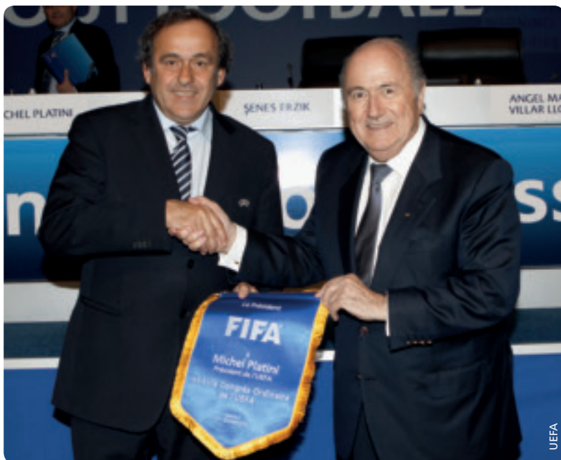
FIFA-Präsident Joseph S. Blatter überreicht UEFA-Präsident Michel Platini einen Wimpel.

In seiner Eröffnungsansprache konnte UEFA-Präsident Michel Platini den Delegierten über einen schönen Sieg für die UEFA und den Fussball berichten.