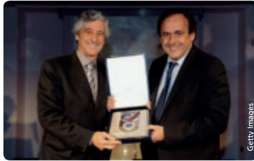
Michel Platini überreicht Gianni Rivera die Auszeichnung des UEFA-Präsidenten.

Gianni Rivera bestritt 501 Begegnungen in der Serie A in den Farben des AC Mailand, des Klubs, dem er seit seinem Wechsel vom piemontischen Verein US Alessandria 1960 bis zu seinem Karriereende 1979 treu blieb. Mit den Mailändern gewann er unter anderem drei Mal die Meisterschaft und eroberte 1963 und 1969 den Pokal der europäischen Meistervereine sowie 1968 und 1973 den Pokal der europäischen Pokalsieger.