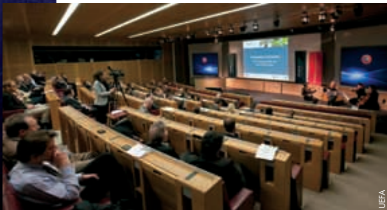
Die letzte Sitzung in Nyon.

Dank den guten Beziehungen zwischen den Mannschaftssportverbänden und den an MESGO beteiligten Universitäten konnte ein erstklassiges Kursprogramm und seriöses Arbeitsumfeld geschaffen werden, in dem sich die Absolventen nützliches Wissen aneignen und Erfahrungen austauschen konnten. Mit ihrem Diplom sind sie ausserdem in hohe akademische Sphären aufgestiegen und befinden sich auf Augenhöhe mit renommierten Wissenschaftlern und Politikern. „ Dies ist ein sehr besonderer Moment für Sie als Absolventen, aber auch für uns Universitäten “, erklärte Sciences-Po-Geschäftsführerin Inge