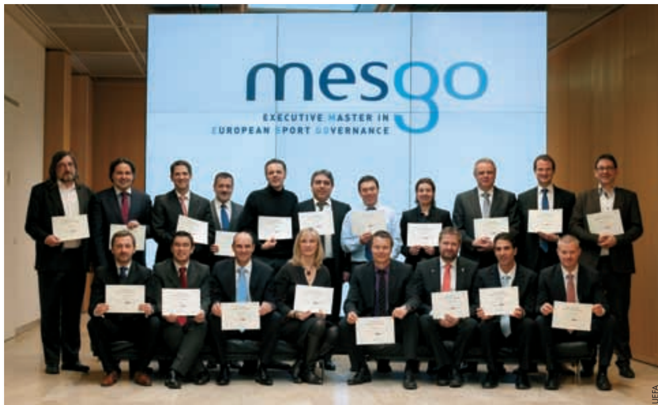
Die 19 ersten MESGO- Absolventen.

Kerkloh-Devif. „Als Diplomierte der Sciences Po gehören Sie nun einem Netzwerk von 53 000 Studienabgängern an, von denen Sie vielleicht einige kennen. Willkommen unter diesen Absolventen. Ich hoffe, dass der Studienkurs eine interessante Erfahrung war und ihnen möglicherweise neue Ideen vermittelt hat. Sie können stolz sein, da Sie die Pioniere dieses neuen Abenteuers sind. Die Sciences Po ist ihrerseits stolz, der akademischen Familie anzugehören, die dieses Programm umgesetzt hat.“