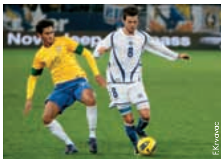
Bosnien-Herzegowina machte bei seinem Vorbereitungsspiel gegen Brasilien in der Schweiz gute Figur.

An den Treffen nahmen Vertreter von 15 Premier-Liga-Vereinen teil. Sie beurteilten die Initiative zur Gründung von Klubvereinigungen und Profiligen insgesamt posi-