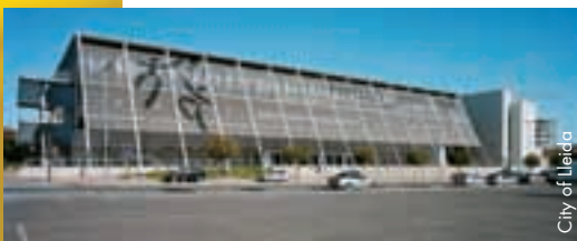
City of Lleida

Wie viel der „Heimvorteil“ des FC Barcelona ausmachen wird, ist schwer zu sagen, nachdem beschlossen wurde, das Turnier in das weiter im Landesinneren gelegene Lleida (spanisch: Lérida) zu verlagern. Die Geschichte einer der vier historischen Hauptstädte Kataloniens reicht bis in die Bronzezeit zurück. Heute hat die Stadt etwa 250 000 Einwohner. Die Begeisterung darüber, die Endphase des UEFA-Futsal-Pokals ausrichten zu dürfen, war riesig. Das Turnier wird im fantastischen Pavelló Barris Nord ausgetragen, der 2001 in nur vier Monaten errichtet und zwei Jahre später auf sein aktuelles Fassungsvermögen erweitert wurde, das bei rund 5 500 Sitzplätzen liegt. Der Spielplan wird erst nach der Halbfinalauslosung feststehen, die im Camp Nou während der Halbzeitpause des Fußballspiels zwischen dem FC Barcelona und Athletic Bilbao stattfinden wird – ein Zeichen für die enge Verbundenheit zwischen der Rasen- und der Hallensportabteilung des FC Barcelona. ●