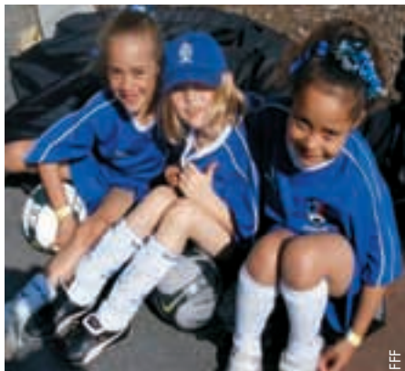
Eine Initiative, um Primarschülerinnen an den Fussball heranzuführen.