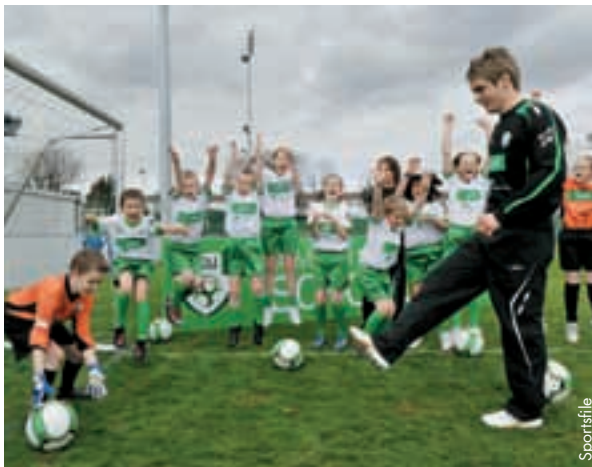
Alle 6- bis 14-jährigen Kinder in der Republik Irland können diesen Sommer Fussball spielen.

„Wir wissen, dass einige Kinder zusätzliche Hilfe und Unterstützung benötigen, um an unseren Camps teilnehmen zu können. Unsere FFA-Camps machen dies möglich: Alle Kinder haben die Chance, eine Woche lang in einem sicheren Umfeld Spass zu haben.“