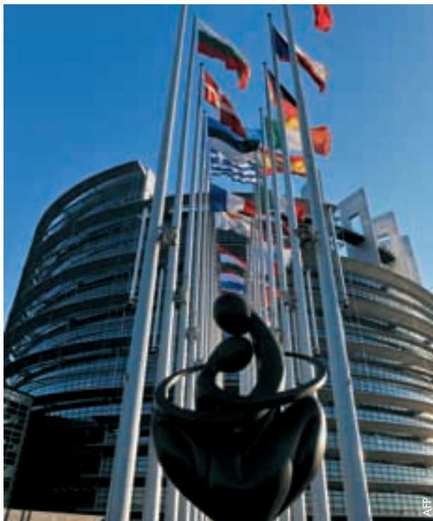
Das europäische Parlament in Strassburg.

Bezüglich Wetten ruft das Parlament die Kommission und die EU-Mitgliedstaaten dazu auf, die Rechte des geistigen Eigentums von Sportveranstaltern an ihren Wettbewerben zu schützen. Laut Bericht würde dies „gewährleisten, dass die Sportindustrie die Vorteile des Binnenmarktes“ – eines der Eckpfeiler der EU – „in vollem Umfang nutzen kann“.