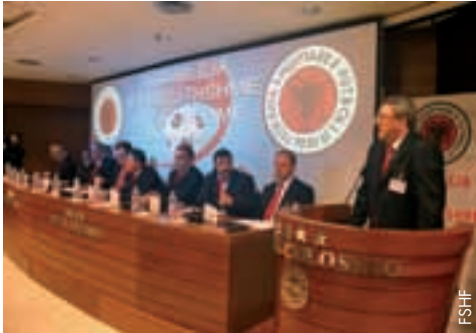
Bei der ersten Generalversammlung in Shkodra wurden wichtige Beschlüsse gefasst.

Am 22. Februar 2012 hielt der Albanische Fussballverband (FSHF) seine