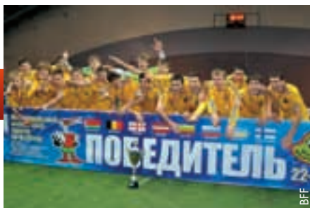
Turniersieg für die Ukraine.

Acht Mannschaften kämpften in Minsk um den Pokal: Belarus, Belgien, Finnland, Lettland, Litauen, Russland, die Ukraine und Georgien. Sechs dieser acht Teams stehen zudem in der Eliterunde der U17-Europameisterschaft und konnten das Turnier in Minsk somit als willkommene Vorbereitung