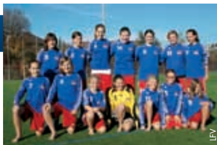
Trainingslager in der Schweiz für die liechtensteinischen U15-Mädchen.

Der Liechtensteiner Fussballverband ist bestrebt, die Entwicklung der Mädchen kontinuierlich voranzutreiben, weitere Jahrgänge