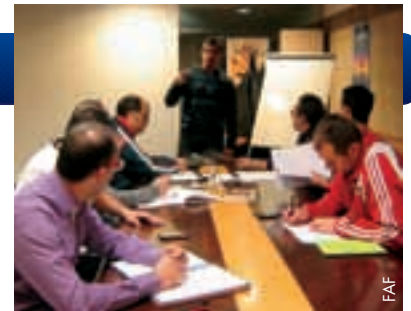
Trainerkurs in Andorra.

Der FAF ist die kontinuierliche Fortbildung der andorranischen Trainer sehr wichtig, weshalb sie regelmässig Seminare, Konferenzen und D/C-, B- und A-Lizenzkurse veranstaltet. So findet im September der fünfte D/C-Lizenzkurs zur