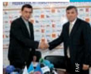
Pavel Cebanu, Präsident des Moldawischen Fussballverbands (links), stellt den neuen Nationaltrainer Ion Caras vor.