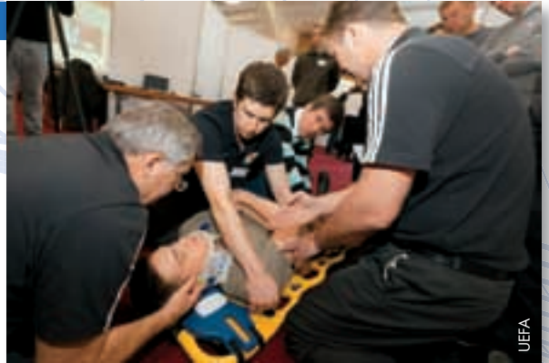
Praktische Einheit für die Ärzte.

Das Programm, das zum Wissens- und Informationsvermittlungsprogramm KISS gehört, verfolgt insbesondere das Ziel, dass die teilnehmenden Mediziner Informationen und Know-how im Rahmen ähnlich gearteter Work-