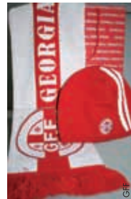
Mützen und Schals für die Fans der Nationalmannschaft.