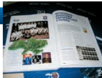
Ein exklusives Buch über den ukrainischen Fussball.

Das Buch befasst sich jedoch nicht nur mit der Geschichte der Sportart, sondern gibt auch einen Einblick in den modernen Fussball und versucht sich an einem Ausblick auf dessen Zukunft im Land des Co-Gastgebers der EURO 2012. „Dies ist kein typisches Fussballbuch, es ist ein Führer durch unser traditionsreiches Fussballland, in dem Trainerlegenden wie Walerij Lobanowskyj und Weltklassempieler wie Oleg Blochin, Igor Belanow und Andriy Schewtschenko gross geworden sind. Es hat viele Menschen zu fantastischen Leistungen inspiriert und es lohnt sich, deren Geschichte zu erzählen“, schreibt FFU-Präsident Grigoriy Surkis im Vorwort.