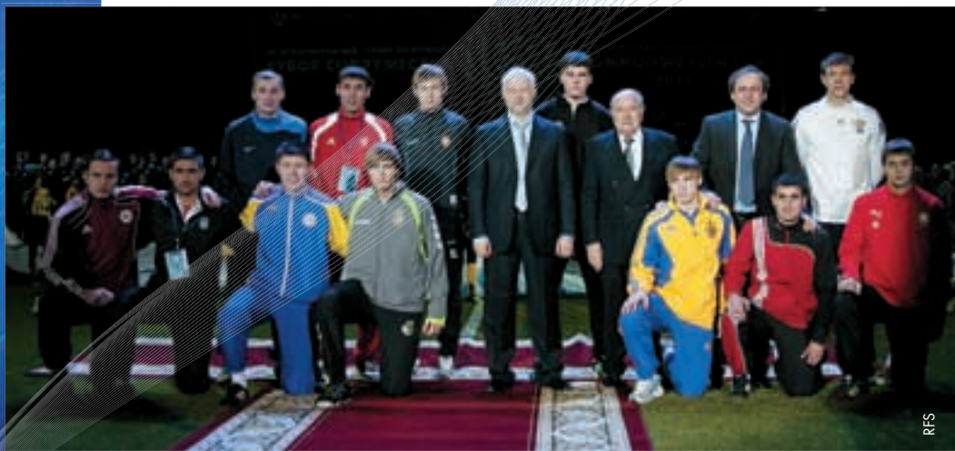
Die Präsidenten von FIFA, UEFA und RFS umgeben von Vertretern der zwölf Teilnehmer des GUS-Pokals.

Die FIFA-Weltmeisterschaft mag in Russland bereits jetzt in aller Munde sein, doch zunächst gab es erst einmal ein kleineres Event zu bestaunen. So fand in St. Petersburg der 20. GUS-Pokal statt. Neben elf U21-Teams aus Nachfolgestaaten der Sowjetunion nahm auch ein Team aus dem Iran an dem Wettbewerb teil. ● Irina Baranova