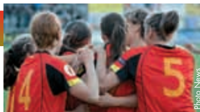
Solidarität ist einer der Grundsteine für die guten Ergebnisse des belgischen Frauenteam.

Nach einigen Freundschaftsspielen stiegen unsere Damen in die EM-Qualifikation ein im Wissen, dass ihre Aufgabe angesichts der starken Gruppe mit den beiden Topteams Norwegen und Island keine leichte sein würde.