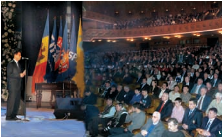
Der Präsident des Moldawischen Fussballverbands, Pavel Cebanu, spricht vor den rund 1 500 Gästen des Galaabends.