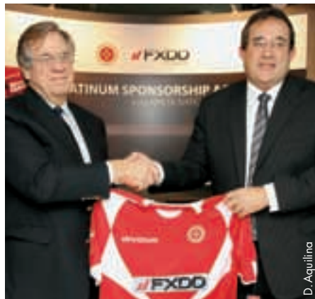
Der Präsident des Maltesischen Fussballverbands, Norman Darmanin Demajo (rechts), bei der Präsentation des Sponsoringvertrags.