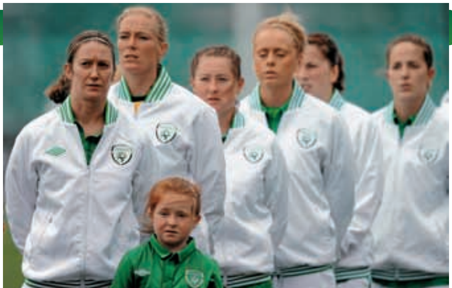
Die irische Frauennationalmannschaft steht in ihrer EM-Qualifikationsgruppe auf aussichtsreicher Position.

Am erfreulichsten ist jedoch die Entwicklung der Juniorinnen- und Juniorenteams, wo sich die Männer- und Frauen-U17- und U19-Teams allesamt für die Eliterunde qualifiziert haben. Hierzu beigetragen hat sicherlich das Nachwuchsförderprogramm des Verbands, in dessen Rah-