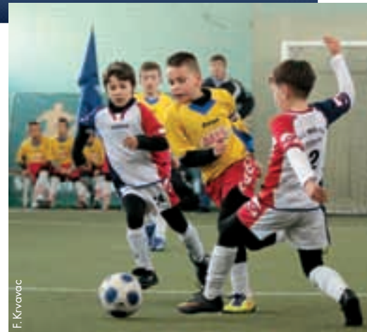
Eine Partie beim „Sampion Junior“-Turnier.

■ In Zürich traf sich eine Delegation des NSBiH unter der Leitung von Ivica Osim mit Vertretern von FIFA und UEFA. Die Gastgeber zeigten sich zufrieden mit der im vergangenen Jahr geleisteten Arbeit des Normalisierungskomitees. Verschiedene Aktivitäten und die Bemühungen um eine Konsolidierung der