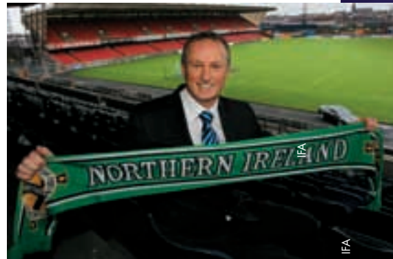
Der neue Nationaltrainer Michael O'Neill.