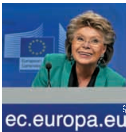
Die für Justiz, Grundrechte und Bürgerschaft zuständige EU-Kommissarin Viviane Reding.

Ein weiteres wichtiges Thema war die Beilegung von Streitigkeiten im Sport. Präsident Platini erklärte, dass der geeignetste und effizienteste Weg der Beilegung von Streitigkeiten im Sport über Sportschiedsgerichte führe, und dass diese Tatsache unbedingt anerkannt werden müsse. Auf diese Weise könne auch eine einheitliche und zügige Beilegung von Streitigkeiten gewährt werden, die für den reibungslosen Ablauf von Sportwettbewerben unerlässlich sei.