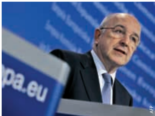
Joaquín Almunia, EU-Kommissar für Wettbewerb.

● Im Dezember traf sich UEFA-Präsident Michel Platini mit Viviane Reding, Vizepräsidentin der Europäischen Kommission und EU-Kommissarin für Justiz, Grundrechte und Bürgerschaft, und Joaquín Almunia, Vizepräsident der Kommission und für das Ressort Wettbewerb zuständig. Der UEFA-Präsident war von den beiden hochrangigen EU-Kommissaren zu einem Arbeitssessen am EU-Sitz in Brüssel eingeladen, bei dem eine sehr konstruktive Atmosphäre herrschte.