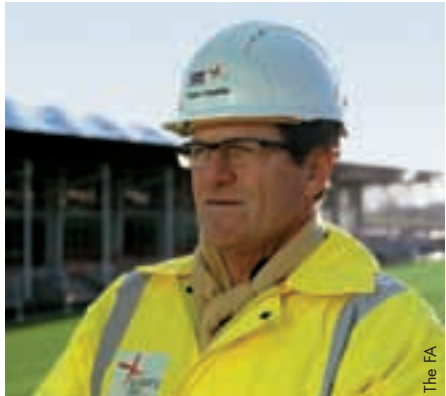
Fabio Capello zu Besuch im St. George's Park.

Der englische Nationaltrainer Fabio Capello fand lobende Worte für den St. George's Park, in dem die 24 englischen Nationalmannschaften trainieren, Trainer ausgebildet werden und das Zentrum für Fussballentwicklung und Sportmedizin untergebracht werden sollen, und bezeichnete es als beste Einrichtung dieser Art in ganz Europa. Capello besuchte das Zentrum in Burton-Upon-Trent jüngst gemeinsam mit FA-Präsident David Bernstein.