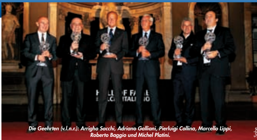
Die Geehrten (v.l.n.r.): Arrigo Sacchi, Adriano Galliani, Pierluigi Collina, Marcello Lippi, Roberto Baggio und Michel Platini.