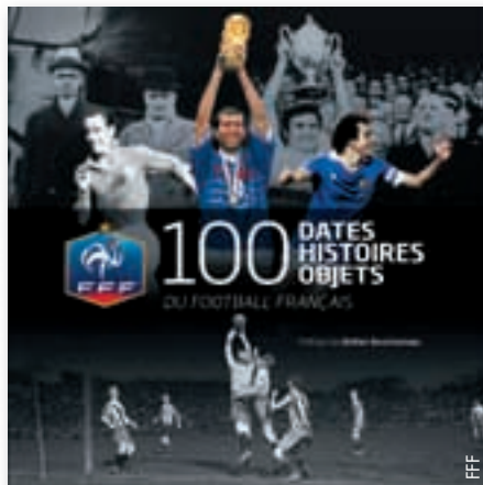
Eine buntes Allerlei an Informationen über den französischen Fussball.

Die Geschichte der FFF ist eng verknüpft mit der Historie des französischen Fussballs. Sie beginnt Ende des 19. Jahrhunderts und hat ein reiches menschliches, sportliches, kulturelles und materielles Erbe hervorgebracht – einen wahren Schatz, den viele Fans nicht oder nur wenig kennen. Anhand von 100 symbolträchtigen Daten