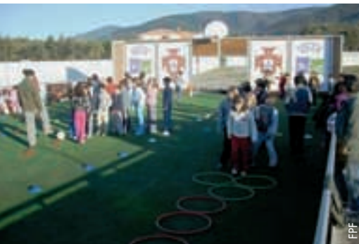
203 Minispielfelder wurden in Portugal gebaut.

In der ersten Phase zwischen 2007 und 2008 wurden in 19 Distrikten 102 Minispielfelder gebaut; die zweite Phase dauerte von 2009 bis 2011 und brachte 101 Minispielfelder in 20 Regionen hervor. ● Bruno Henrique