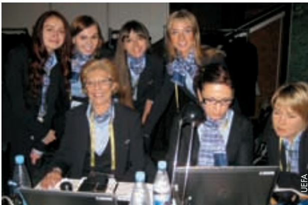
Zufriedene Gesichter hinter den Kulissen der Endrundenauslosung in Kiew.

Die bezahlten Stellen sind in den Bereichen TV- und Video-Produktion, Host-Broadcasting-Logistik und Broadcaster-Dienste angesiedelt. Das Talentprogramm richtet sich an die Fakultäten für Medien, Journalismus und Sport der Universitäten in den Austragungsstädten und bietet den Studenten die einmalige Chance, ihr