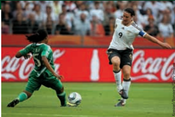
Birgit Prinz im Spiel gegen Nigeria bei der Frauen-Weltmeisterschaft 2011.

Über 30 internationale und nationale Titel hat die in Frankfurt am Main geborene langjährige Spielführerin der Frauen-Nationalmannschaft in ihrer Laufbahn gewonnen. Die 214-malige