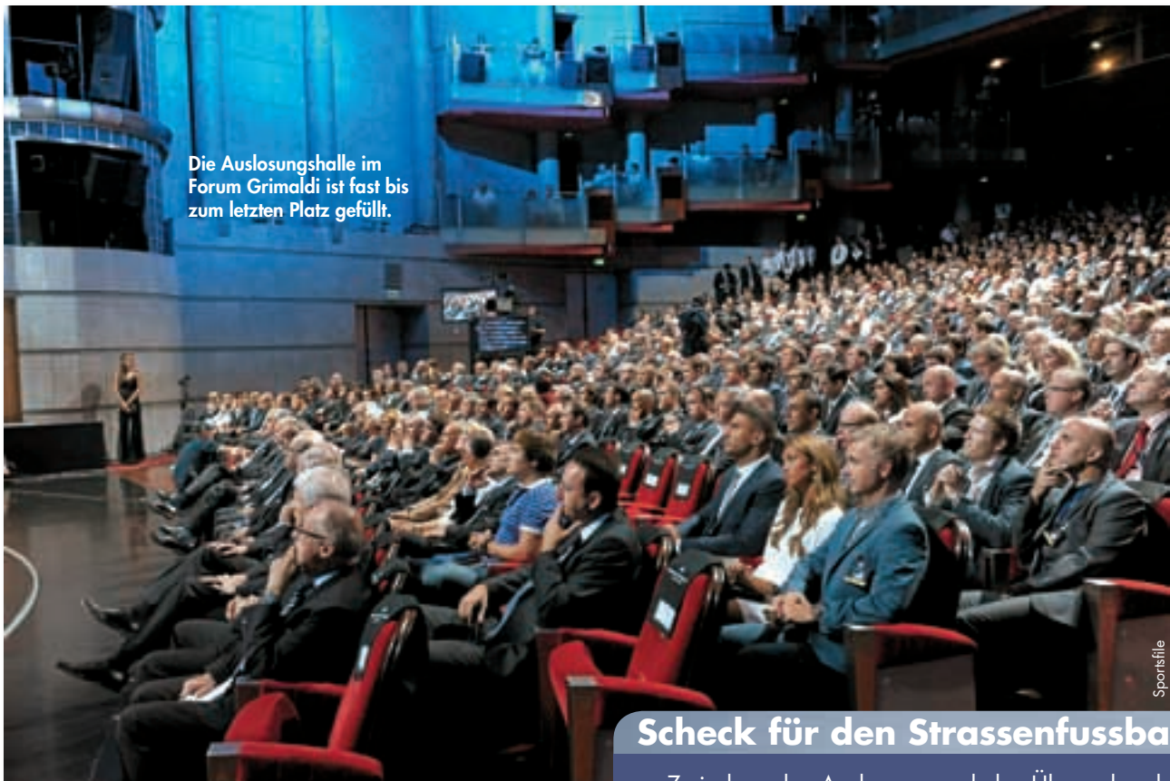
Die Auslosungshalle im Forum Grimaldi ist fast bis zum letzten Platz gefüllt.