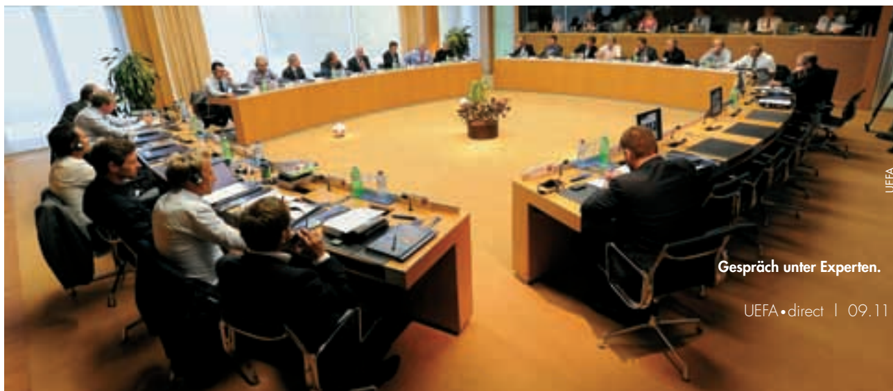
Gespräch unter Experten.

Dies sind nur einige Beispiele der zahlreichen Denkanstösse, die aus einer intensiven, hochkarätigen Veranstaltung hervorgegangen sind, die den Trainern die Gelegenheit bietet, eine breite Palette an Diskussionspunkten direkt ins Blickfeld der UEFA zu rücken. ●