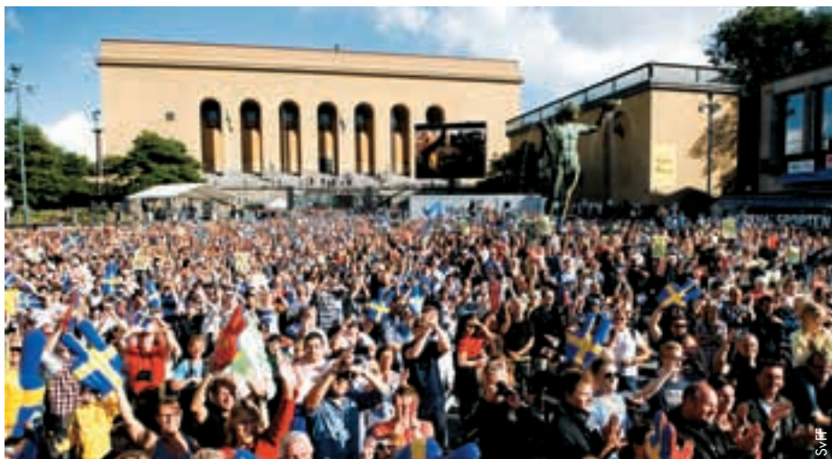
Herzlicher Empfang der Frauennationalmannschaft in Göteborg nach dem Gewinn der Bronzemedaille bei der Weltmeisterschaft in Deutschland.