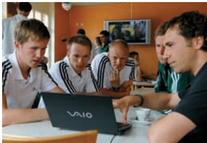
Leistungsverbesserung mithilfe von Videoaufzeichnungen.

Die Vorlesungen und Präsentationen waren anspruchsvoll, interessant, themenbezogen und hatten immer eine klare Botschaft. Auch der Humor kam nicht zu kurz. Es wurden alle Aspekte des Spiels abgedeckt, und auch die Richtlinien der UEFA für Schiedsrichter bei internationalen Spielen wurden vorgestellt. Hervorragend waren auch die praktischen Trainingseinheiten. Wir hatten die Gele-