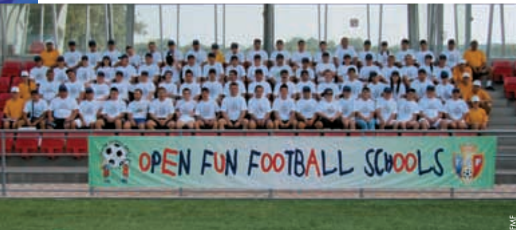
Die Verantwortlichen der offenen Fun-Fussball-Schulen.