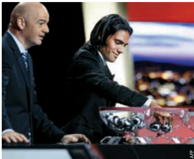
Der beste Torschütze der letzten UEFA Europa League, Falcao, unterstützt UEFA-Generalsekretär Gianni Infantino bei der Auslosung.

Zudem nehmen zahlreiche Vereine zum ersten Mal an europäischen Wettbewerben teil – ganz im Sinne des Ziels, möglichst vielen Klubs die Teilnahme an den UEFA-Wettbewerben zu ermöglichen. 23 Nationalverbände sind 2011/12 in der UEFA Europa League vertreten: England stellt vier Klubs, der österreichische, belgische, griechische, israelische, niederländische, rumänische