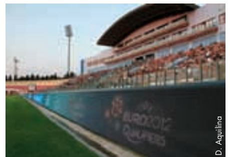
Renovierung im Nationalstadion.

Dank dieser Massnahmen wird die Attraktivität des Stadionkomplexes sicherlich nochmals gesteigert. ● Alex Vella