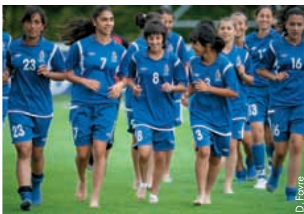
Den jungen Aserbeidschanerinnen hat es in der Schweiz gefallen.

Das Team unter der Leitung der ehemaligen deutschen Nationalspielerin Sissy Raith war zu Gast im UEFA-Fussball-Exzellenzzentrum in Nyon, wo es im Stade de Colovray mehrere Trainingseinheiten und zwei Spiele absolvierte. Die Gäste aus Aserbeidschan mussten sich einer Regionalauswahl aus dem Kanton Waadt mit 1:2 geschlagen geben, bevor sie gegen das Schweizer U17-Team mit 0:2 verloren.