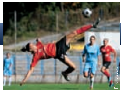
Spektakuläre Aktion einer Spielerin des SFK 2000 Sarajevo.

In der Qualifikation für die UEFA Champions League und die UEFA Europa League hatten die Teams aus Bosnien-Herzegowina keinen Erfolg. Meister FK Borac Banja Luka verlor in der zweiten UCL-Qualifikationsrunde die erste Partie mit 1:5 gegen Maccabi Haifa; auch der Sieg beim Rückspiel in Banja Luka (3:2) konnte das Blatt nicht mehr wenden. In der ersten UEL-Qualifikationsrunde kam Siroki Brijeg im Hinspiel im Pecara-Stadion gegen Olimpija Ljubljana nicht über ein torloses Unentschieden hinaus und verlor das Rückspiel in Ljubljana mit 0:3. Zwei Vereine aus der Hauptstadt Sarajevo zogen allerdings in die zweite UEL-Qualifikationsrunde ein: Der FK Željeznica setzte sich gegen den FC Sheriff aus Moldawien durch, der FK Sarajevo gegen den Örebro SK aus Schweden. In der dritten Qualifikationsrunde schieden jedoch beide Vereine aus: Der FK Sarajevo gegen Slavia Prag und Željeznica gegen Maccabi Tel Aviv.