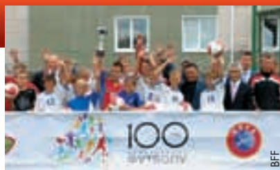
Die Sieger des Schulfussballturniers.

Es fand zunächst eine Preisverleihung für die Gewinner des Turniers von Schulen aus ländlichen Regionen statt. Die drei bestplatzierten Mannschaften erhielten Bälle, Urkunden und weitere Geschenke.