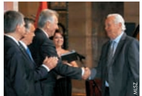
Eine hohe Auszeichnung für Florian Albert.

Flórián Albert, der 1967 als einziger ungarischer Fussballspieler den französischen Ballon d'Or erhielt, konnte am ungarischen Nationalfeiertag, dem 20. August, einen aussergewöhnlichen Preis im Parlament entgegennehmen. Die Auszeichnung wurde ihm vom ungarischen Staatspräsidenten Pál Schmitt überreicht, anwesend war auch Premierminister Viktor Orbán.