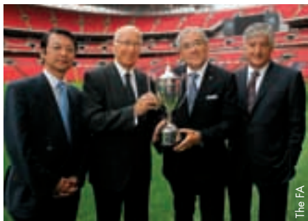
Bobby Charlton überreicht dem Präsidenten des Japanischen Fussballverbands, Junji Ogura, im Beisein von Botschafter Keiichi Hayashi und FA-Präsident David Bernstein den Pokal.

Der Silberpokal wurde dem japanischen Fussball ursprünglich als Zeichen der Freundschaft übergeben, was zur Gründung des Verbands 1921 führte. Im Zweiten Weltkrieg gelangte er in die Hände der japanischen Regierung und verschwand.