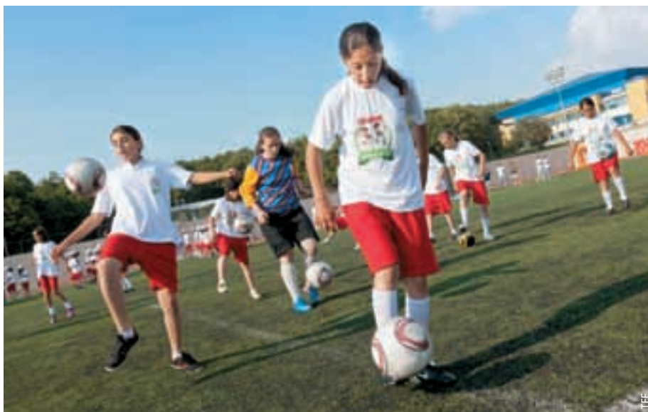
An den Trainingslagern nehmen zahlreiche Mädchen teil.