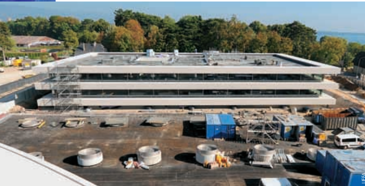
Das neue Gebäude der UEFA, Bois-Boguy, wird ab kommendem Frühjahr 190 Mitarbeiterinnen und Mitarbeitern der UEFA-Administration Platz bieten.

Bezüglich des finanziellen Fairplays wurden die Exekutivkomiteemitglieder über die Arbeit des Finanzkontrollausschusses für Klubs informiert, der in diesem Jahr insgesamt fünf Sitzungen abhalten wird. Ausserdem erfuhren sie, dass künftig alle Klubs einen Fanbeauftragten ernennen müssen. Ein Workshop mit diesem Personenkreis ist für Oktober geplant.