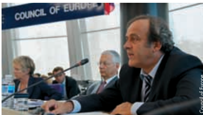
Michel Platini bei seiner Rede vor dem Europarat.

Der UEFA-Präsident wies darauf hin, dass Spielmanipulationen von kriminellen Banden betrieben werden, dass allerdings noch nicht alle europäischen Staaten dieses Vergehen als strafgesetzlichen Tatbestand erachten. „Aus diesem Grund bin ich mittlerweile der Auffassung, dass ein Eingreifen des Europarates notwendig ist. Seine Mitgliedstaaten müssen dazu ermutigt werden, den Sportbetrug als Tatbestand in ihrem Strafrecht zu verankern, und die unabdingbare Zusammenarbeit zwischen staatlichen Behörden und Sportverbänden muss vorange-