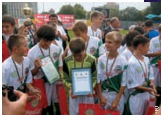
Diplome und Preise für die Teilnehmer des Lederball-Turniers.

Alle Teilnehmer erhielten Preise, darunter Bälle und Gutscheine für Fußballschuhe, die vom Ukrainischen Fußballverband, vom Amateurfußballverband, von Coca Cola Ukraine und dem Klub Lederball gesponsert wurden. Der Klub war mit seinem Präsidenten Andrii Biba vertreten, dem bekannten ehemaligen UdSSR-Nationalspieler und Spieler von Dynamo Kiew. Die besten Teams erhielten Pokale und Medaillen, und die Sieger