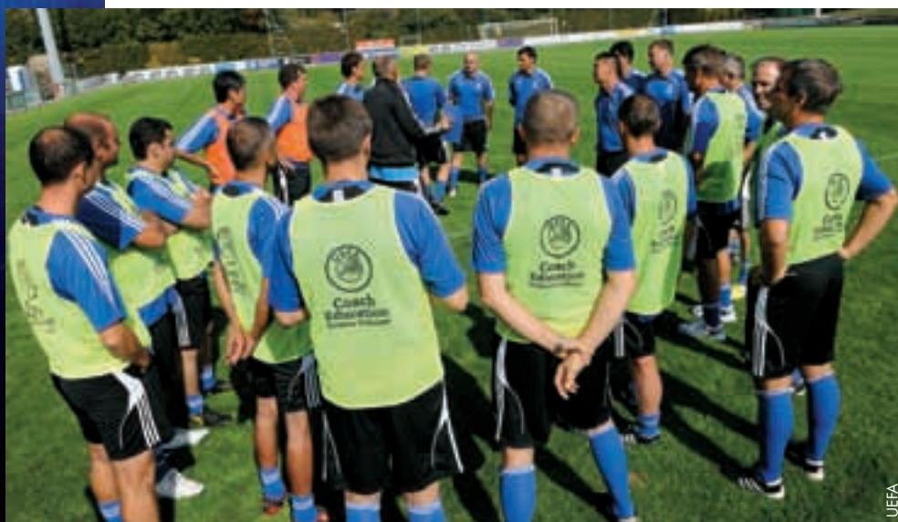
Theoriestunde für die Pro-Lizenz-Anwärter.

Im UEFA-Kalender der Saison 2011/12 stehen bereits drei weitere Seminare. ●