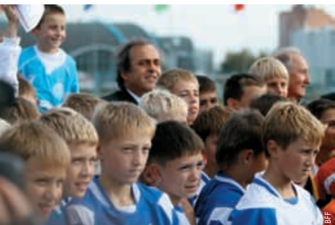
Michel Platini mit jungen Fussballern.

Die Feierlichkeiten gingen am Abend mit dem offiziellen Empfang des Belarussischen Fussballverbands weiter. ●