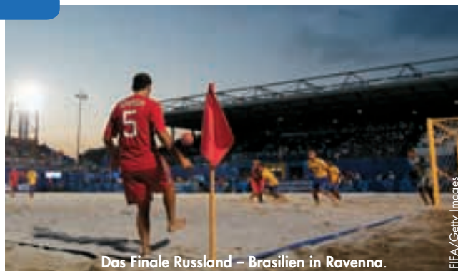
Das Finale Russland – Brasilien in Ravenna.

Die Ukraine, die von den Brasilianern im Gruppenspiel erst im Elfmeterschiessen bezwungen wurde, sowie die Schweiz gehörten ebenfalls zur europäischen Delegation. ●