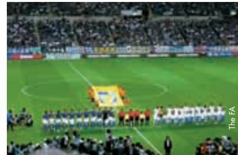
Die Begegnung Japan - Nordkorea ganz im Zeichen des Respekts.

Japan gehört gewöhnlich nicht zu den Ländern, die man mit mangelndem Respekt assoziieren würde. Dennoch erhielt der Englische Fussballverband (FA) Anfang September eine Einladung, den Japanischen Fussballverband bei der Lan-