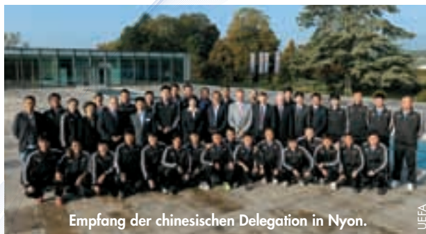
Empfang der chinesischen Delegation in Nyon.

Im Rahmen des europäisch-chinesischen Jahres der Jugend stellte die UEFA in Zusammenarbeit mit der Europäischen Kommission ein Ausbildungsprogramm für junge chinesische Trainer auf die Beine.