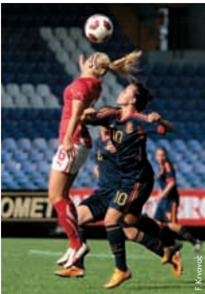
Begegnung zwischen Spanien und der Schweiz, den beiden bestplatzierten Teams beim U19-Frauen-Miniturnier in Bosnien-Herzegowina.