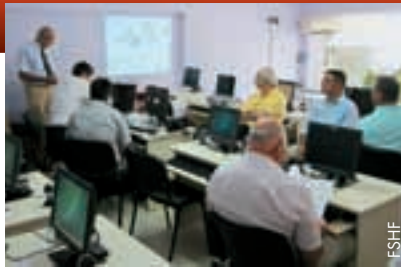
Schulungen im Rahmen der Einführung des neuen Systems.

Das System ermöglicht die Registrierung von Spielern, Trainern, Offiziellen und allen anderen an Spielen beteiligten Personen. Auch die Spielkalender der Meisterschaften sämtlicher Kategorien sowie Statistiken zu allen Spielern und Mannschaften werden erfasst.