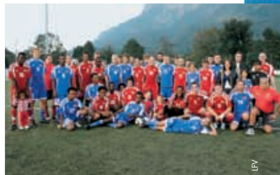
Ein Freundschaftsspiel im Zeichen des Friedens.

Die Veranstalter durften sich abermals über eine in allen Belangen gelungene Veranstaltung freuen, die ein wichtiges Zeichen für Frieden, Toleranz, Integration und das Mit-