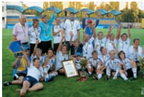
Der FC Zhytlobud Charkiw mit dem Pokal.

In Unterzahl, jedoch nicht unterlegen, versuchte Chernigiv aus der Verteidigung heraus