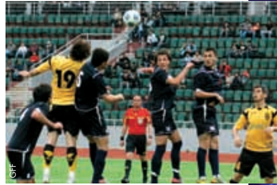
Neuer Spielmodus in der höchsten georgischen Spielklasse.

Auf dem 20. Kongress der SPP wurde eine weitere Neuerung vorgestellt: Dank einer neuen Regelung kann nun jeder Klub Kongressmitglied