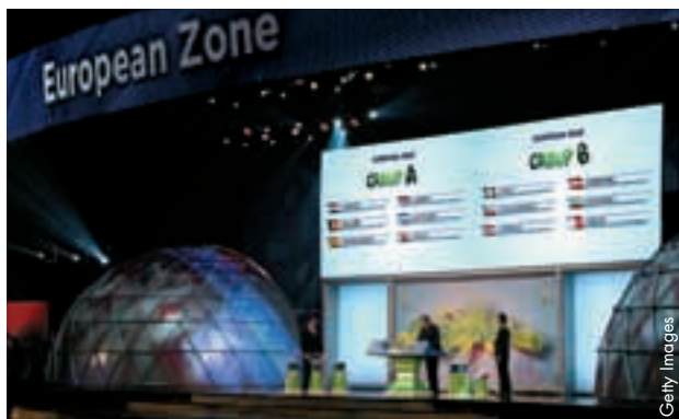
Die Auslosung der europäischen Qualifikationsgruppen in Rio de Janeiro.

Die Teilnehmer der EURO 2012 stehen noch nicht fest, da blicken die europäischen Nationalauswahlen schon auf entferntere Herausforderungen: Am 30. Juli wurden in Rio de Janeiro die Qualifikationsgruppen für die Weltmeisterschaft 2014 ausgelost.