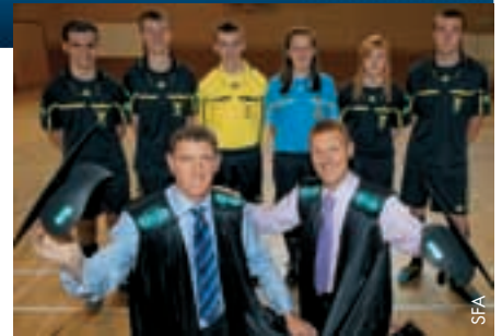
Neues Zertifizierungsprogramm für angehende Schiedsrichter.