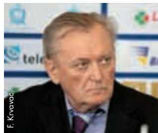
Ivica Osim, Vorsitzender des Normalisierungskomitees.

Bosnien-Herzegowina hat noch immer eine Chance, sich für die Entscheidungsspiele und anschliessend für die EURO 2012 zu qualifizieren.