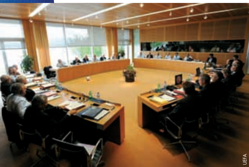
Das Exekutivkomitee bei seiner Sitzung in Nyon.

Betreffend die U21-Europameisterschaft, die dieses Jahr in Dänemark stattfand, genehmigte das Exekutivkomitee den Verteilungsschlüssel für die finanzielle Ausschüttung an die teilnehmenden Mannschaften. Der Sieger