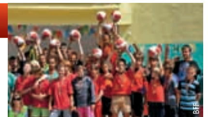
Bei diesen jungen Fussballern herrscht grosse Begeisterung.