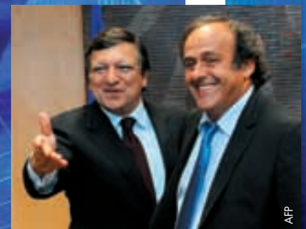
José Manuel Barroso und Michel Platini.

Michel Platini sprach schliesslich die Förderung und die Entwicklung des Nationalmannschaftsfussballs an, welche ihm sehr am Herzen liegt. José Manuel Barroso stimmte zu, dass der Nationalmannschaftssport die Grundwerte der EU widerspiegele und dass sein Schutz für die erfolgreiche Entwicklung des europäischen Fussballs entscheidend sei. ●