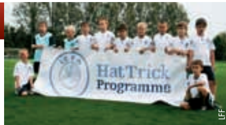
Die jungen Letten profitieren vom UEFA-HatTrick-Programm.

Die lettische Fussballnationalmannschaft bereitet sich unterdessen auf die Qualifikationsspiele zur EURO 2012 vor: Sie tritt am 2. September auswärts gegen Georgien an, am 6. September empfangen die Letten dann in Riga Griechenland. Das lettische U21-Team heisst Frankreich am 2. September für ein Qualifikationsspiel zur EURO 2013 willkommen; vier Tage später geht es für die jungen Spieler auf dem Weg in die Endrunde weiter nach Rumänien.