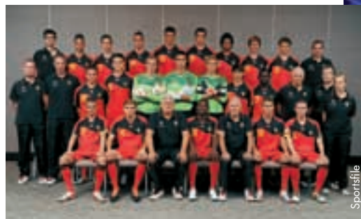
Die belgische U19-Auswahl.

Trainer Van Geersom zollte seinen Spielern nach dem Ausscheiden danach grosses Lob: „Ein Ausscheiden ist natürlich immer eine Enttäuschung, aber ich bin trotzdem sehr stolz auf meine Spieler. Unsere Leistungen waren hervorragend und wir mussten uns einzig gegen Spanien geschlagen geben. In der Endrunde standen wir Spitzenmannschaften gegenüber. So konnten meine Spieler Erfahrungen sammeln, die ihnen für ihre weitere Karriere sicher zugutekommen werden.“ ● Pierre Cornez