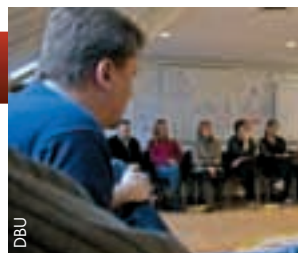
Durch diesen Kurs soll unter anderem die Rolle der Frau im Fussball gestärkt werden.

Am diesjährigen Projekt nehmen 16 Frauen und 8 Männer teil. Sie werden in strategischem Management, Veränderungsmanagement und