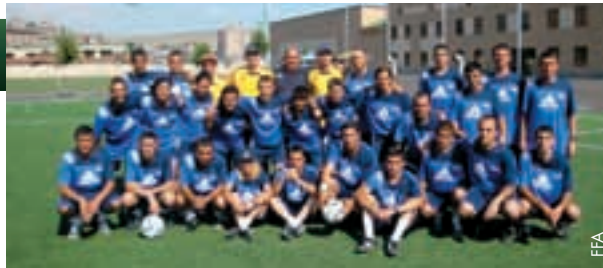
Die Schiedsrichter der zwei höchsten Spielklassen versammelten sich für diesen Lehrgang.