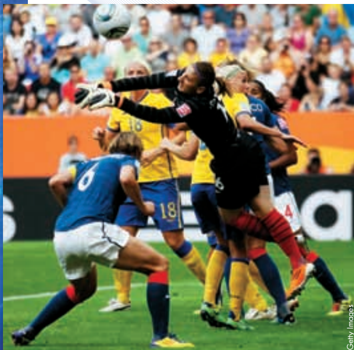
Schweden gewann die Bronzemedaille im Spiel um Platz drei der Frauen-Weltmeisterschaft gegen Frankreich.

Das schnelle, technisch starke und flüssige Spiel der Japanerinnen sorgte in diesem Wettbewerb für Wirbel: Einzig die Engländerinnen fanden ein Mittel gegen die Asiatinnen und schlugen sie im Gruppenspiel mit 2:0, das jedoch eher unbedeutend war, da sich zu diesem Zeitpunkt schon beide Teams qualifiziert hatten. Im Viertelfinale gegen Gastgeber Deutschland legten die