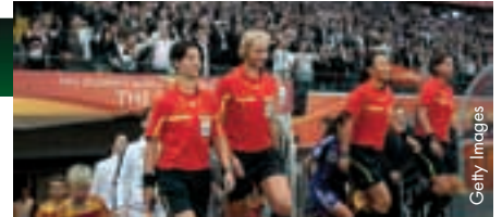
Die Frauen-Weltmeisterschaft war ein Erfolg auf ganzer Linie.