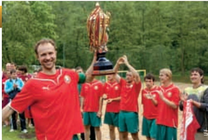
Der Kapitän der belarussischen Mannschaft stemmt den Pokal in die Luft.

Beim Turnier zeigte Belarus den besten Fussball und gewann alle drei Spiele, Russland belegte den zweiten Platz und Moldawien holte sich gegen Gastgeber Litauen in einem spannenden Spiel den dritten Platz. „Das Turnier war ein grosser Erfolg. Wir hoffen, dass es nächstes Jahr wieder durchgeführt werden kann und zu