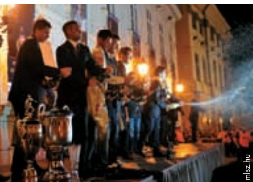
Feierlicher Empfang für die Spieler des FC Videoton durch die Stadt Székesfehérvár.

In der 110-jährigen Geschichte des ungarischen Fußballs war es dem FC Videoton nie gelungen, den nationalen Meistertitel zu errin-