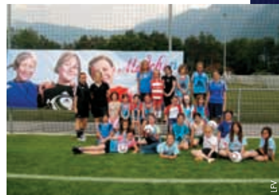
Der Verband möchte mehr Mädchen für den Fußballsport begeistern.

Die Schnuppertrainings fanden zwischen dem 11. Mai und 1. Juni in sechs verschiedenen Gemeinden statt und standen unter der Leitung von Monika Zuppiger, der technischen Leiterin für den Frauenfußball beim LFFV. Unterstützt wird die Kampagne auch auf medialer Ebene, so etwa durch eine Plakataktion und durch Präsenz in Radio und Fernsehen. Der LFFV ist zuversichtlich, viele neue Fußballerinnen zu gewinnen und damit den Mädchen- und Frauenfußball in Liechtenstein wieder einen Schritt vorwärts zu bringen. ● Anton Banzer