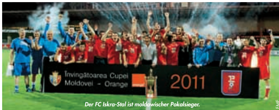
Der FC Iskra-Stal ist moldawischer Pokalsieger.