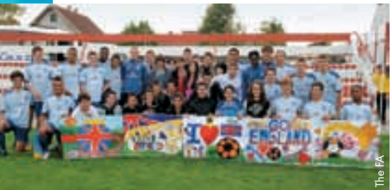
Die englische U17-Auswahl mit ihren jungen serbischen Fans.