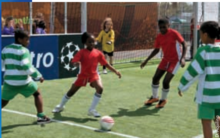
Das Festival stand im Zeichen der Kinder und des Breitenfussballs.

Die englische Nationaltrainerin Hope Powell fügte hinzu: „Es ist fantastisch. Dank solchen Events für Frauen erhalten wir eine Plattform. Wir hoffen, dass sie für die Mädchen eine besondere Motivation darstellen. Wir alle wissen, dass sie den Fussball lieben und ein Teil davon sein möchten. Es ist wichtig, einen Pool an