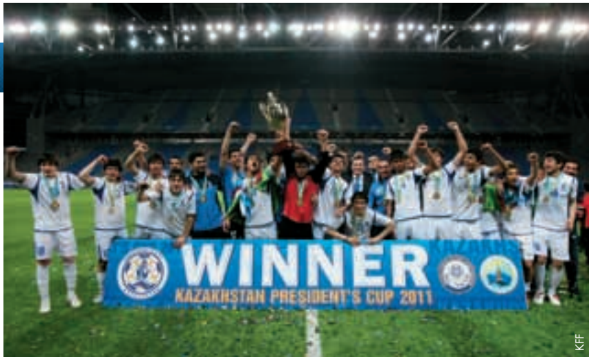
Aserbeidschan gewann das internationale Juniorenfußballturnier.