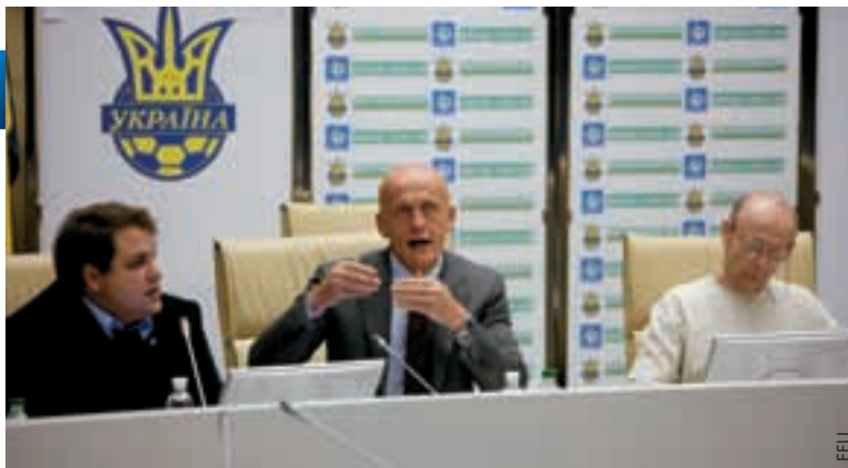
Pierluigi Collina vor den ukrainischen Medien.

Knapp 40 Journalisten der führenden Fernsehsender, Zeitungen und Internetportale nahmen