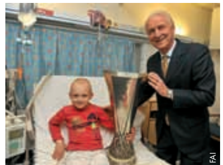
Giovanni Trapattoni brachte die Trophäe der UEFA Europa League in ein Kinderkrankenhaus.