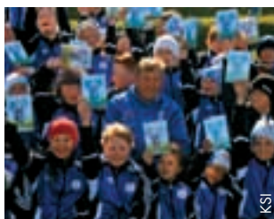
Der isländische Nationalspieler Aron Einar Gunnarsson von Coventry City verteilt in Dalvík DVDs an Kinder.