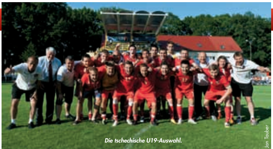
Die tschechische U19-Auswahl.

Im Juni wird Portugal die Endrunde des UEFA-Regionenpokals ausrichten und auch dort wird Tschechien vertreten sein! Das ist das Verdienst der Spieler aus der mährischen Region Zlin.