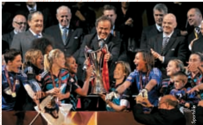
Pokalübergabe an die Spielerinnen von Olympique Lyon.

Lotta Schelin in der Spitze und Élodie Thomis auf rechts brachten die Potsdamer Abwehr mehrmals in Bedrängnis, und von dieser Seite fiel in der 27. Minute auch der