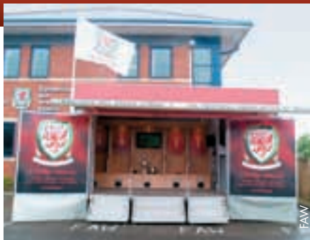
Eine „Umkleidekabine auf Rädern“ als Werbemittel.

Sommer-Open-Air-Festivals haben in Wales grosse Tradition und die FAW wird bei vielen von ihnen vertreten sein, unter anderem am