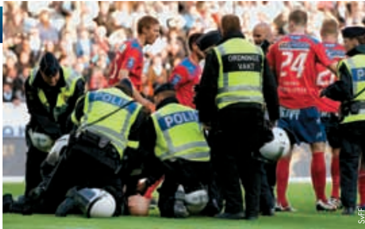
Die Polizei von Malmö geht gegen einen aggressiven Fan vor; dieser muss mit einer Geldstrafe und einem einjährigen Stadionverbot rechnen.

„Wir brauchen die Hilfe der Regierung, und zwar jetzt. Der Fussball investiert immer mehr Geld und Anstrengungen in Sicherheitsmassnahmen, aber wir brauchen auch rechtliche Handhabe, um etwas gegen diese Kriminellen unternehmen zu können, denen der Schaden, den sie anrichten, egal ist. Für Kriminelle sind die Polizei und die Gerichte zuständig, und es ist an der Zeit, einige der Massnahmen zu ergreifen, mit denen andere Länder erfolgreich zur Bekämpfung