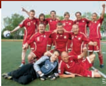
Das lettische Journalisten-Nationalteam spielte zum ersten Mal im Ausland.

Das lettische Team landete bei seiner ersten Teilnahme an dem Wettbewerb mit fünf Punkten auf dem achten Platz. Die sechste Austragung des Wettbewerbs, an der nebst der lettischen Mannschaft Medienteams aus Polen, der Ukraine, Aserbeidschan, Belarus, Russland und Litauen teilnahmen, ging an ein Team aus Polen. Die Reise der Journalisten fand mit freundlicher Unterstützung von Latvijas Mobilais Telefons und Nordea bank , den Hauptsponsoren des Lettischen Fußballverbands (LFF), statt.