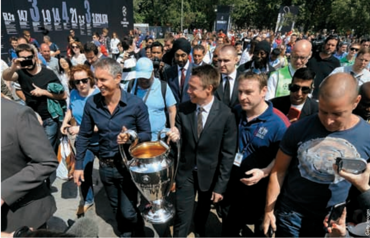
Ein Bad in der Menge mit der Champions-League-Trophäe für Gary Lineker und Graeme Le Saux.

Spielerinnen zu haben und für sie ist es wichtig, Spielgelegenheiten zu erhalten. Wir erhalten somit einerseits eine grössere Auswahl an Spielerinnen und andererseits fördern solche Veranstaltungen die körperliche Betätigung, die für die Bekämpfung von Fettleibigkeit, ein erklärtes Ziel der Regierung, von grosser Bedeutung ist.“