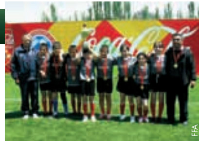
Das Areni-Team entschied das Turnier für sich.

Es war eine sehr festliche Atmosphäre mit all den glücklichen Kindern in ihren bunten Trikots, den zufriedenen Fussballfans und einem Popkonzert als Krönung des Tages.