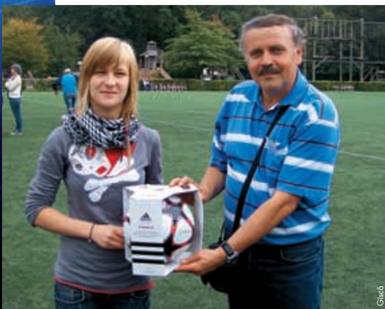
Übergabe des vom UEFA-Präsidenten unterschriebenen Balles an die Gewinnerin des Zeichenwettbewerbs.

Jedes Gebot wird mit zwei Fotos illustriert und es wird eine Diashow mit den zehn Geboten erstellt werden.