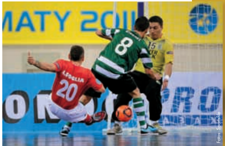
Das Endspiel zwischen Sporting Lissabon und Città di Montesilvano.

Die Zuschauer im Baluan-Sholak-Sportpalast, der eine Kapazität von 5 000 Plätzen aufweist und auch bei den asiatischen Winterspielen 2011 zum Einsatz gekommen