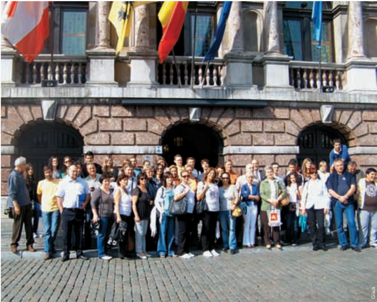
Die Teilnehmer vor dem Rathaus von Antwerpen.

Jede Schule wird ein oder zwei Gebote anhand der bei den fünf Treffen gemachten Fotos illustrieren.