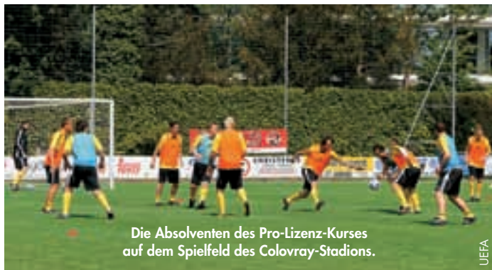
Die Absolventen des Pro-Lizenz-Kurses auf dem Spielfeld des Colovray-Stadions.

Das Bestreben der UEFA, die Qualität der Trainerausbildung in Europa zu verbessern, wurde in der ersten Maiwoche durch den offiziellen Start eines neuen Traineranwärter-Austauschprogramms, das vom UEFA-Exekutivkomitee genehmigt worden war, unterstrichen.