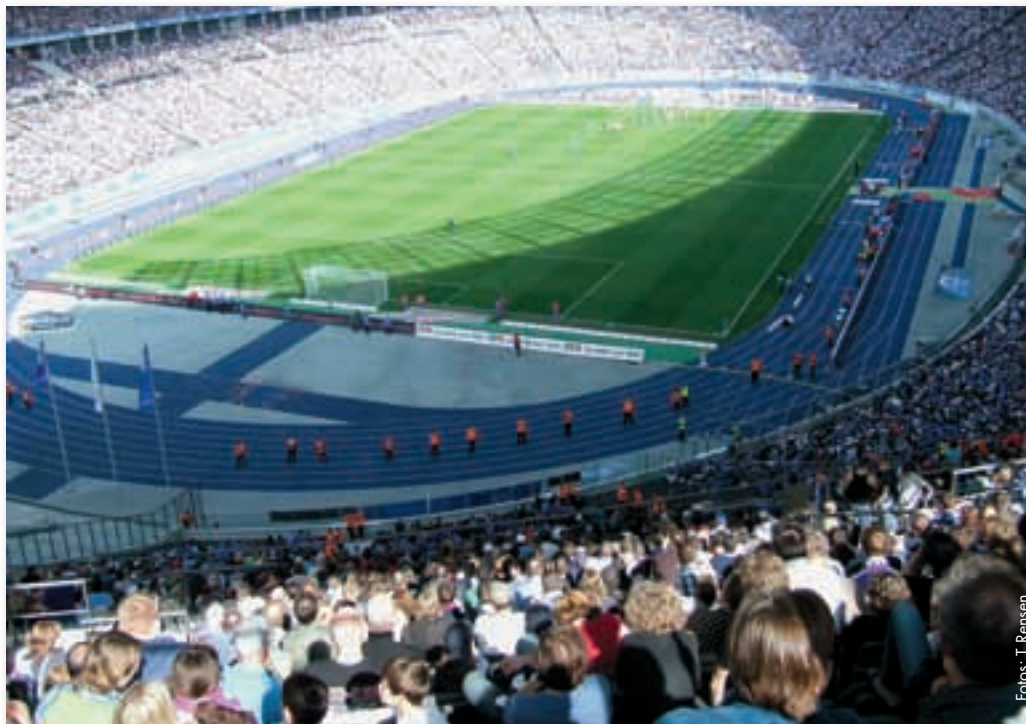
Das Berliner Olympiastadion war für die Zweitligapartie zwischen Hertha BSC und Paderborn ausverkauft.