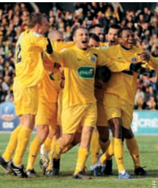
Die Spieler von Chambéry hatten in der diesjährigen Coupe de France oft Grund zum Jubeln.

Die im Viertelfinale von Angers (2. Liga) gestoppten Savoyer sind in die Geschichte des Pokalwettbewerbs eingegangen, nachdem sie drei Erstligateams nacheinander (Monaco,