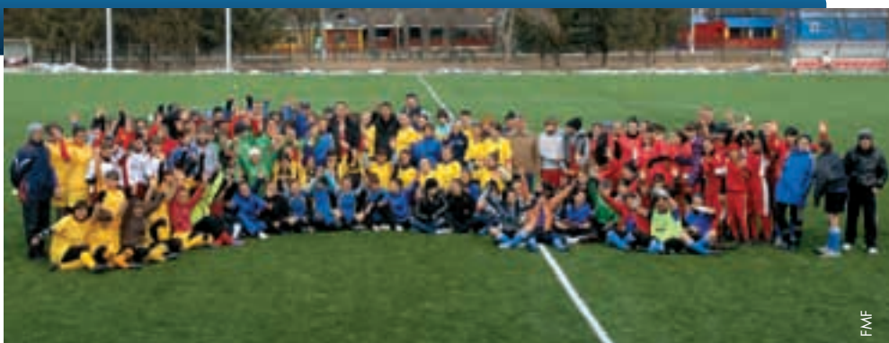
Jubelszenen am Ende des Turniers.