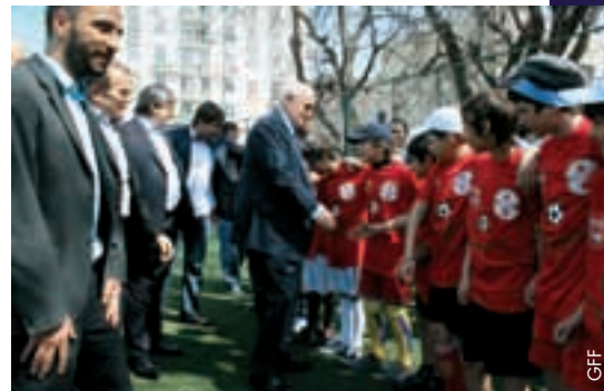
Senes Erzik freut sich über die zahlreichen jungen Teilnehmer.

Der UEFA-Vizepräsident freute sich über die zahlreichen Teilnehmer bei diesem Junio-