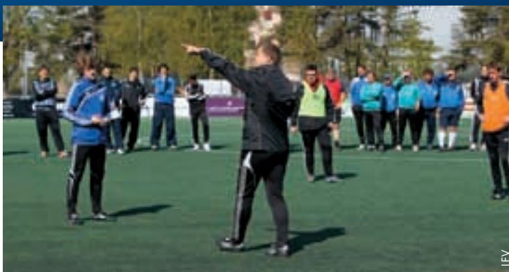
Lehrgang für die Liechtensteiner Trainer.

Auf dem Gelände des Sportparks Eschenmauren erhielten die Teilnehmerinnen und Teilnehmer zunächst eine Einführung, in der