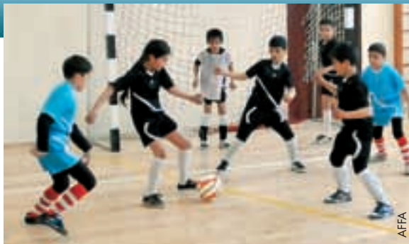
Der Schüler-Pokal war ein grosser Erfolg.

Der Schüler-Pokal des Aserbeidschani-schen Fussballverbands (AFFA) wurde 2010 ins Leben gerufen. Sein Ziel ist es, die Beliebtheit des Juniorenfussballs im ganzen Land zu steigern und den Kindern zu vermitteln, wie wichtig Sport und Bewegung für die Gesundheit sind. Der Wettbewerb begann Anfang April für die Viertklässler von 15 weiterführenden Schulen im Sabayil-Distrikt von Baku, der Hauptstadt Aserbeidschans. Die zweite Gruppe umfasste 15 weiterführende Schulen aus dem Binagadi-Distrikt von Baku. Insgesamt nahmen an dem Wettbewerb 250 Kinder teil, ohne die vielen beteiligten Eltern, Schulkameraden und Lehrer zu vergessen. Die Teilnehmer stellten ihren Wettbewerbs-