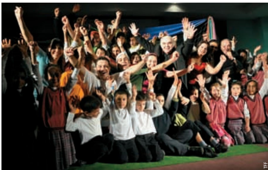
Ein Theaterstück für die Vermittlung von Werten.