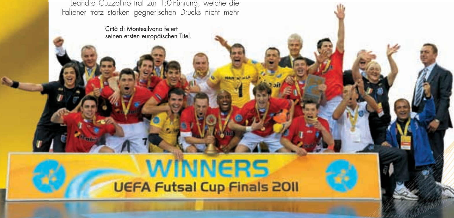
Città di Montesilvano feiert seinen ersten europäischen Titel.