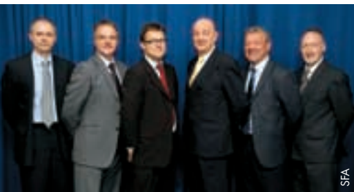
Sechs der Gäste der SFA-Exekutive.

die beide mit Präsentationen zur Debatte beitragen. Im Zentrum stand folgende Frage: „Disziplinarfragen können von den Fussballverbänden ohne zivilgerichtliche Einmischung behandelt werden. Ist dies im heutigen Fussballmarkt eine Traumvorstellung?“