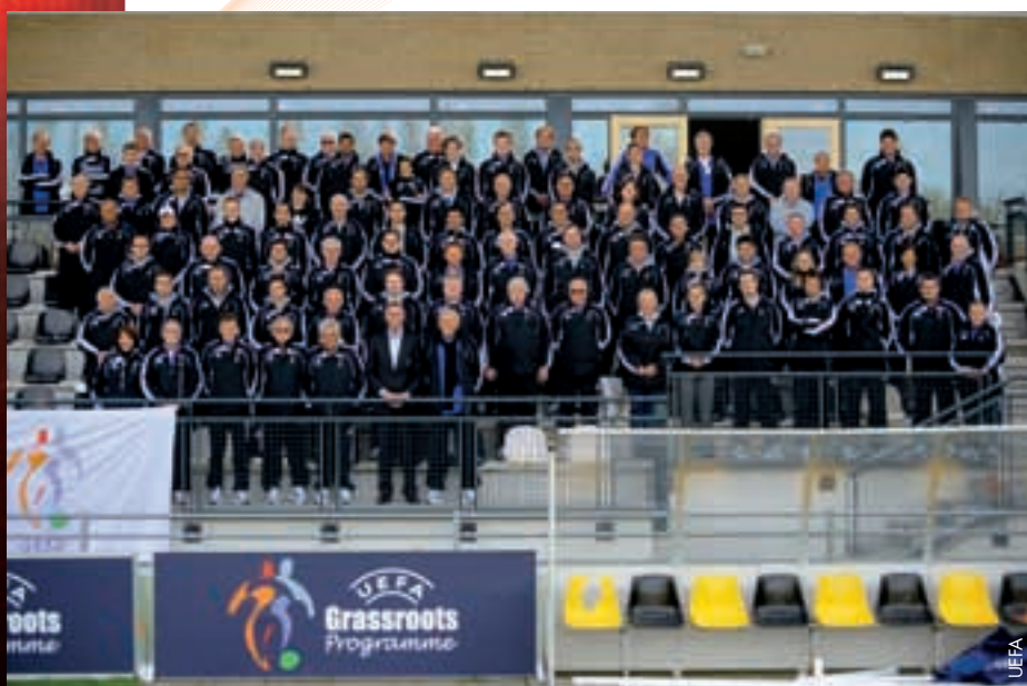
Die Teilnehmer des Breitenfussball-Workshops.