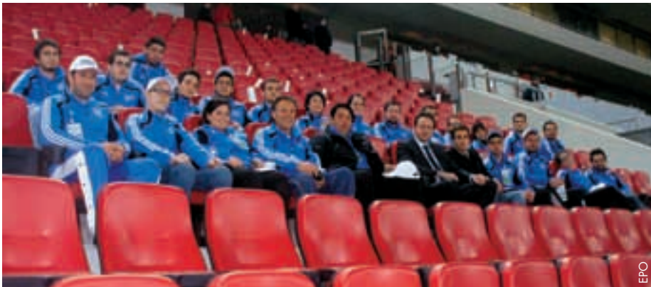
Das Freiwilligen-Team mit dem griechischen Verbandspräsidenten Sofoklis Pilavios auf der Tribüne des Georgios-Karaiskakis-Stadions nach der Begegnung Griechenland - Polen.