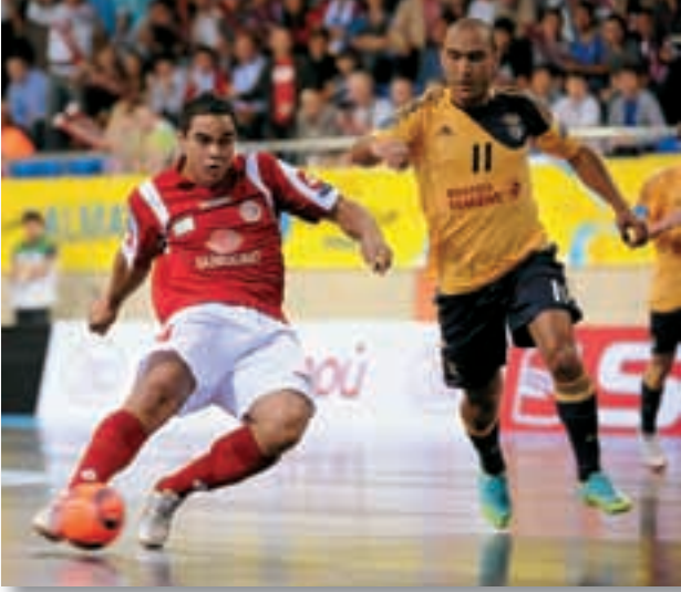
Benfica konnte seinen Titel nicht verteidigen und verlor auch das Spiel um den dritten Platz gegen Kairat Almaty.