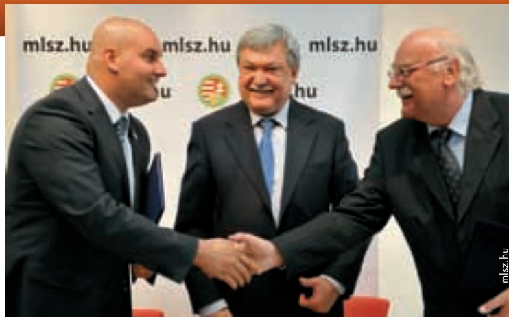
Staatssekretär Attila Czene, Verbandspräsident Sándor Csányi und Tamás Szabo, Leiter des nationalen Instituts für Jugendsport.

Die Klubs und Akademien mussten sich einem Auswahlverfahren unterziehen, in dessen Rahmen sie verschiedene Kriterien im Bereich des Fussballs und der Ausbildung zu erfüllen hatten. „Wir setzen strenge Standards, um zu gewährleisten, dass nur geeignete Ausbildungsstätten unterstützt werden“,