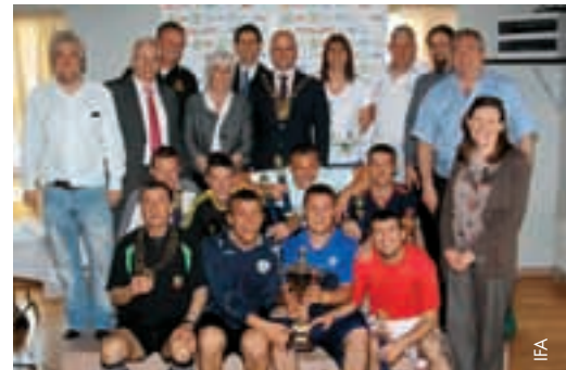
Die Sieger nach der Preisverleihung.

Unter dem Motto Integration kämpften 30 Teams aus dem ganzen Land, zu denen unter anderen Spieler aus Ghana, Nigeria und Afghanistan gehörten, um den Titel und legten dabei viel Können, Geschick und Fairness an den Tag. St. Catherine's Street League, Dublin, WHAD (We Have a Dream) konnte das Turnier zum zweiten Mal in Folge für sich entscheiden.