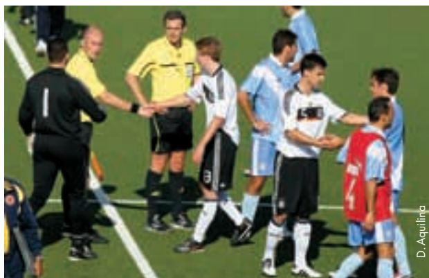
Bei der Partie zwischen der Auswahl von Württemberg (Deutschland) und La Gallega (Spanien) im Rahmen eines Miniturniers des UEFA-Regionen-Pokals in Malta wurde Fairplay gross geschrieben.

wurde. Hervorzuheben ist dabei, dass in Gruppe 5 sogar das Los entscheiden musste, ob die Auswahl aus Belgrad oder jene aus Südwest-Bulgarien zur Endrunde reisen darf, nachdem die beiden Teams nach den Gruppenspielen genau gleich viele Punkte auf ihrem Konto hatten. Das Schicksal war der serbischen Elf gewogen.