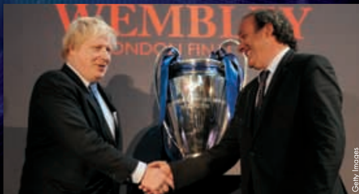
Michel Platini mit dem Bürgermeister von London, Boris Johnson.

Die beiden Klubwettbewerbstrophäen wurden im April in die Obhut der Bürgermeister von Dublin beziehungsweise London gegeben, wo sie verbleiben, bis sie von den Mannschaftsführern der Gewinner der UEFA Europa League und der UEFA Champions League in Empfang genommen werden können. ●