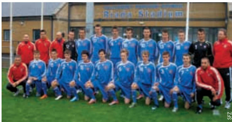
Die slowakische U18-Auswahl.