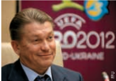
Oleg Blochin ist zurück.

Oleg Blochin ist zum neuen Trainer der Nationalmannschaft der Ukraine berufen worden, einem der beiden Gastgeber der