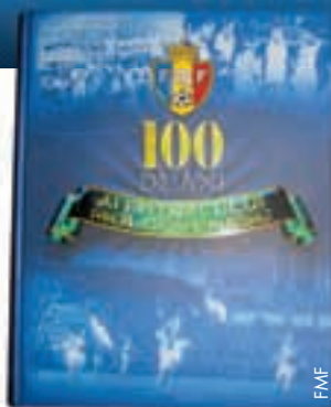
Das 100-Jahr-Buch des moldawischen Fussballs.

Rund 20 Journalisten und Fotografen waren an dem 575 Seiten starken Werk beteiligt. Neben 339 Seiten, auf denen die Geschichte der Sportart in Moldawien dargelegt und die berühmtesten Spieler, Führungspersonen und Stadien vorgestellt und mit jeder Menge Archibilder anschaulich illustriert werden, enthält die Gedenkschrift einen ausführlichen Statistikteil mit Wettbewerbssiegern, Torschützenkönigen, Spielern des Jahres sowie umfassenden Einzel-