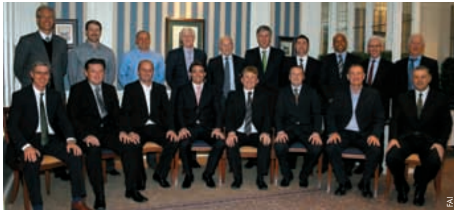
Die neuen Pro-Lizenz-Inhaber.