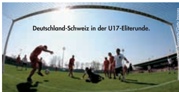
Deutschland-Schweiz in der U17-Eliterunde.

Im Halbfinale treffen nämlich der Titelverteidiger 1. FFC Turbine Potsdam und der FCR 2001 Duisburg aufeinander. Zuvor hatte Potsdam im Viertelfinale den französischen Klub FCF Juvisy Essonne ausgeschaltet, während Duisburg sich gegen die Engländerinnen aus Everton durchsetzen konnte. Die beiden anderen Halbfinalteilnehmer sind Vorjahresfinalist Olympique Lyon sowie der LFC Arsenal, die den russischen Verein WRC Zvezda 2005 Perm bzw. die Schwedinnen von Linköpings aus dem Rennen geworfen haben. Das Endspiel findet am 26. Mai im Stadion des FC Fulham in London statt. ●