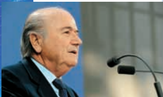
FIFA-Präsident Joseph S. Blatter.

Für FIFA-Präsident Joseph S. Blatter ist ein Wiedersehen mit Paris immer besonders, da er in dieser Stadt 1998 zum Präsidenten des Weltverbandes gewählt