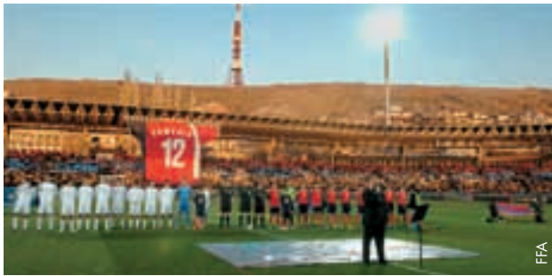
Positive Stimmung beim Spiel zwischen Armenien und Russland.

Drei interessante Events prägten im März die armenische Fussballwelt. Zunächst begann die neue Saison mit der nationalen