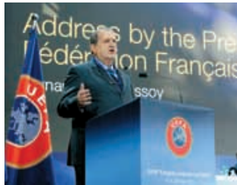
Fernand Duchaussoy, Präsident des Französischen Fussballverbands.

Der Präsident des Französischen Fussballverbands, Fernand Duchaussoy , lobte die Verdienste des UEFA-Präsidenten, eines Mannes, dem alles gelinge, was er anpacke und der es schaffe, seinen Worten Taten folgen zu lassen. Er erinnerte auch daran, dass die UEFA auch Wurzeln in Paris habe und wies auf die Pionierrolle von Henri Delaunay und Frankreichs bei der Schaffung der UEFA-Wettbewerbe hin. Abschliessend bedankte er sich bei der UEFA für das Vertrauen in den Französischen Fussballverband bezüglich der Ausrichtung der EURO 2016.