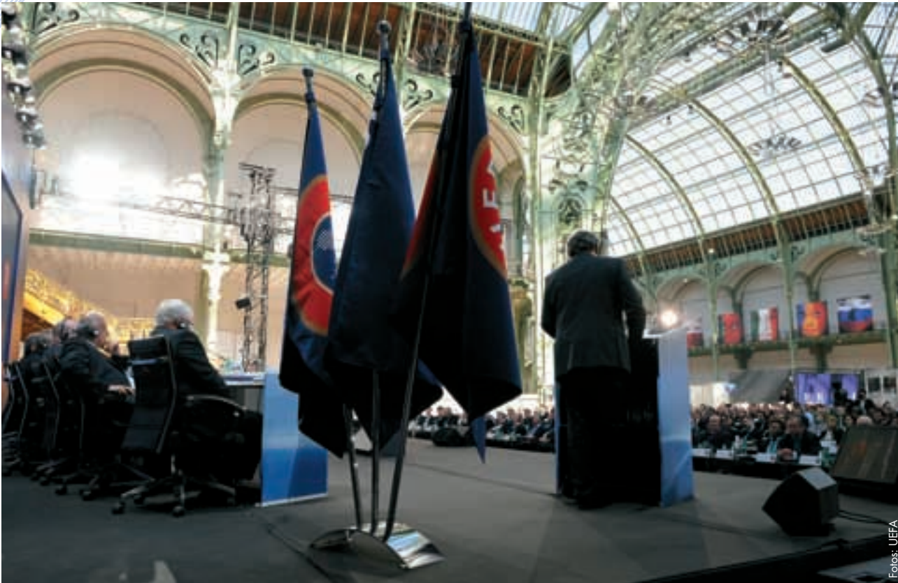
Michel Platini wendet sich nach seiner Wahl an die Teilnehmer.

Reform der Eintrittsliste der UEFA Champions League sowie der Schaffung der UEFA Europa League zum Ausdruck gekommen ist.