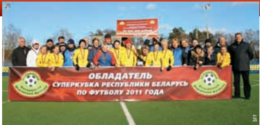
Bobruichanka gewinnt den Superpokal der Frauen.

Der Siegeswille war auf beiden Seiten sehr gross, was zur Folge hatte, dass zahlreiche Spielerinnen den Platz in Begleitung ihrer medizinischen Betreuer verlassen mussten.