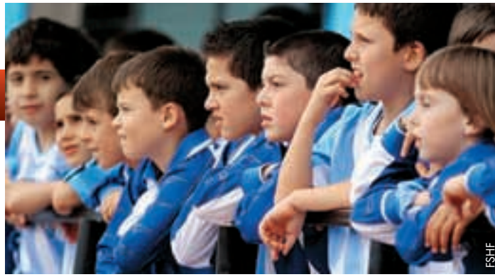
Fussball bald im Lehrplan.

Beim jüngsten Treffen zwischen dem albanischen Minister für Bildung und Wissenschaft, Myqerem Tafaj, und Verbandspräsident Armand Duka wurde deutlich, dass der albanische Staat bereit ist, eine solche Initiative zu fördern. Beim Treffen wurden auch die Massnahmen für die Umsetzung