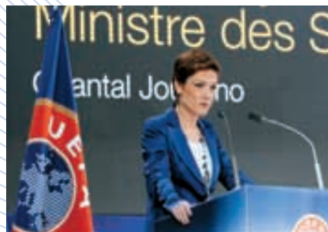
Die französische Sportministerin Chantal Jouanno.

Der Präsident des Französischen Fussballverbands, Fernand Duchaussoy , lobte die Verdienste des UEFA-Präsidenten, eines Mannes, dem alles gelinge, was er anpacke und der es schaffe, seinen Worten Taten folgen zu lassen. Er erinnerte auch daran, dass die UEFA auch Wurzeln in Paris habe und wies auf die Pionierrolle von Henri Delaunay und Frankreichs bei der Schaffung der UEFA-Wettbewerbe hin. Abschliessend bedankte er sich bei der UEFA für das Vertrauen in den Französischen Fussballverband bezüglich der Ausrichtung der EURO 2016.