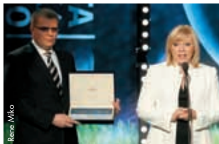
Präsident des Slowakischen Fussballverbands Ján Kováčik (mit dem UEFA-Verdienstorden) und Ivetta Radicová, slowakische Premierministerin.