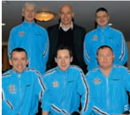
Howard Webb (oben, Mitte) mit den nordirischen Schiedsrichtern.

WM-Schiedsrichter Howard Webb war kürzlich zu Besuch in Nordirland und Ehrengast des Nordirischen Fussballverbands (IFA) bei einem Ausbildungsseminar in Belfast, an dem knapp