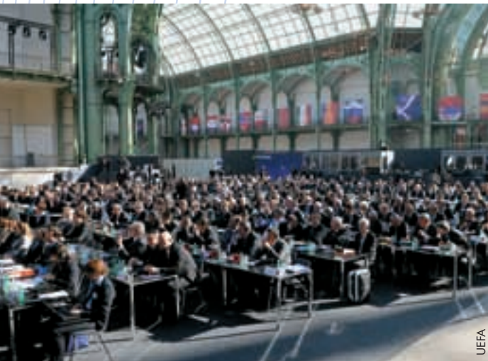
Die Delegierten der Nationalverbände.

Auch Wahlen für das FIFA-Exekutivkomitee standen auf der Tagesordnung. Angel María Villar Llona behält sein Amt als Vizepräsident, während Theo Zwanziger (Deutschland) zum Mitglied gewählt wurde. Da keine weiteren Kandidaten zur Verfügung standen, wurden beide per Akklamation gewählt. Der DFB-Präsident ersetzt seinen Landsmann Franz Beckenbauer, der nicht mehr kandidierte.