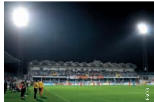
Das Stadion von Podgorica mit seiner neuen Flutlichtanlage.

Die Nationalmannschaften Montenegros und Usbekistans hatten die Ehre, die neue Flutlichtanlage im grössten Stadion des Landes, jenem von Podgorica, einzuweihen.