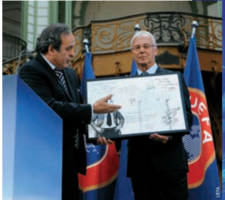
Nach dem Fotoalbum bei der Exekutivkomiteesitzung erhält Franz Beckenbauer am Ende des Kongresses ein anderes persönliches Geschenk.

Als Ort des XXXVI. Ordentlichen UEFA-Kongresses am 22. März 2012 wurde Istanbul gewählt. Die türkische Metropole war bereits im April 1978 einmal Schauplatz einer Jahresversammlung des europäischen Fußballs.