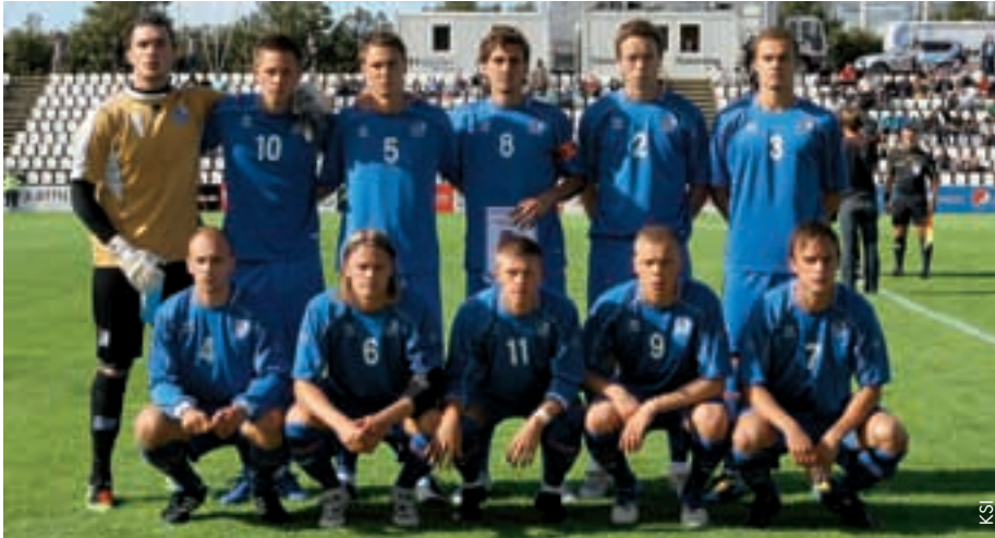
Das isländische U21-Team ist bereit für die Endrunde in Dänemark.