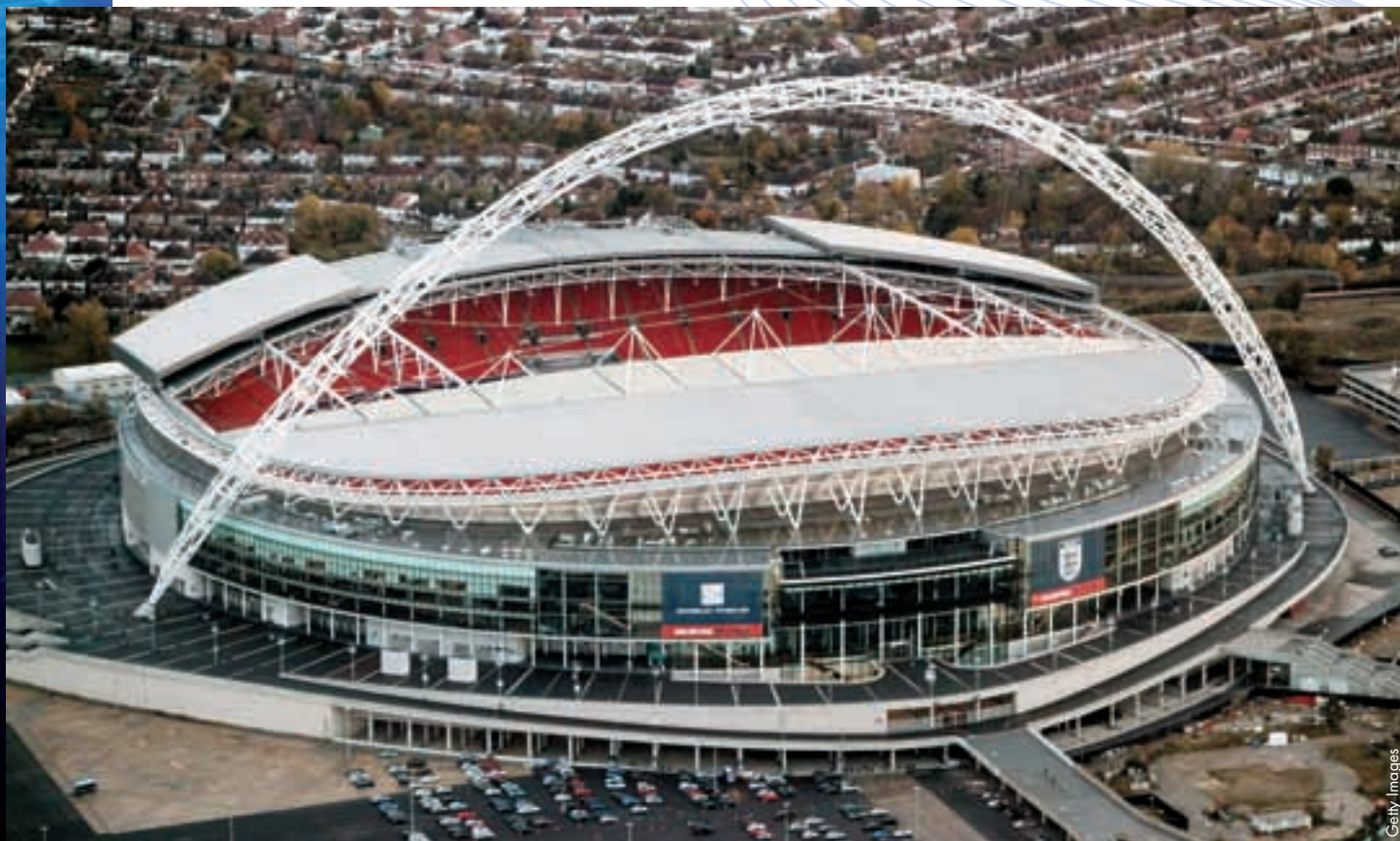
Das Wembley-Stadion mit seinem charakteristischen Bogen.

Unterdessen ist das Stadion einem Neubau gewichen. Die alte Arena wurde 2003 abgerissen und die legendären Twin Towers wurden durch einen majestätischen Bogen ersetzt, der hoch über dem Stadion thront. Die atemberaubende neue Spielstätte wurde 2007 eröffnet und bietet 90 000 Zuschauern Platz. „Das neue Wembley ist ein Prachtsbau“, meint Gary Lineker, Endspielbotschafter 2011. „Für jeden Spieler ist es nach wie vor ein Traum, in Wembley zu spielen, erst recht, wenn es um das Finale der UEFA Champions League geht. Für einen Fussballer ist es so ziemlich das Grösste, diese Treppe hochzugehen, um einen Pokal entgegenzunehmen.“