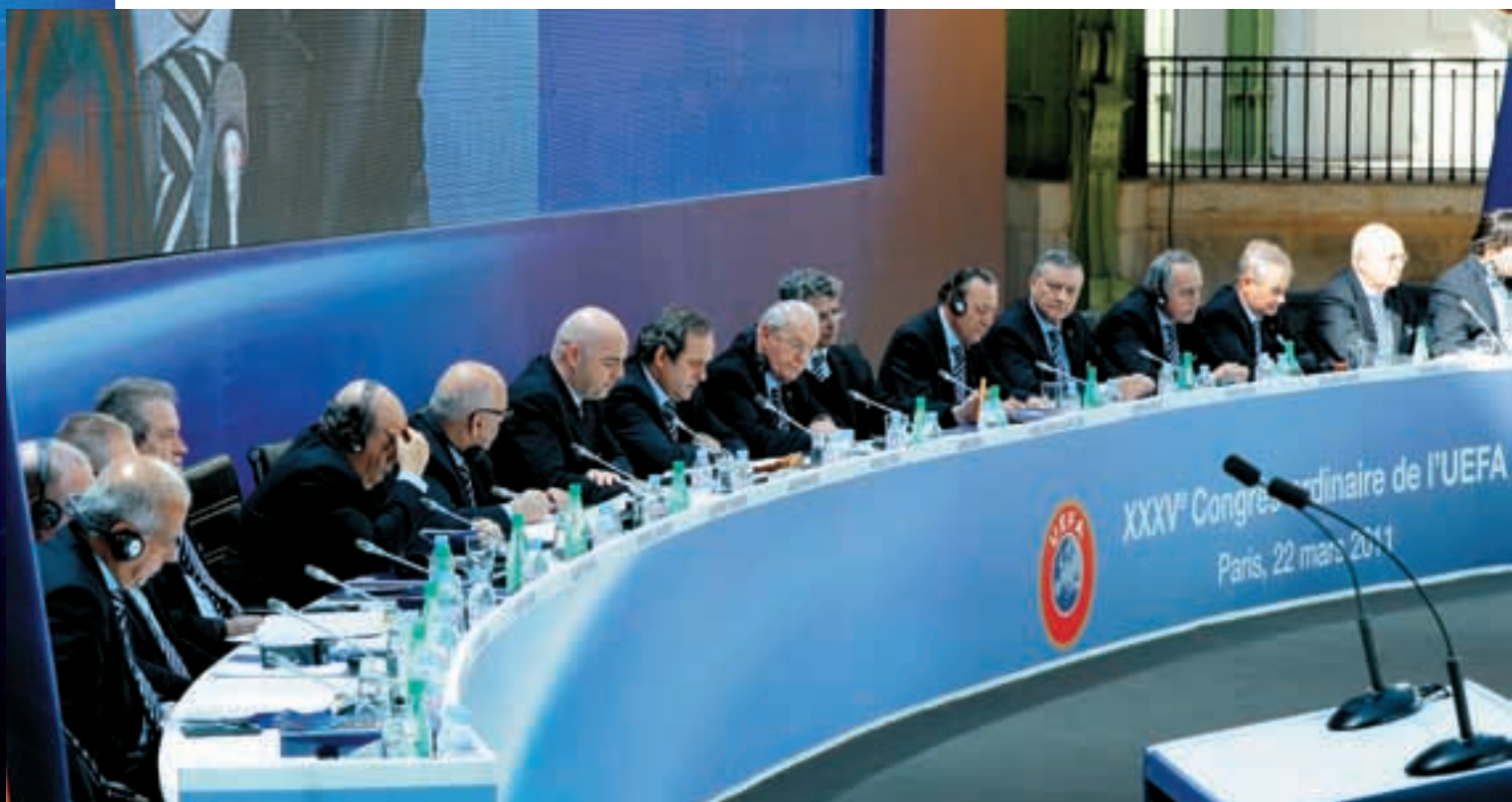
Das Exekutivkomitee beim Kongress.

Die Garantie der Universalität der Wettbewerbe war das dritte Engagement, das insbesondere durch die Erweiterung der EURO 2016 auf 24 Teilnehmer und die