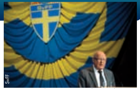
Eine weitere, letzte Amtszeit als Präsident für Lars-Åke Lagrell.

Die Versammlung brachte noch mehr Erfreuliches zutage: Die Zahl der aktiven Spieler nahm zum achten Mal in Folge zu, mehrere moderne Stadien sind im Bau und in der Nachwuchsförderung werden grosse Fortschritte erzielt. Zu den wichtigsten Herausforderungen des Verbands