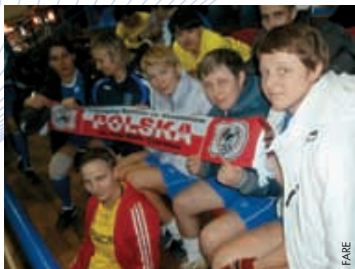
Die polnischen Juniorinnen beim Turnier in der Ukraine.

Das Turnier war von einer freundschaftlichen Atmosphäre auf und neben dem Spielfeld geprägt und diente dazu, über Projekte gegen Diskriminierung zu sprechen. ●