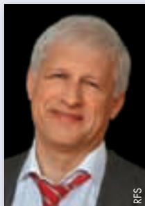
Sergey Fursenko (Russland)

Sergey Fursenko wurde am 11. März 1954 geboren. Seit Februar 2010 ist er Präsident des Russischen Fussballverbands. Von 2005 bis 2008 war er Vorstandsvorsitzender des UEFA-Pokal-Gewinners von 2008, FC Zenit St. Petersburg.