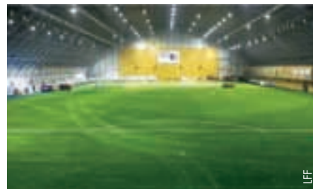
Das Spielfeld in der Skonto-Halle.

Der 27. Januar war ein grosser Tag für das lettische Schiedsrichterwesen, wurde Lettland doch in die UEFA-Schiedsrichterkonvention aufgenommen.