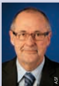
Peter Gilliéron (Schweiz)

Der am 5. Mai 1953 geborene Peter Gilliéron war zunächst von 1994 bis 2009 Generalsekretär des Schweizerischen Fussballverbands, bevor er 2009 dessen Präsident wurde. Seit 1998 ist er in verschiedenen UEFA-Kommissionen tätig, derzeit als Vizevorsitzender der Kommission für Stadien und Sicherheit.