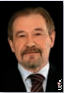
Gilberto Madaíl (Portugal)

„Mit 47 Jahren Erfahrung im Fussball (als Spieler und Offizieller) auf nationaler und internationaler Ebene im Dienste der grossen europäischen Fussballfamilie erachte ich dies zunächst als meine Pflicht. Zusammen mit meinen Kollegen des UEFA-Exekutivkomitees habe ich versucht – und es ist uns meiner Meinung nach gelungen –, mehrere Unterstützungs-, Wissensvermittlungs- und Kooperationsprogramme in verschiedenen Bereichen ins Leben zu rufen bzw. weiterzuentwickeln. Ich bin mir selbstverständlich bewusst, dass noch viel zu tun bleibt und noch beträchtliches Verbesserungspotenzial vorhanden ist. Ich begrüsse das grosse Engagement, das alle Nationalverbände für die erfolgreiche Umsetzung dieser Projekte an den Tag legen, und stelle mich neben meiner bereits erwähnten Erfahrung auch zur Wiederwahl, da ich die Möglichkeit erhalten möchte, meine Vorstellungen und Projekte weiter zu vermitteln und fortzuführen. Ausserdem möchte ich die vielversprechendsten Ideen, die von den Mitgliedern, der Administration und meinen Exekutivkomiteekollegen an die UEFA herangetragen werden, unterstützen. Wir vertreten die UEFA-Mitglieder, wir alle bilden zusammen die grosse europäische Fussballfamilie und ich denke, dass ich meine diesbezügliche Aufgabe für vier weitere Jahre wahrnehmen kann. Für mich wäre dies nicht nur eine Pflicht – wie eingangs erwähnt –, sondern auch eine grosse Ehre und Verantwortung.“ ●