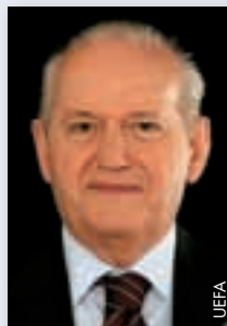
Senes Erzik (Türkei)

Kurz gesagt, halte ich mich dank meinem Wissen und meiner Erfahrung für gerüstet, um dieses wichtige Amt innerhalb der UEFA auszuüben.“ ●