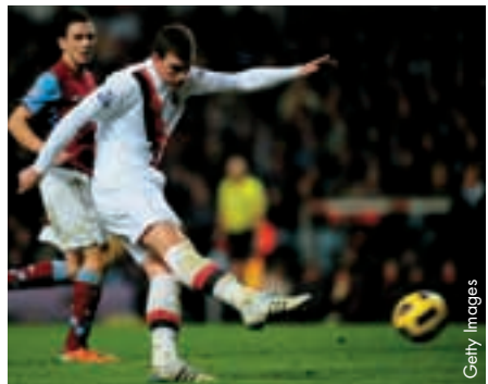
Edin Dzeko hat seine Feuertaufe bei Manchester City bereits hinter sich.

Nationalstürmer Edin Dzeko (24) wurde zum zweiten Mal in Folge zum „Idol der Nation“ gewählt. Für diese Auszeichnung standen zehn Spieler zur Auswahl, die vom ehemaligen bosnisch-herzegowinischen Internationalen Muhamed Konjic nominiert worden waren: Edin Dzeko (Wolfsburg), Emir Spahic (Montpellier), Zvezdan Misimovic (Galatasaray), Miralem Pjanic (Olympique Lyon), Ermin Zec (Genclerbirligi), Samir Bekric (Incheon United), Senijad Ibrahimovic (Hajduk Split), Sasa Papac (Glasgow Rangers), Asmir Begovic (Stoke City) und Sejad Salihovic (Hoffenheim).