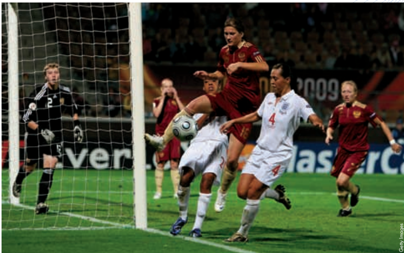
Russland - England in einem Gruppenspiel der Women's EURO 2009.

Die Fläche des Landes stellte den Russischen Fußballverband vor Probleme: Die oberste Spielklasse mit den sieben besten Teams des Landes ist national organisiert, die Vereine befinden sich jedoch hauptsächlich im Westen Russlands, in der Nähe von Moskau, um genau zu sein: Die Stadt Perm an der Grenze zum westlichen Ural ist am weitesten entfernt. Die sieben Profivereine treffen in je zwei Heim- und zwei Auswärtsspielen insgesamt