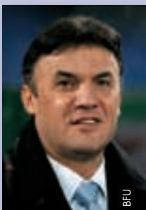
Borislav Mihaylov (Bulgarien)

Ich bin fest davon überzeugt, dass ich weiterhin einen Beitrag zur Entwicklung und Einheit des Fussballs leisten kann, so wie ich es bisher als Exekutivkomiteemitglied, Vorsitzender der UEFA-Kommission für Nationalmannschaftswettbewerbe und stellvertretender Vorsitzender der UEFA-Kommission für Junioren- und Amateurfussball getan habe.“ ●