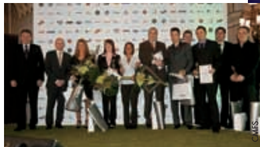
Die Preisträger des Jahres 2010.

Im traditionsreichen Palast Zofin, gegenüber dem Nationaltheater in Prag, wo seit über hundert Jahren zahllose prestigeträchtige Veranstaltungen stattfinden, wurden schon zum neunten Mal die Besten des tschechischen Amateur- und Nachwuchsfussballs ausgezeichnet – dieses Mal fürs Jahr 2010.