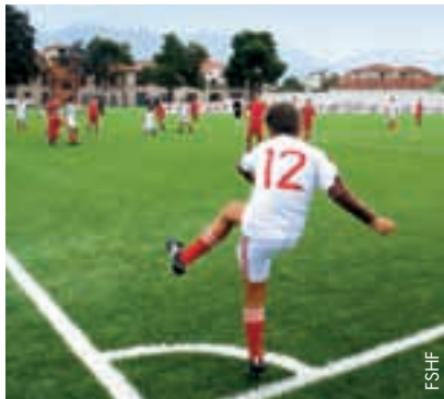
Die Zahl der Juniorenteams soll sich bis 2014 verdoppeln.

Mit diesen Neuerungen möchte das Exekutivkomitee das Generalsekretariat bei der Bewältigung des gestiegenen Arbeitsvolumens unterstützen und die ehrgeizigen Ziele erreichen, die sich der Verband bis 2014