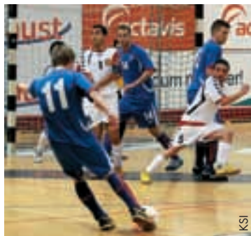
Die Begegnung Island – Armenien.