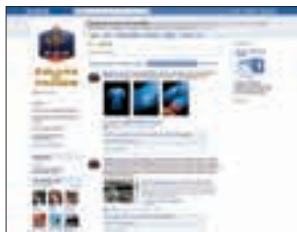
Die offizielle Facebook-Seite der französischen Nationalmannschaft.