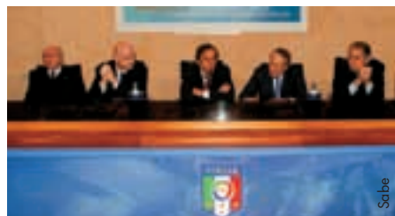
Seminar über aktuelle Themen des europäischen Fußballs.