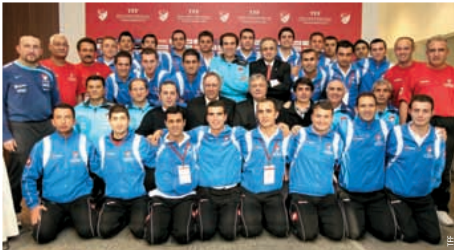
Fortbildungskurs für die Schiedsrichter.