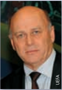
Grzegorz Lato (Polen)

Der ehemalige polnische Nationalspieler Grzegorz Lato wurde am 8. April 1950 geboren. Seit Oktober 2008 ist er Präsident des Polnischen Fussballverbands. Er ist ausserdem Vizevorsitzender der Fussballkommission der UEFA.