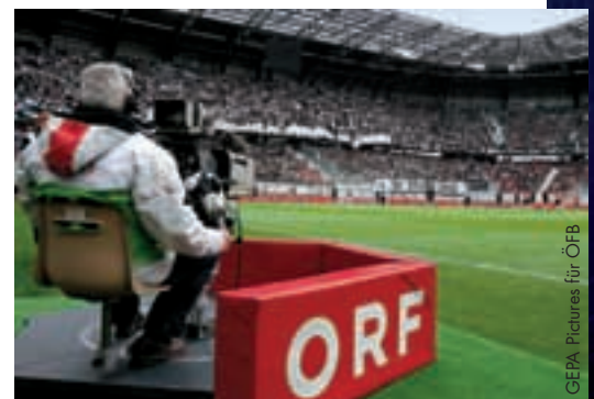
Stattliche Einschaltquoten für das österreichische Fernsehen.

Vauxhall und die IFA schlossen einen Vertrag über dreieinhalb Jahre ab. Das Sponsoring umfasst unter anderem alle Spiele der A-Nationalmannschaft, also auch jene im Rahmen der Qualifikation zur EURO 2012 und zur WM 2014 in Brasilien, schliesst aber auch die Frauen- und Juniorennationalteams ein.