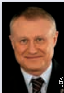
Grigoriy Surkis (Ukraine)

Grigoriy Surkis, geboren am 4. September 1949, steht seit 2000 an der Spitze des Ukrainischen Fussballverbands. Parallel dazu ist er Vizevorsitzender des Olympischen Komitees seines Landes. Nachdem er von 2004 bis 2007 beigezogenes Mitglied des UEFA-Exekutivkomitees war, wurde er 2007 ordentliches Mitglied der Exekutive. Zurzeit ist er Vorsitzender der Kommission für Junioren- und Amateurfussball.