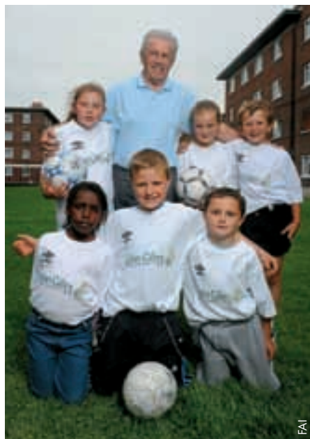
Der legendäre John Giles setzt sich für das lokale Vereinsleben und vor allem für die Jugend ein.