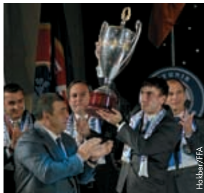
Pyunik Ararat mit der Meistertrophäe.