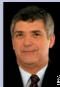
Ángel María Villar Llona (Spanien)

Ich bin der Ansicht, dass Kontinuität im Fussball wichtig ist und hoffe, meine Ziele im Rahmen meiner Arbeit zugunsten der gesamten europäischen Fussballfamilie weiterverfolgen zu können.“ ●