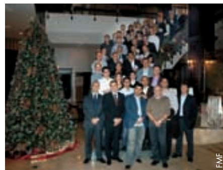
Die Teilnehmer des KISS-Workshops.