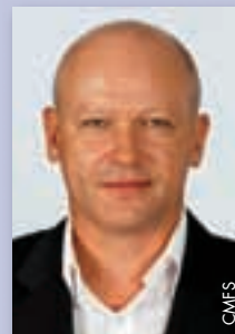
Ivan Hašek (Tschechische Republik)

steht das qualitative und quantitative Wachstum der UEFA und der Mitgliedsverbände, ohne dabei das finanzielle Gleichgewicht aufs Spiel zu setzen. Aus sportlicher Sicht möchte ich mich für die Förderung sowohl des Nationalmannschafts- als auch des Klubfussballs einsetzen. Die von der UEFA durchgeführten Turniere und Wettbewerbe für Klubs und Nationalmannschaften bilden die finanzielle Grundlage der UEFA und gleichzeitig zahlreicher Mitgliedsverbände. Aus diesem Grund müssen diese attraktiven Wettbewerbe gleichermaßen gefördert und geschützt werden. Die Verbände sollten die finanziellen Mittel für die Förderung des Breiten- und des Profifussballs in ihren Ländern einsetzen und dabei besonders auf die langfristige finanzielle Stabilität des Verbands und der Klubs achten. Profi- und Breitenfussball müssen parallel gefördert werden. Die politische, wirtschaftliche und soziale Bedeutung des Fussballs muss in der Gesellschaft anerkannt werden. Ich weiss, was getan werden muss, um die Position des europäischen Fussballs zu festigen und sogar zu verbessern, und als Schweizer bin ich es gewohnt, mit Menschen aus verschiedenen Kultur- und Sprachregionen zusammenzuarbeiten. Wie auf dem Spielfeld gilt es dabei, in erster Linie Respekt und Fairplay walten zu lassen.“ ●