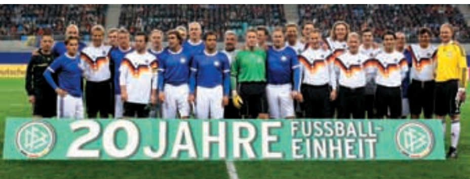
Galaspiel zwischen Weltmeistern und ehemaligen DDR-Nationalspielern.