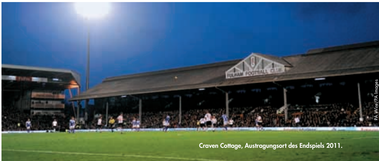
Craven Cottage, Austragungsort des Endspiels 2011.