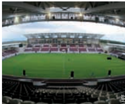
Das neue Stadion in Larissa.

Der diesjährige Teilnehmer Keflavik war im August sogar Ausrichter eines Miniturniers der Futsal-Pokal-Vorrunde. Das Team traf in seiner Gruppe auf Mannschaften aus Schweden, Frankreich und den Niederlanden. Auch wenn die Gastgeber nur einen Sieg verbuchen konnten, war das Turnier ein Erfolg. Dieser bestärkte den Isländischen Fussballverband darin, sich für die Ausrichtung eines Miniturniers der EM-Qualifikation zu bewerben. Die UEFA akzeptierte die Bewerbung und so wird die isländische Gruppe ihre Spiele vom 21. bis 24. Januar 2011 in der Asvellir-Halle in Hafnarfjörður austragen. ● Thor Ingimundarson