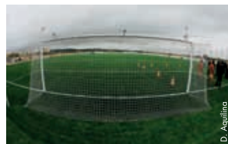
Das neue Spielfeld des FC Siggiewi.