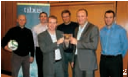
Erfreuliche Auszeichnung für die Website des Nordirischen Fussballverbands.

und ich möchte all denen danken, die an diesem Projekt beteiligt waren, vom IFA-Marketingteam bis zu unserem Partner Tibus. Der Preis ist ein Beleg dafür, wie professionell bei der IFA gearbeitet wird.“