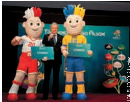
LOK EURO 2012, Ukraine

Der Präsident des Ukrainischen Fussballverbands Grigoriy Surkis betonte die Bedeutung ihrer Rolle. „Die beiden Maskottchen stehen für die gemeinsamen An-