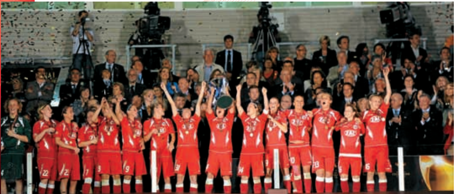
Der 1. FFC Turbine Potsdam hat das erste Endspiel der UEFA Women's Champions League gewonnen, das wie das Männer-Finale in Madrid ausgetragen wurde.

Bevor wir uns mit den wirtschaftlichen Aspekten des Wettbewerbs befassen, wenden wir uns dem sportlichen Ablauf zu: Grundsätzlich stellt jeder Verband einen Teilnehmer. Die acht bestplatzierten Verbände haben Anrecht auf einen zweiten Vertreter, wobei 2009/10 und 2010/11 jeweils eine Mannschaft erst im Sechzehntelfinale, die andere bereits in der Qualifikationsrunde in den Wettbewerb einstieg und ab der Saison 2011/12 beide Vertreter dieser acht Verbände erst in der K.-o.-Phase beginnen werden. Die Qualifikation findet im August in Form von Miniturnieren mit Gruppen à vier Teams, die jeweils einmal gegeneinander antreten, statt. Die Gruppensieger und je nach Anzahl Teilnehmer einer oder mehrere Gruppenzweite qualifizieren sich für die nächste Runde. Ab dem Sechzehntelfinale, das ab