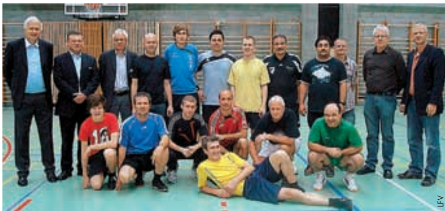
Kurs für die Liechtensteiner Schiedsrichter.