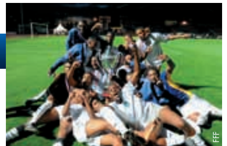
Martinique entschied den Übersee-Pokal für sich.

Am Ende des vierzehn Partien umfassenden Turniers stand eine Neuauflage des Endspiels von 2008, in dem sich Martinique gegen Titelverteidiger Réunion erst im Elfmeterschiessen durchsetzte. 6 000 Besucher verfolgten die Begegnung im Stade Dominique Duvauchelle de Créteil, die trotz fehlender Tore in der regulären Spielzeit bis zum Ende packend blieb. Mit fünf