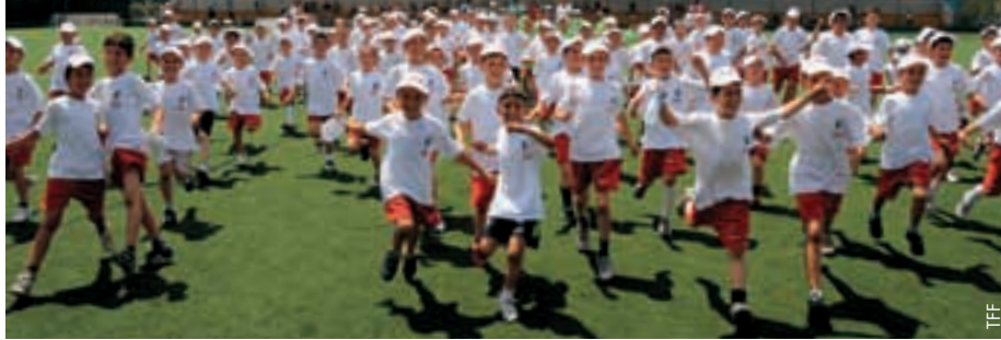
Fußball für alle im ganzen Land.

Rahmen seines Breitenfußballprogramms „Fußball für alle“ organisiert. 2009 stieg die Zahl der „Fußball für alle“-Teilnehmer auf 240 000. Mit der Unterstützung des Sponsors Ülker wurden zahlreiche Projekte für Kinder durchgeführt. Diese Aktivitäten brachten der TFF damals den zweiten Stern ein. Den dritten Stern für sein Breitenfußballprogramm erhielt der türkische