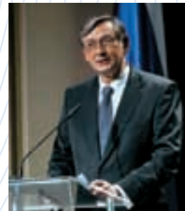
Der slowenische Staatspräsident Danilo Türk.

Fussballs erfüllen mich mit Stolz und Freude und ich bin sicher, dass es allen Slowenen ebenso geht. Der Fussball hat in unserem Land eine lange Tradition und viele Fans. Er ist ein Volkssport. Die Leistungen der Nationalmannschaft haben den Namen Sloweniens in die Welt hinausgetragen. Durch seine herausragende Qualität hat der Fussball gezeigt, wie unser Land weltweite Anerkennung erlangen kann. Deshalb danke ich dem Slowenischen Fussballverband, den im Fussball tätigen Personen und Fussballern. Sie sind die Elite.“