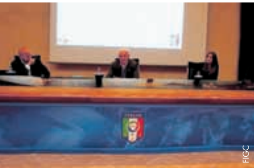
Arrigo Sacchi macht sich für ein neues Grundkonzept in der Nachwuchsförderung stark.