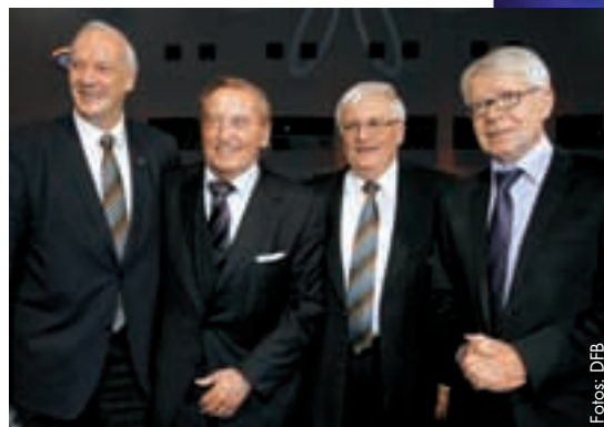
Vier ehemalige und aktuelle Präsidenten (von links nach rechts): Hans-Georg Moldenhauer (DFV), Gerhard Mayer-Vorfelder (DFB), Theo Zwanziger (DFB) und Reinhard Rauball (DFL).

Begonnen hatten die Feierlichkeiten zum 20. Jubiläum der deutschen Fussballeinheit bereits am Abend vor der Gala mit dem „Spiel der Legenden“. Vor 15400 Zuschauern verlor das DFB-Weltmeisterteam von 1990 um Jürgen Klinsmann, Lothar Matthäus und Guido Buchwald gegen eine DDR-Auswahl mit Ulf Kirsten und Andreas Thom mit 1:2. Natürlich unter den Augen von Michel Platini, der gegen viele dieser Akteure noch gespielt hat. „Ich kann mich noch gut an unsere Länderspiele gegen Deutschland in Zeiten der Trennung erinnern. Manchmal trugen die Gegenspieler weisse Trikots, manchmal blaue und wir haben meistens verloren“, verrät Platini. Das allerdings sei nicht der Hauptgrund dafür gewesen, dass auch er sich sehr über die politische und fussballerische Vereinigung der beiden deutschen Staaten gefreut habe. „Durch die Wiedervereinigung bekamen die Menschen in Deutschland und Europa mehr Freiheit. Und diese Freiheit ist das wichtigste Gut in unserer Gesellschaft und im Fussball“, sagt der UEFA-Präsident. Auf Deutsch natürlich.