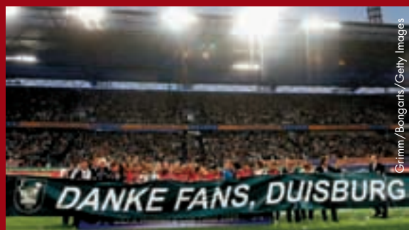
Rekordkulisse beim Spiel des FCR 2001 Duisburg.