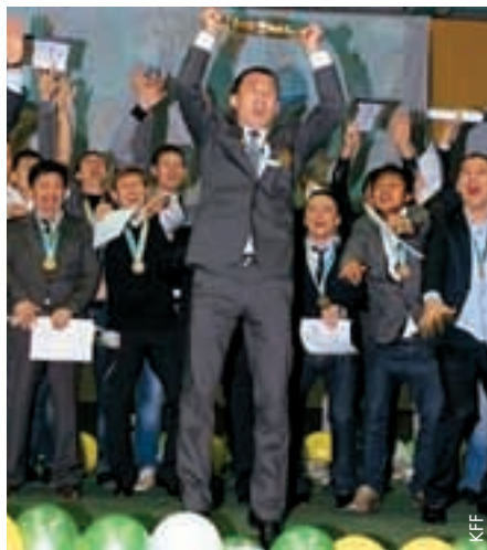
Erster kasachischer Meistertitel für den FC Kostanay Tobol.

Die abgelaufene Meisterschaft wurde in einem neuen Wettbewerbsformat ausgetragen. In der ersten Phase spielten alle zwölf Teams je zweimal gegeneinander. Gemäss den Ergebnissen der ersten Phase wurden die Mannschaften in zwei Gruppen eingeteilt: Die ersten sechs Teams spielten um Platz 1 bis 6 aus, die restlichen um Platz 7 bis 12.