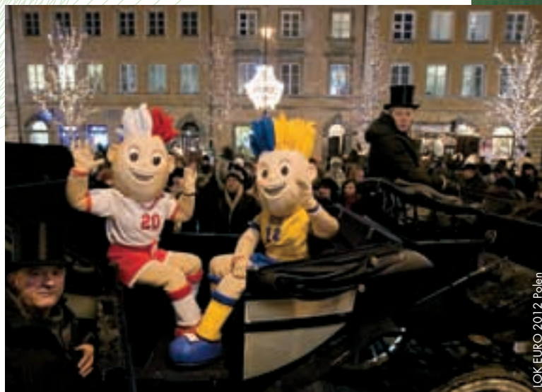
LOK EURO 2012, Polen