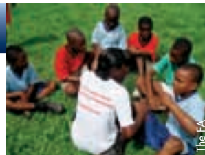
Eine junge Trainerin aus Trinidad setzt das Gelernte um.

„Die Reise war für mich ein Wahnsinnsereignis. Ich habe herausgefunden, was ich