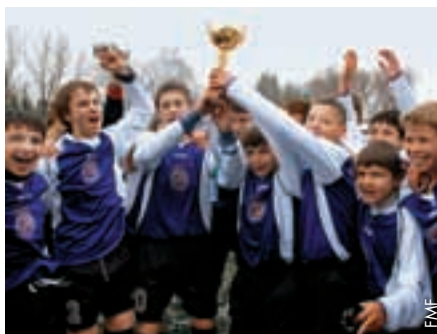
Das Ost-Team gewann das Turnier.