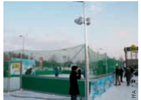
Winterfussball mit Beach-Soccer-Atmosphäre.

Nordeuropa lag im Dezember grösstenteils unter einer Schneedecke, doch in Lettland wurde trotzdem im Freien Fussball gespielt. In Zusammenarbeit mit der Marketingagentur Inspired hat der Lettische Fussballverband (LFF) in Riga ein besonderes Spielfeld für Fussball auf Schnee bereitgestellt.