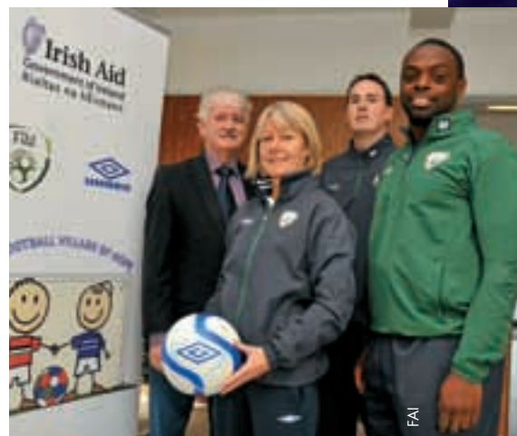
Die FAI-Vertreter im Fussballdorf der Hoffnung.