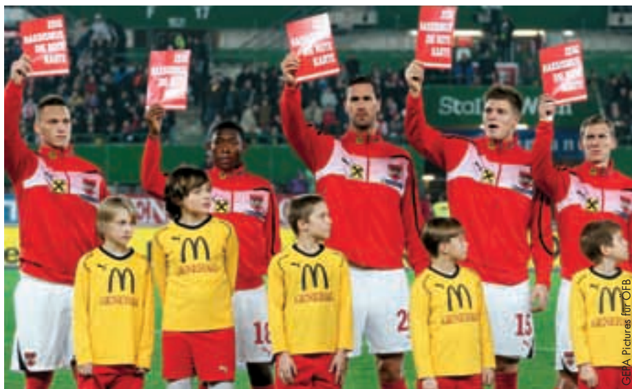
Die österreichischen Nationalspieler setzen ein Zeichen gegen Rassismus.