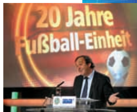
Michel Platini überbrachte Glückwünsche und persönliche Erinnerungen.