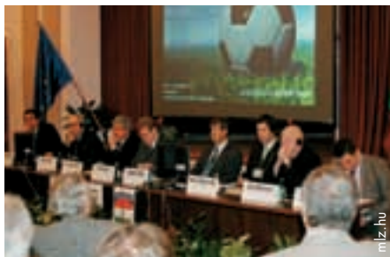
Ungarn will entschlossen gegen Hooligans vorgehen.